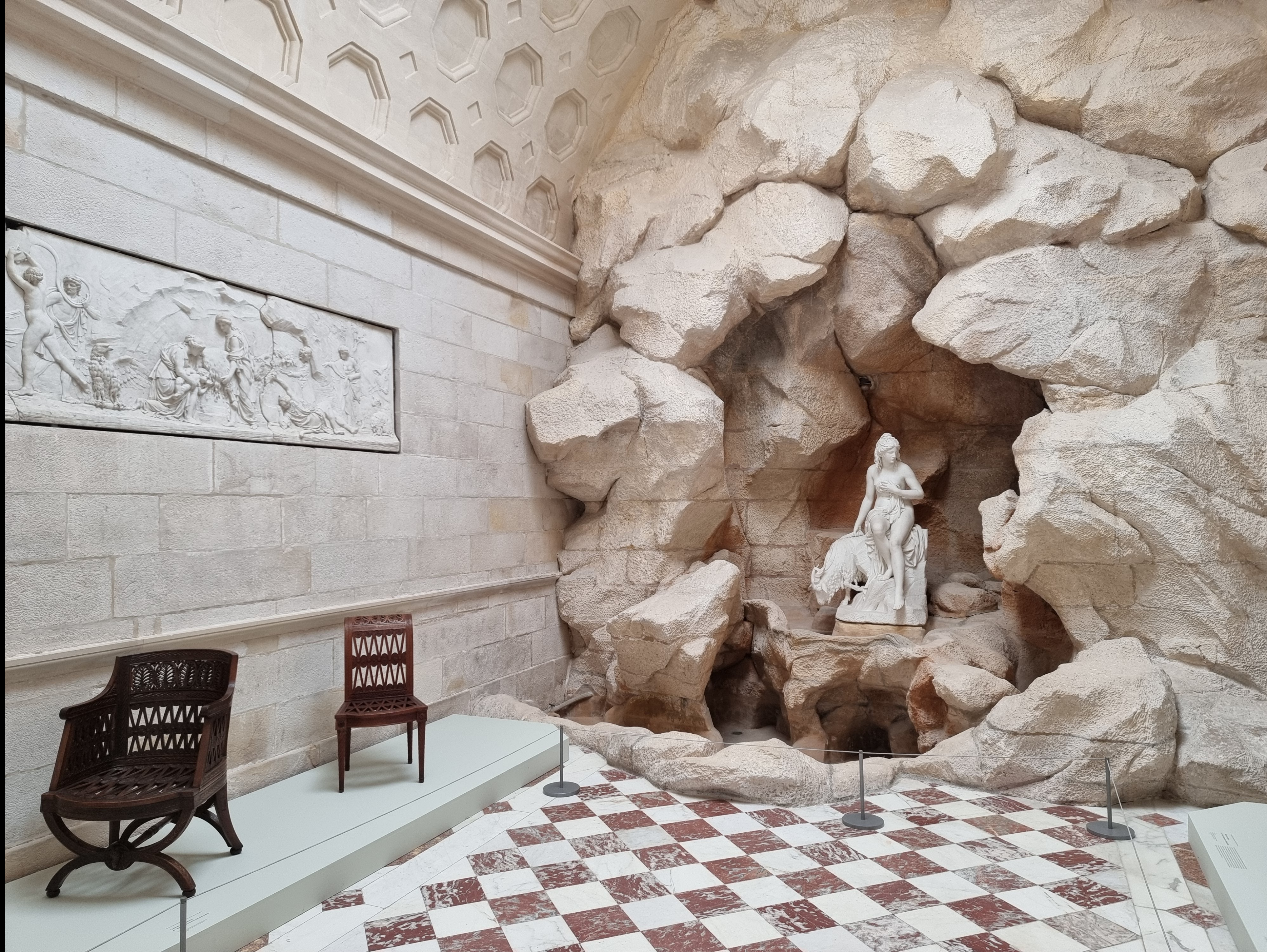
Laiterie de la Reine, Château de Rambouillet, 1785