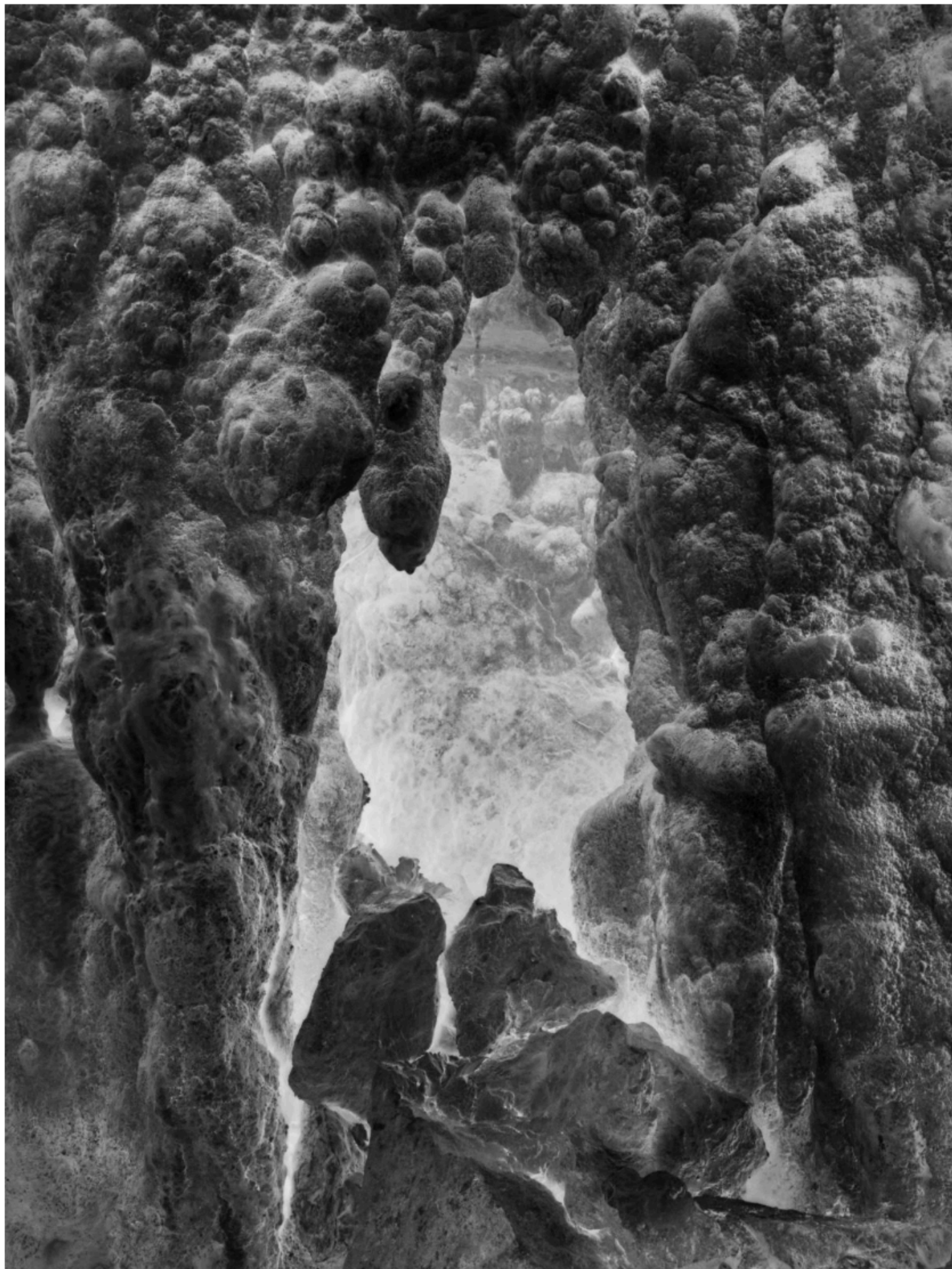
Juliette Agnel, La main de l'enfant , Arles, Les rencontres de la photographie, 2023