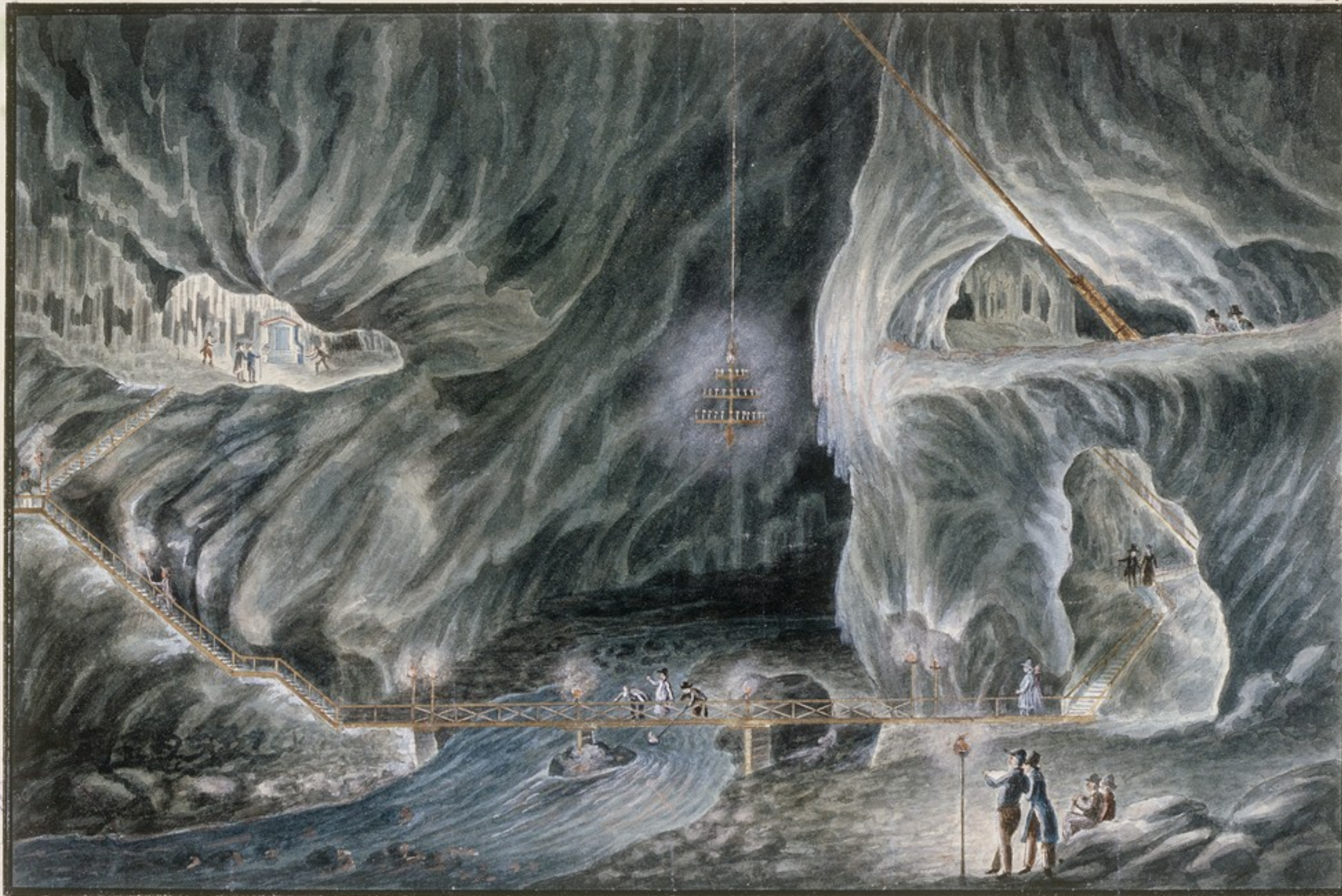
Ansicht des grossen Domes. (85. W.K. vom Eingange)

Alojzij Schaffenrath (1794-1836), Postojnska jama, pogled na Veliko jamo (Postojna Cave), 1821 c, gouache on paper, National Museum of Slovenia