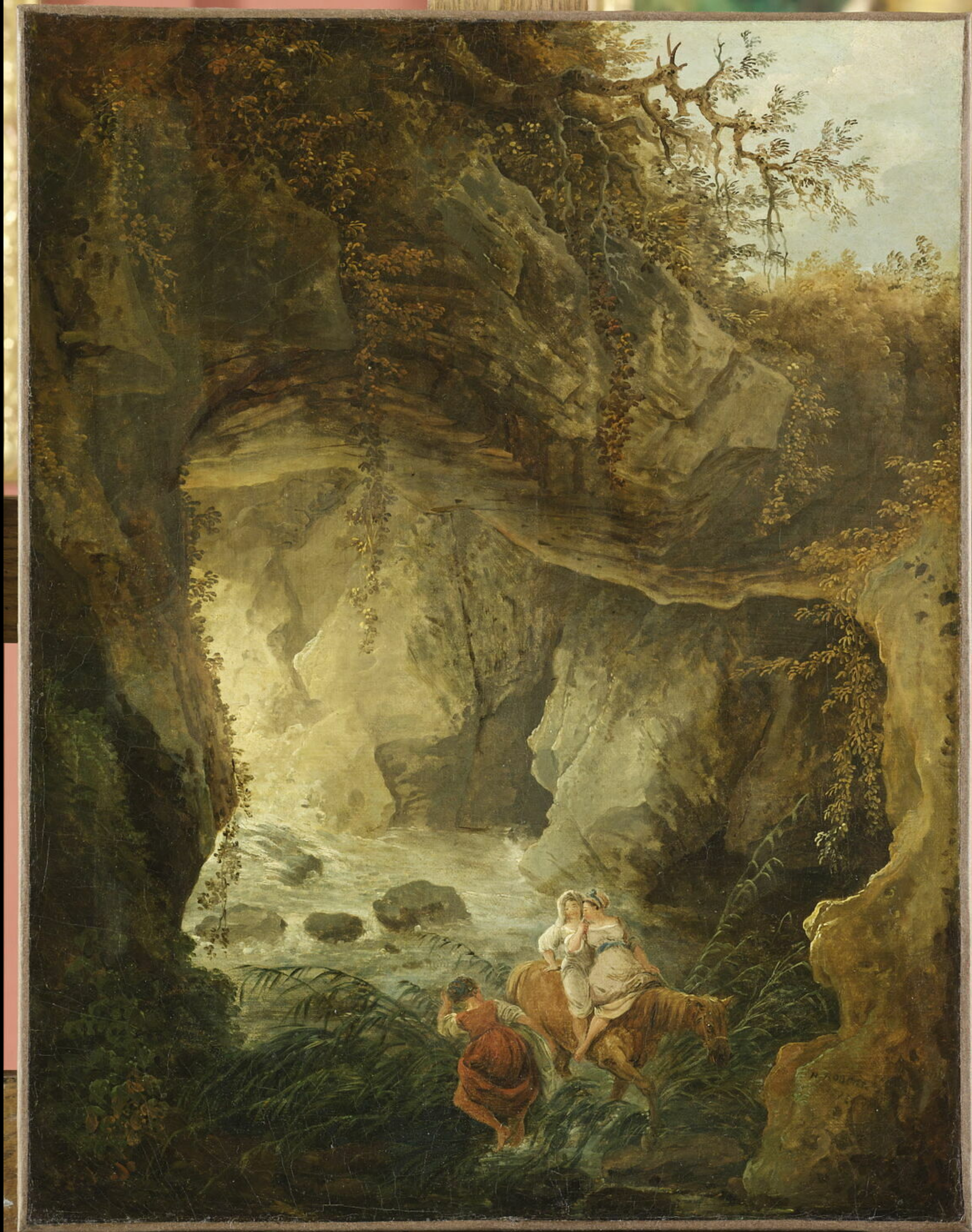
Hubert Robert, La grotte , 1772, huile sur toile, 57,5x44,5 cm, Paris, Musée du Louvre