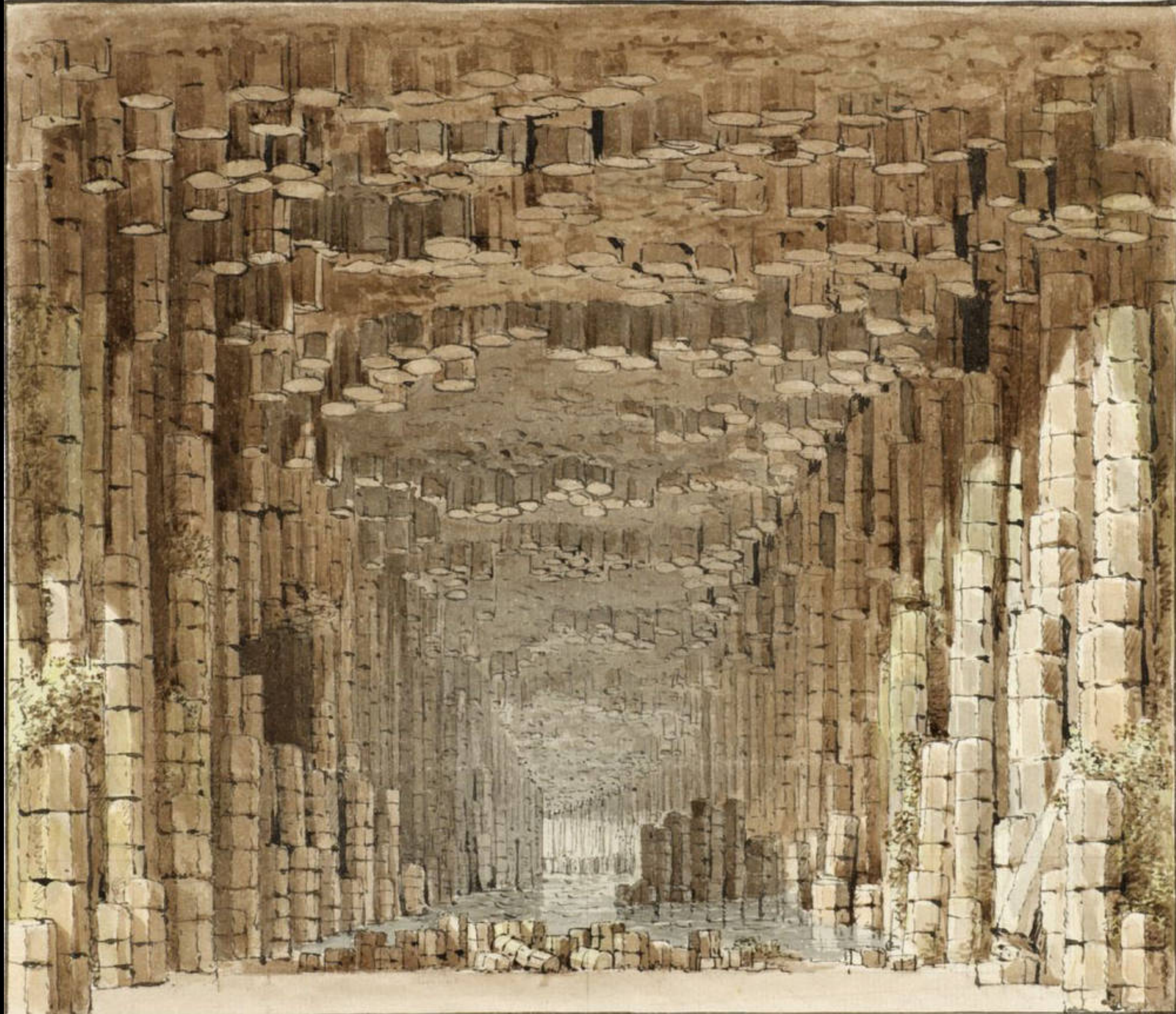
Carl Gustav Carus, Das Innere der Fingalshöhle auf der Insel Staffa , 1810-15?, Pen-and-ink drawing in black and watercolour over pencil, framing line in pen-and-ink drawing in black, 277x320mm., Dresden, Staatliches Kupferstichkabinett