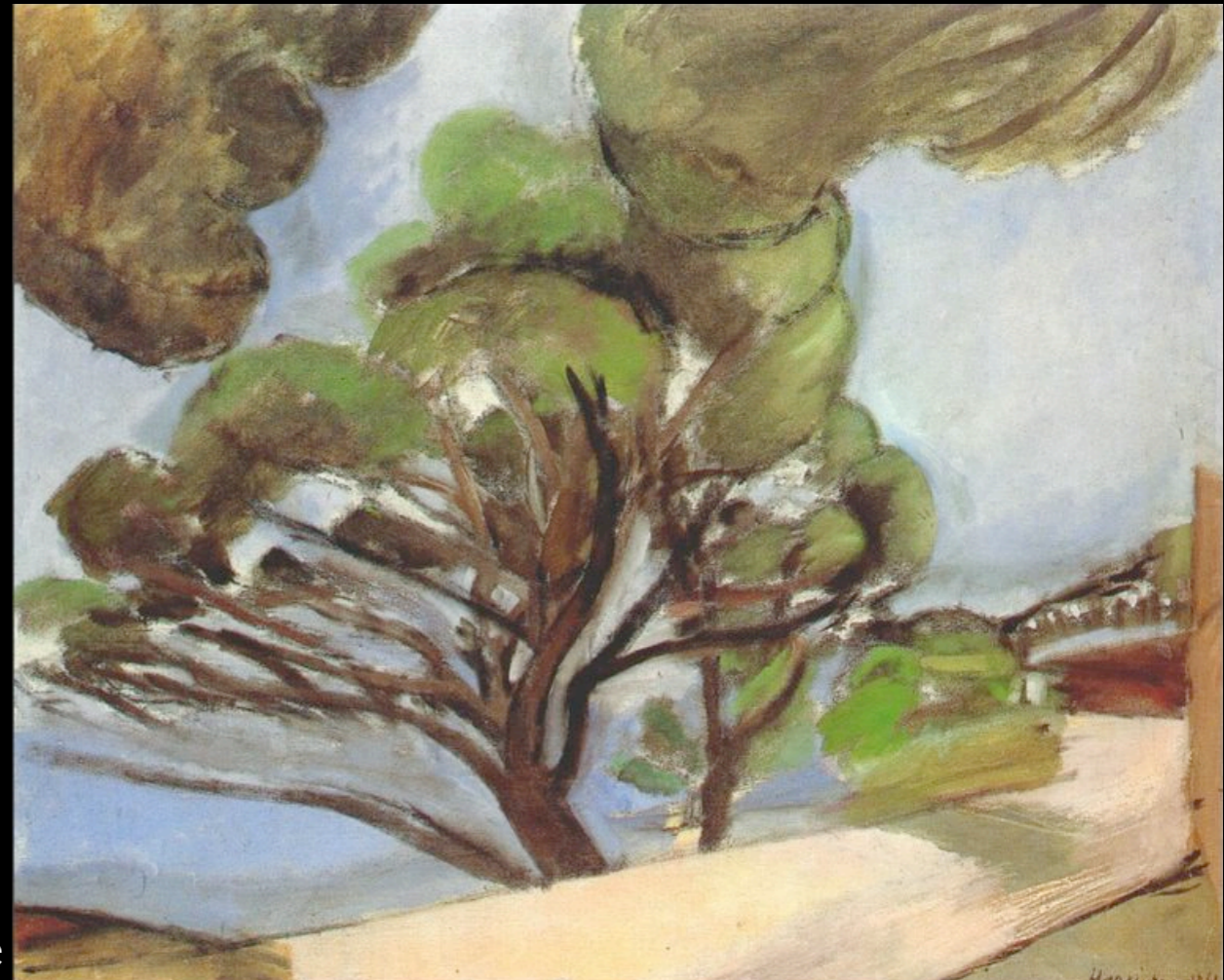
Route du Cap d'Antibes, le grand pin , 1926, huile sur toile, 50,5 x 61 cm, collection particulière