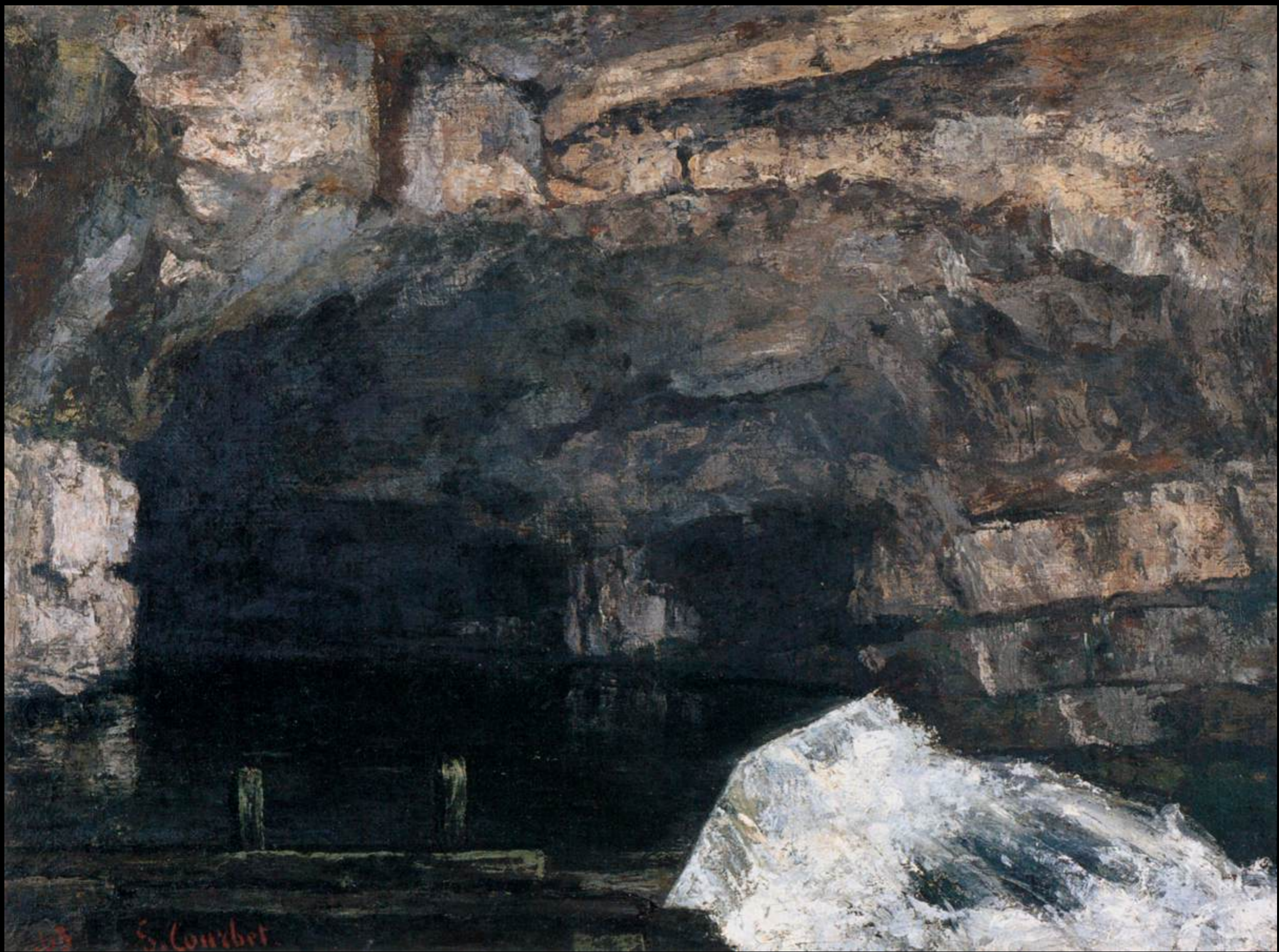
Gustave Courbet, Source de la Loue , 84x107 cm, 1864, Kunsthaus de Zurich