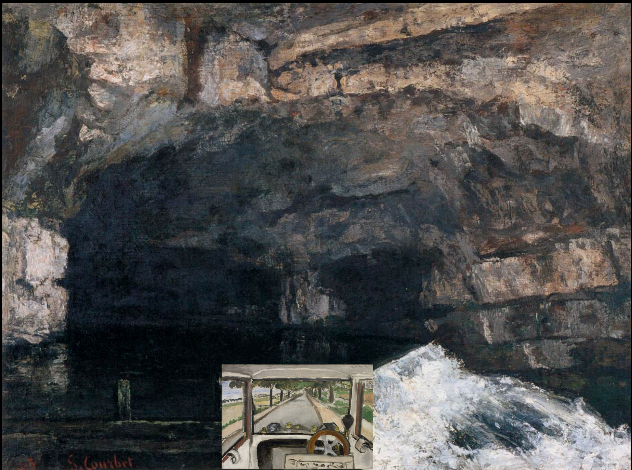
Courbet, Source de la Loue , 1864