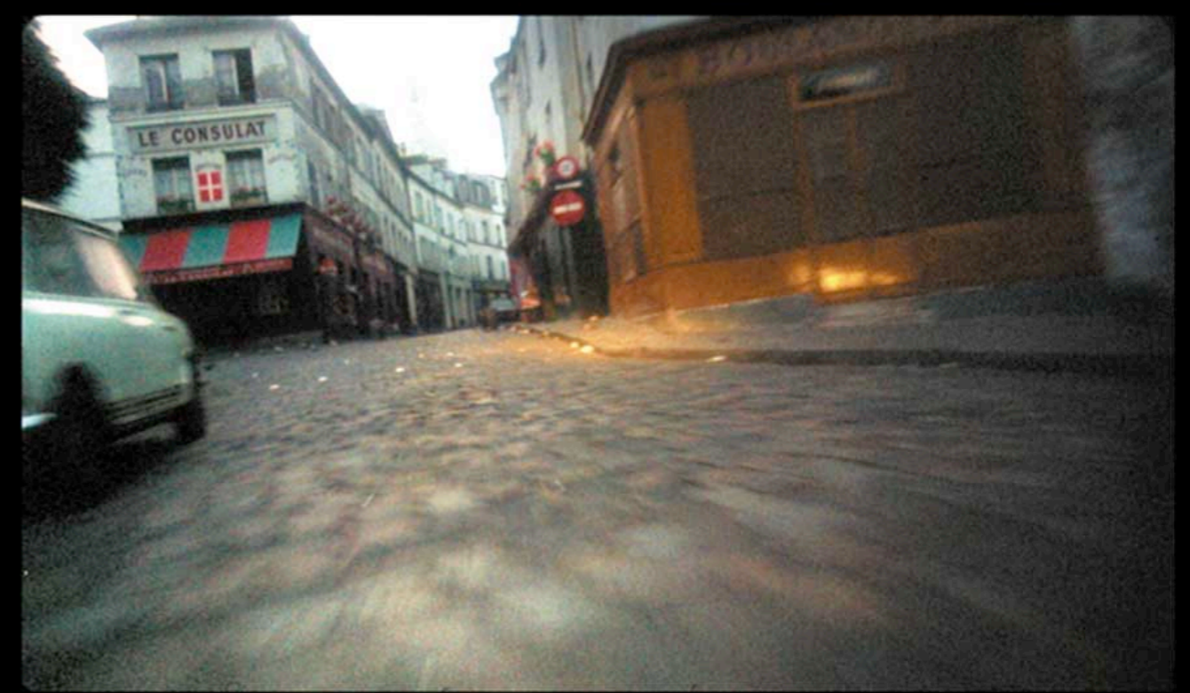
Claude Lelouch, C'était un Rendezvous http://fr-fr.facebook.com/video/video.php?v=2043762289244