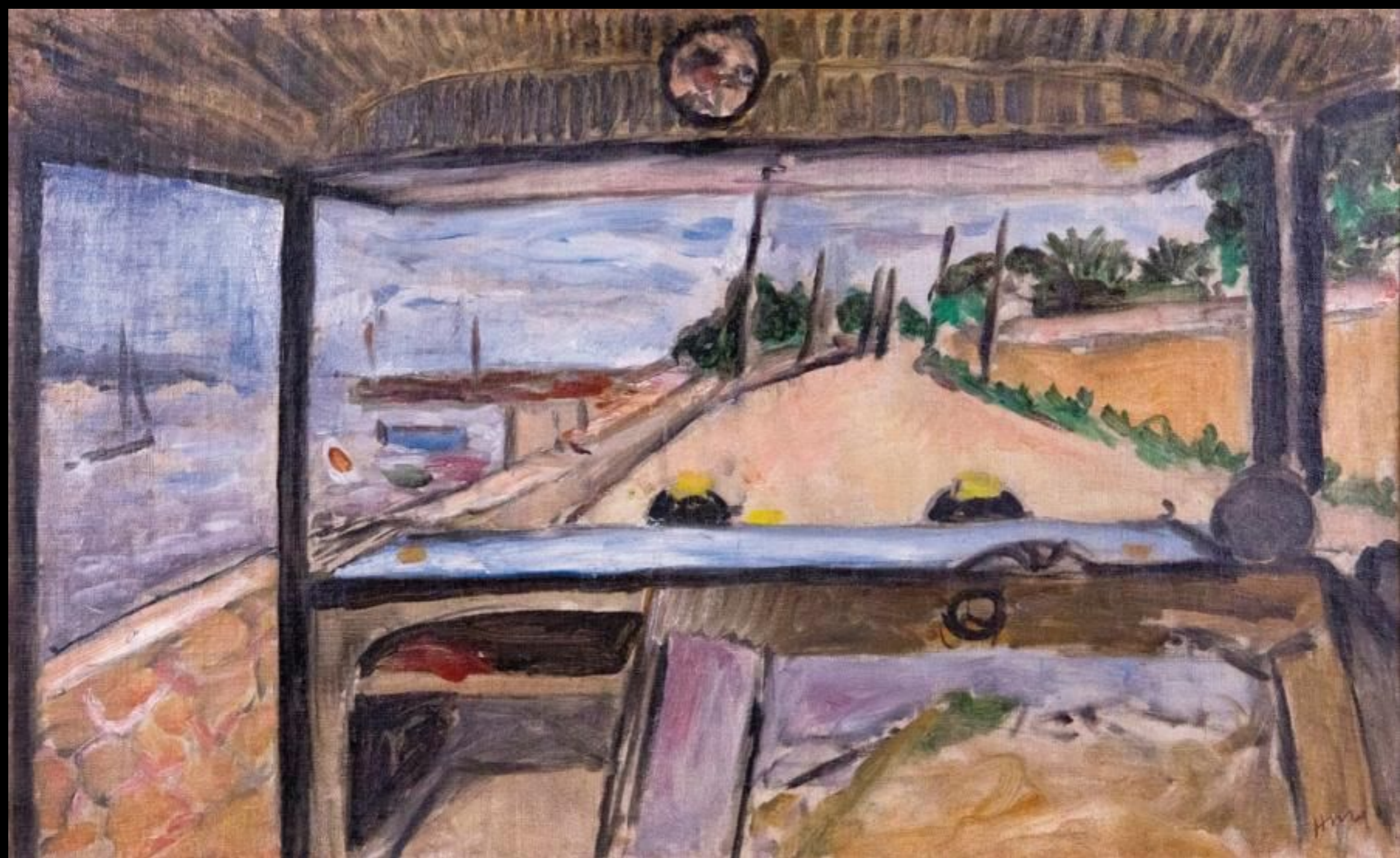
Matisse, Antibes, Paysage vu de l'intérieur d'une automobile , Antibes, 1925, 37x61cm