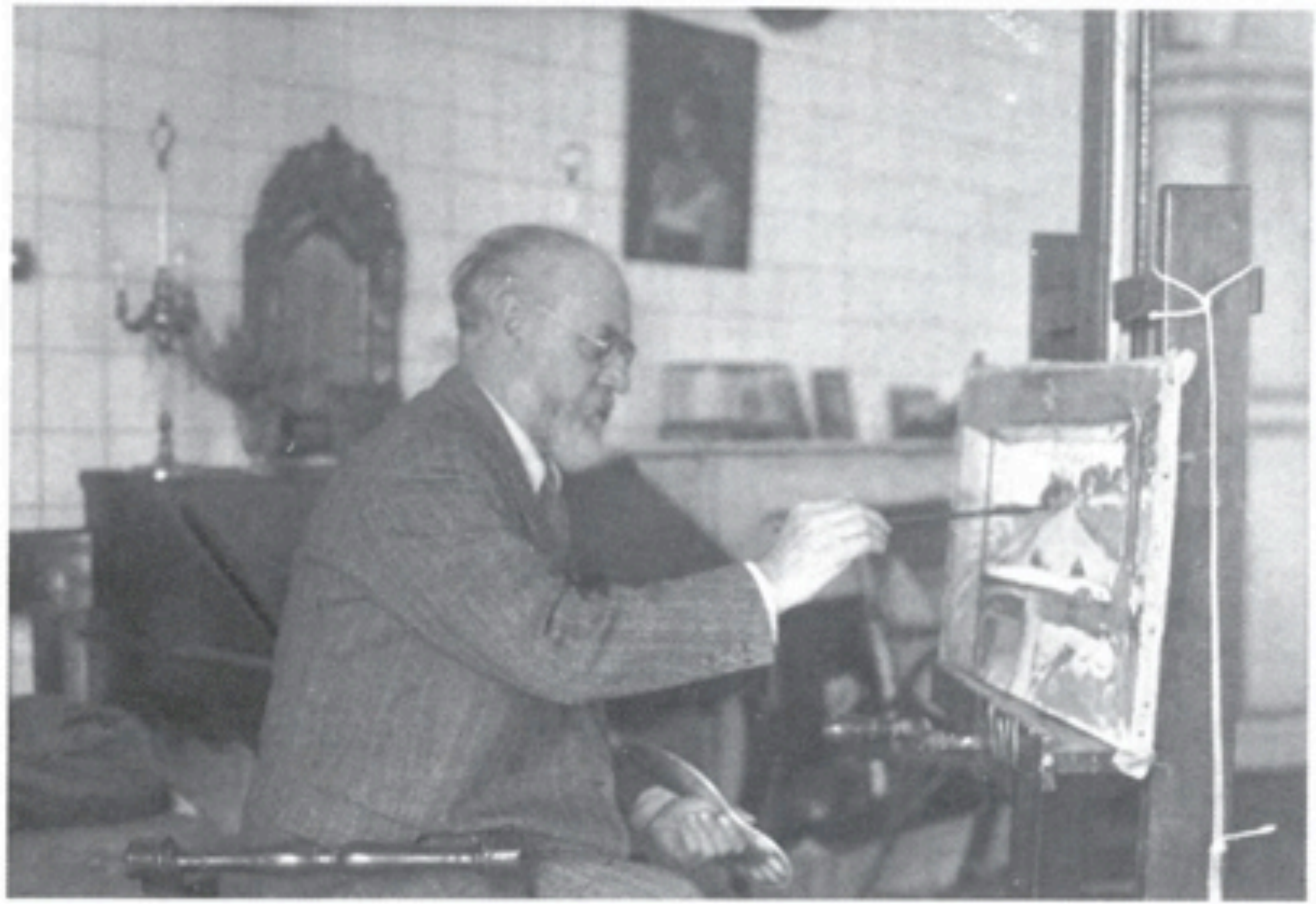
Matisse dans son atelier à Nice, années 1920