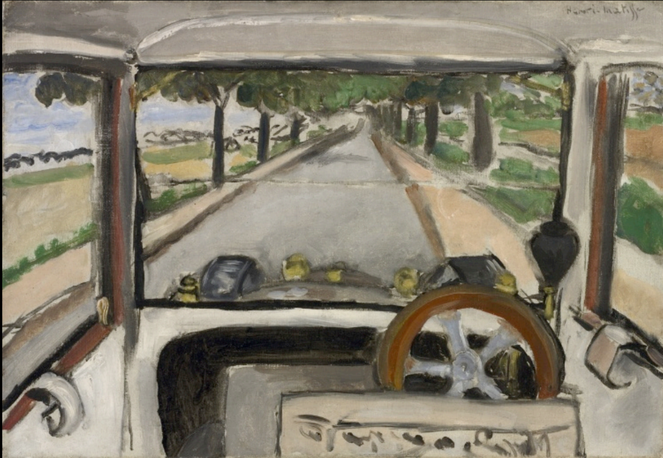
Matisse, Route de Villacoublay