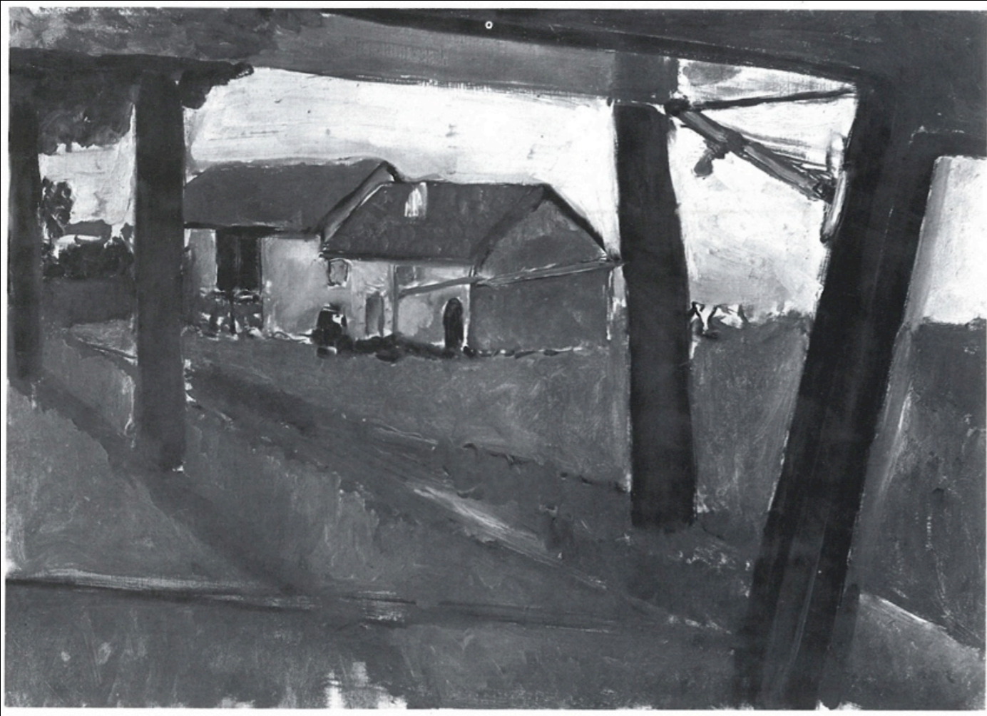
Matisse, Paysage à travers la glace , 1917