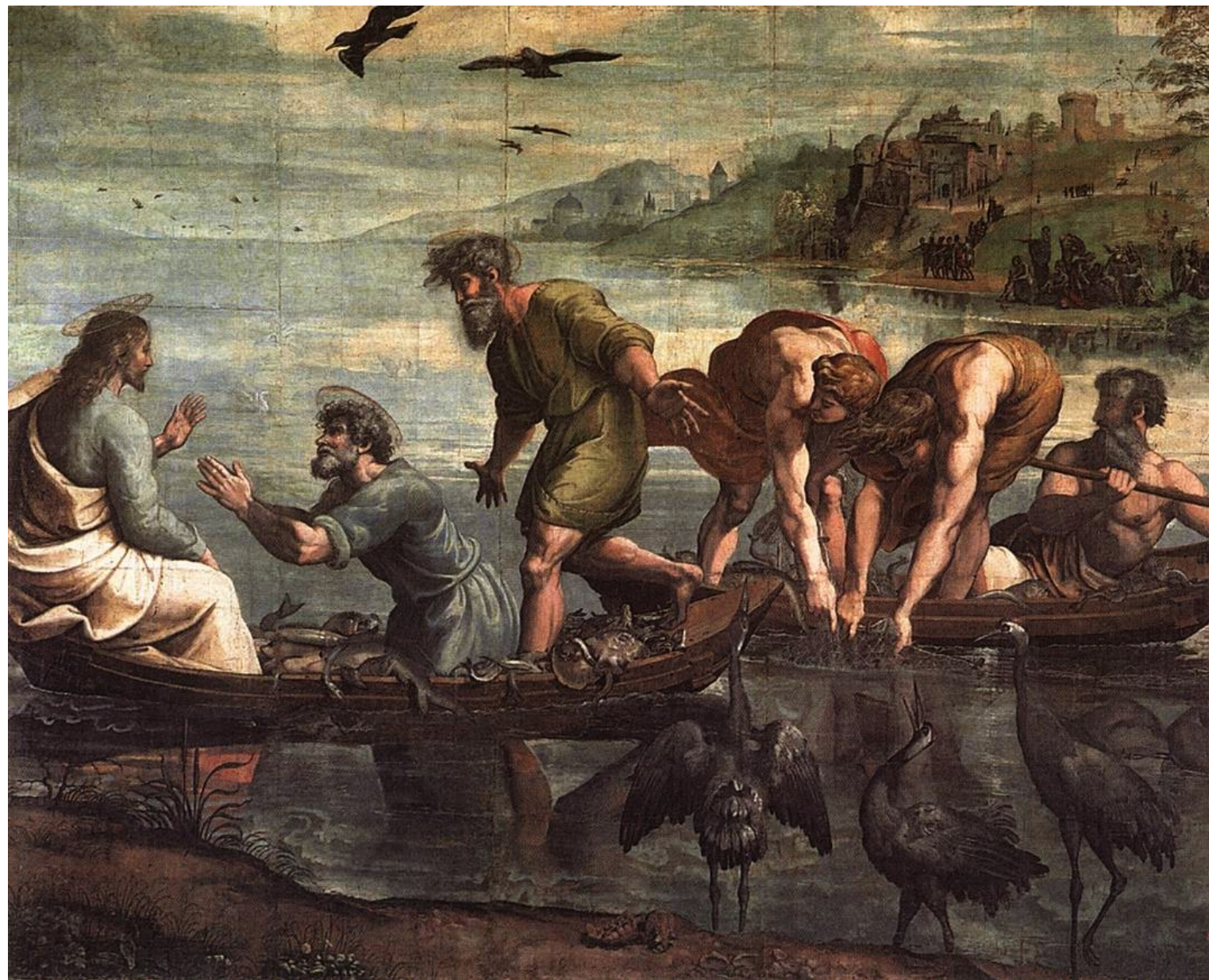
Raphaël et atelier, La Pêche miraculeuse, 1515 -1516, gouache et huile sur carton, Victoria and Albert Museum, Londres (Royaume -Uni)