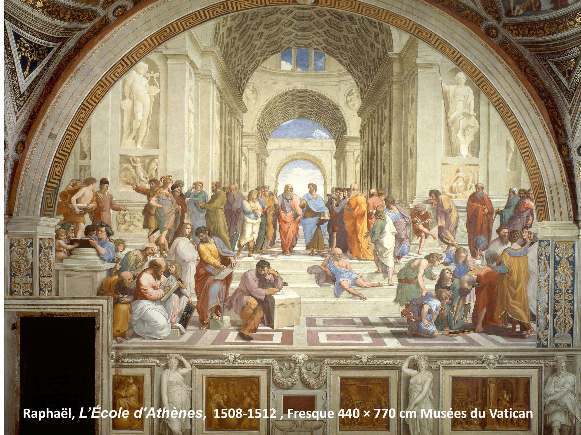
Raphaël, L'École d'Athènes , 1508-1512, Fresque 440 × 770 cm Musées du Vatican