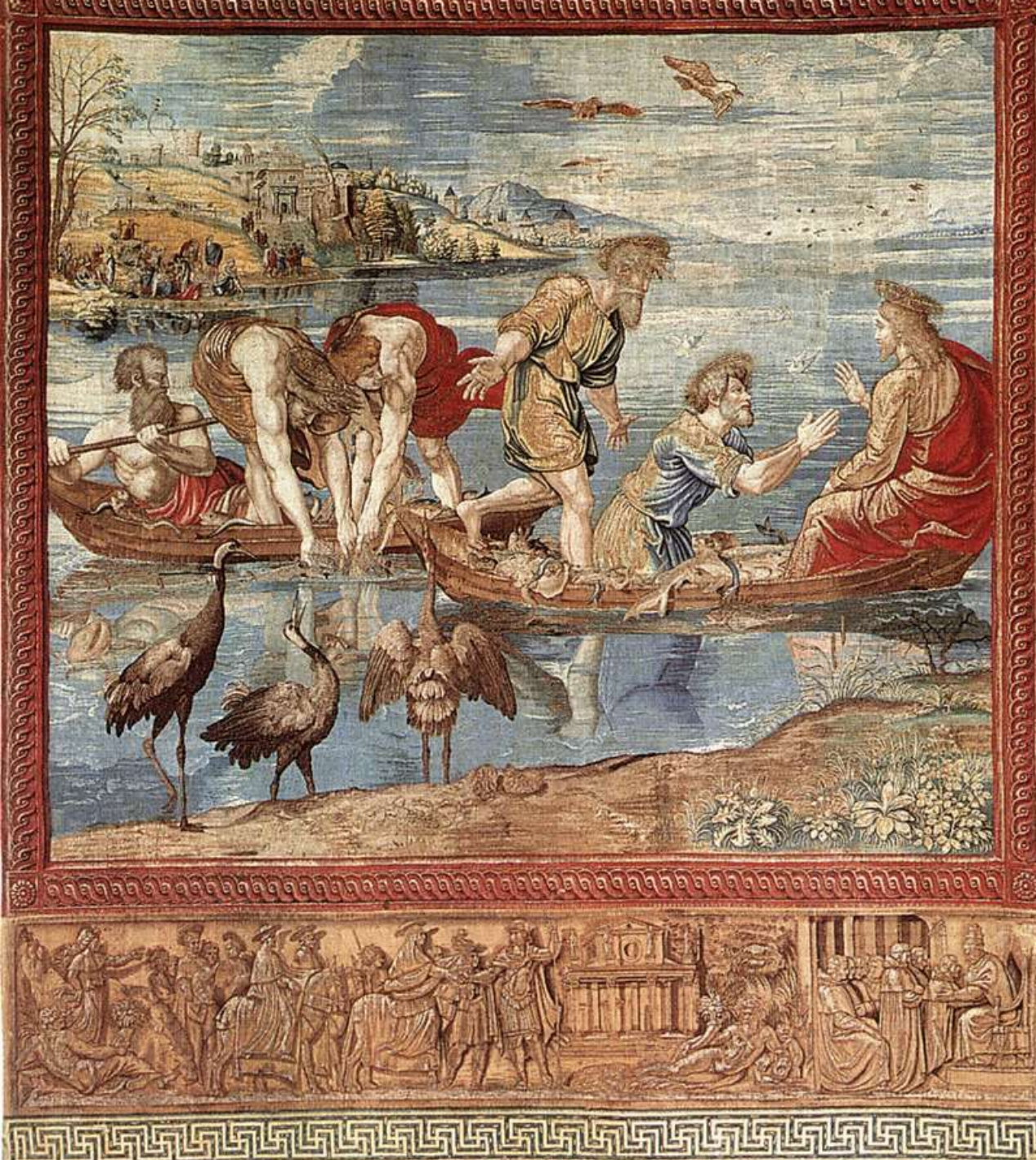
Pieter van Aelst et atelier La Pêche miraculeuse, 1519 Tapisserie Vatican

https://www.youtube.com/watch?v=jWxsu7qOjo8&ab_channel=VictoriaandAlbertMuseum