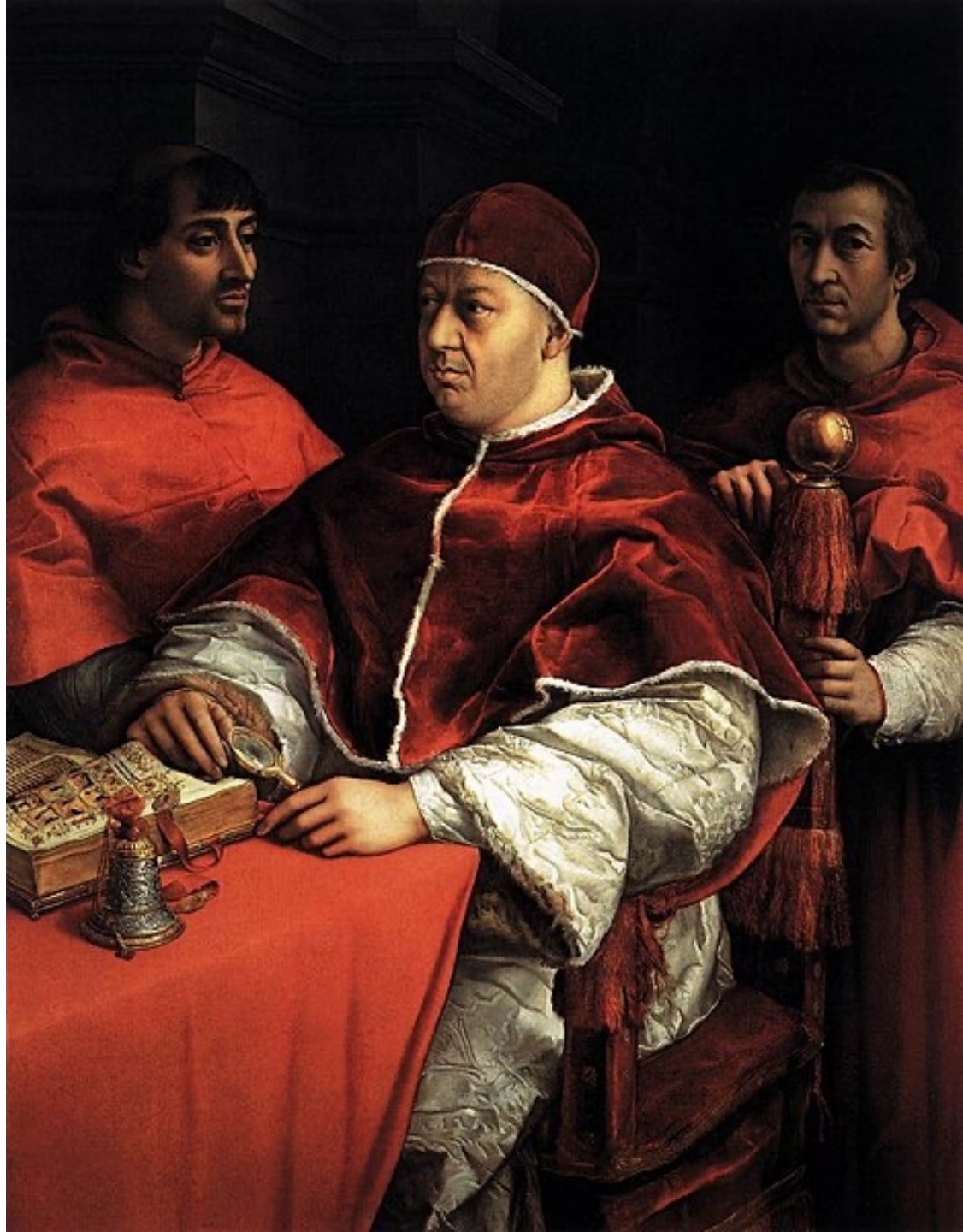
Raphaël Portrait du pape Léon X avec ses cousins, les cardinaux Giulio de' Medici et Luigi de' Rossi 1518-1519 Offices, Florence