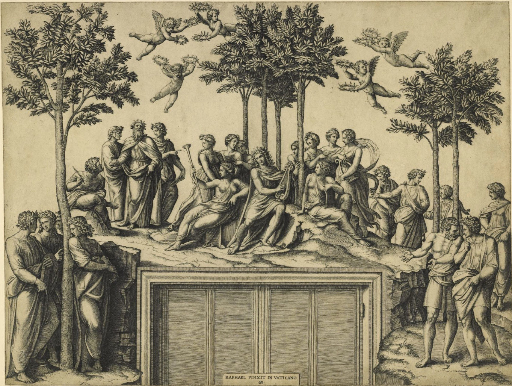
RAPHAEL PINXIT IN VATICANO M