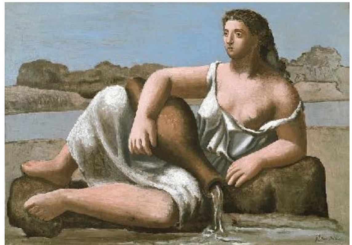
Pablo picasso - études de trois femmes à la fontaine