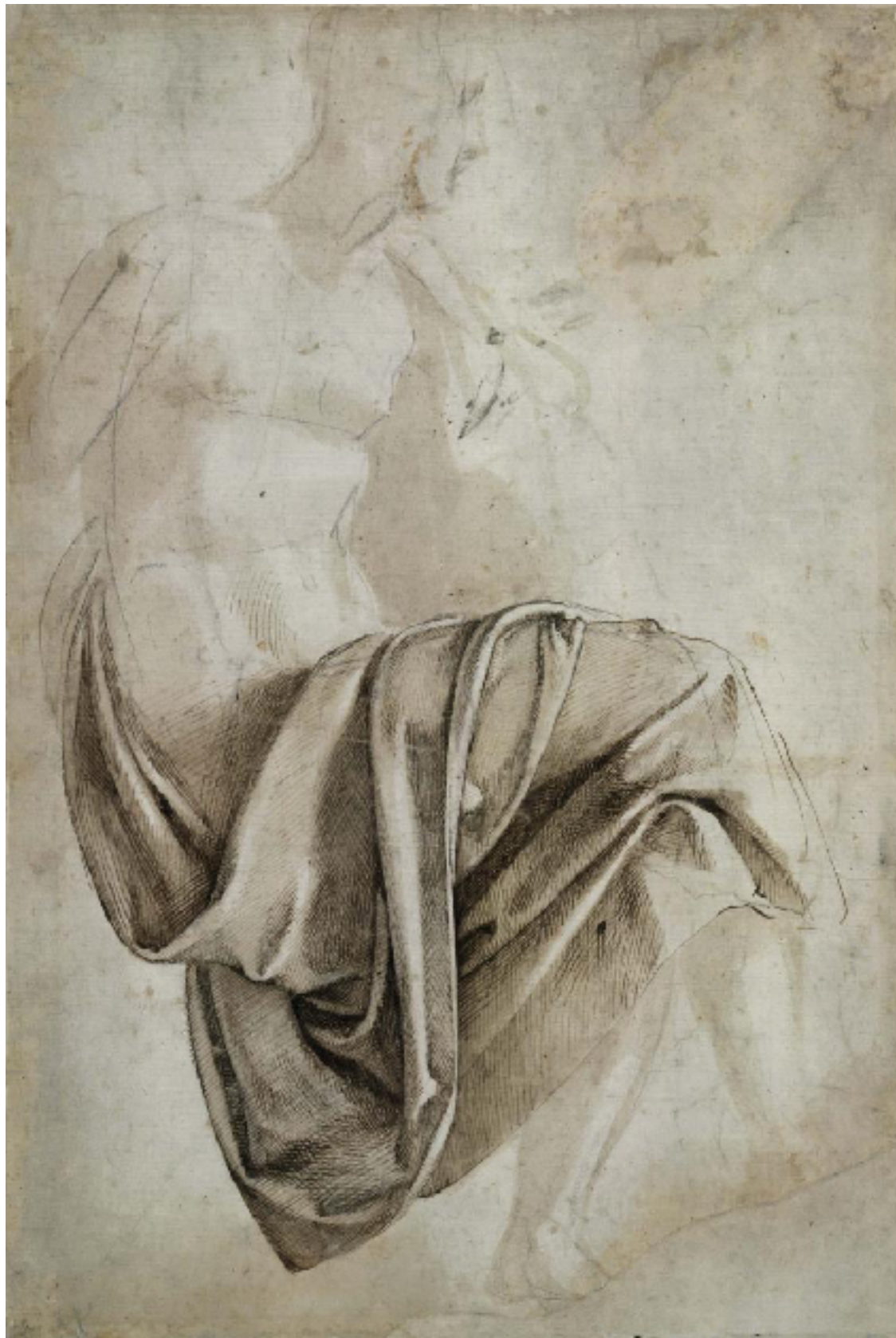
Michel ange, étude de drapé