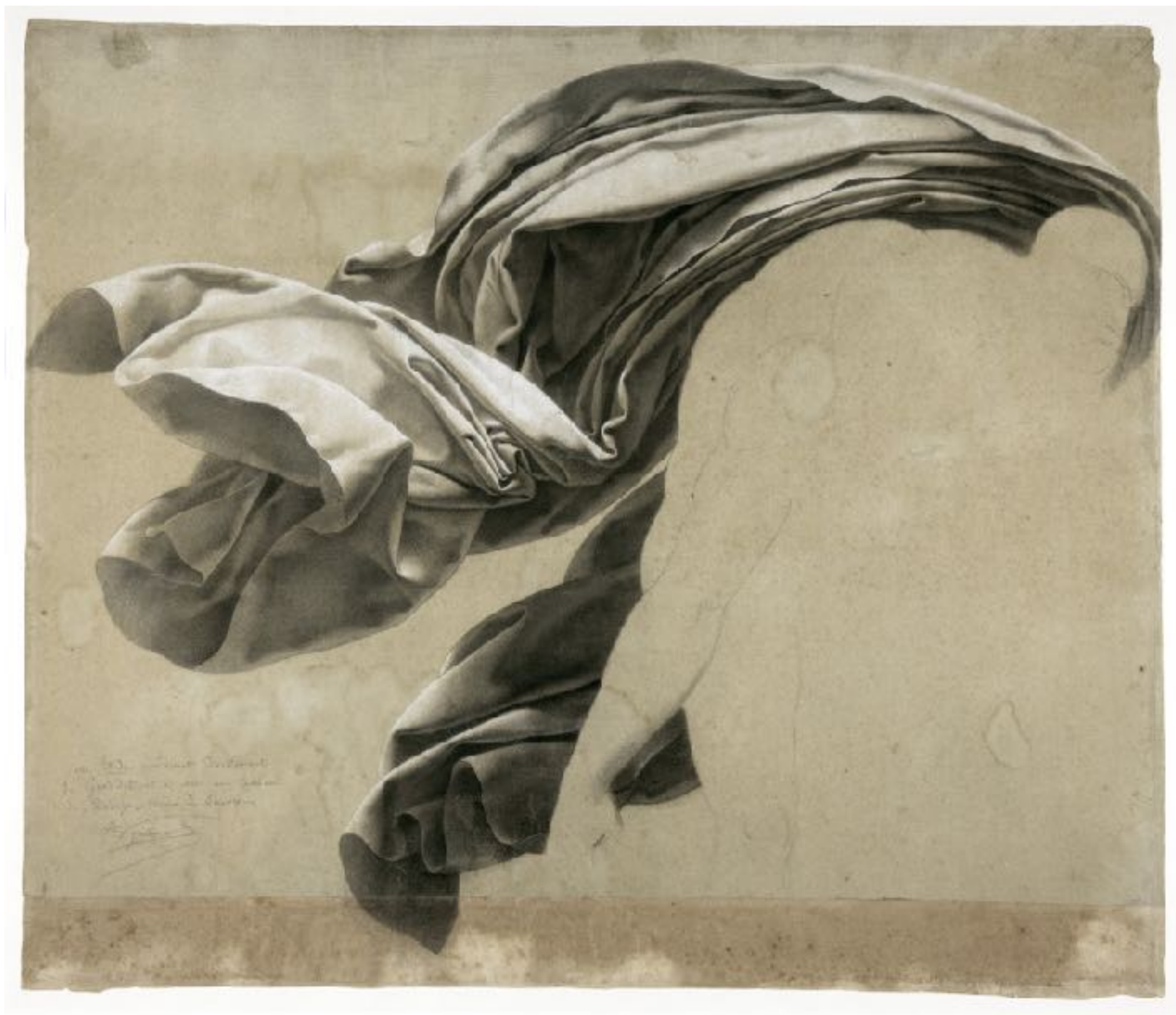
Anne-Louis Girodet de Roucy-Trioson – Étude de draperie pour scène de déluge , 1806. Mine de plomb et craie blanche sur papier beige