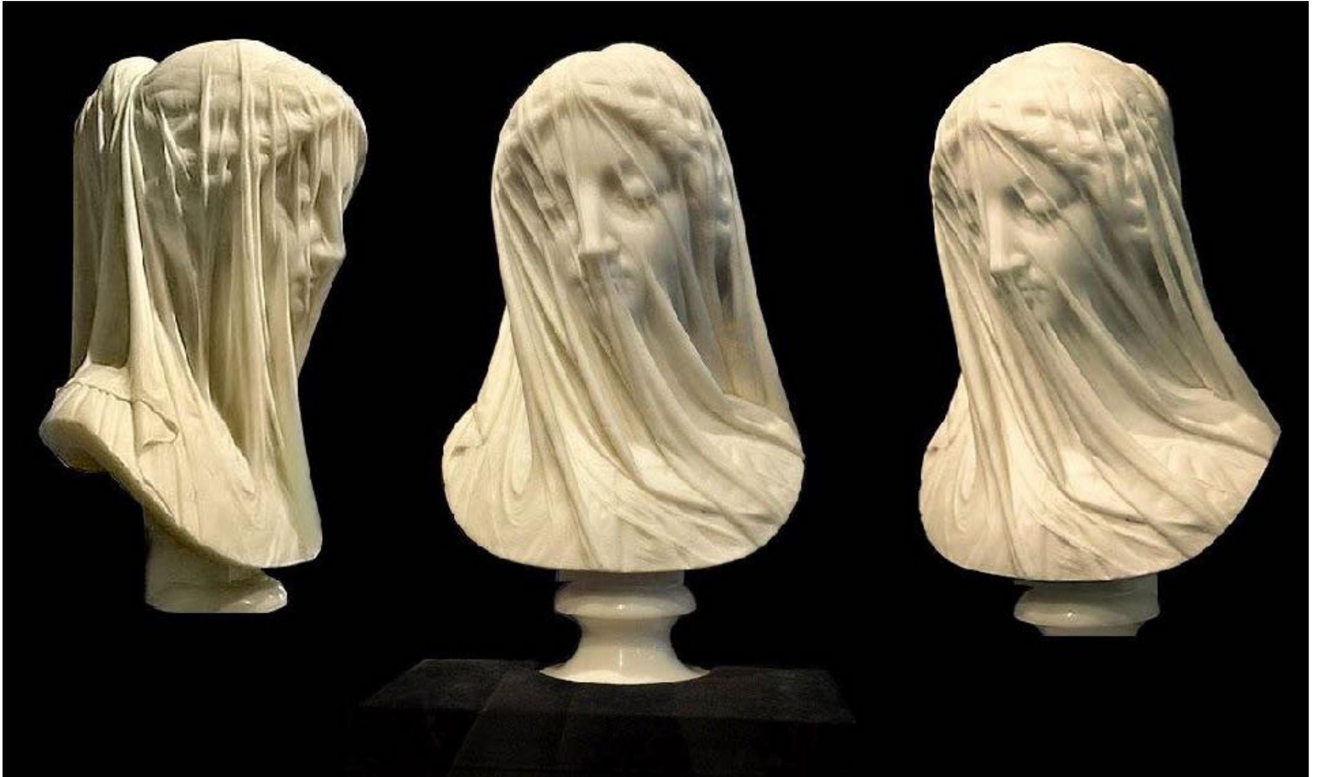
Giovanni Strazza, vierge voilée , 1860