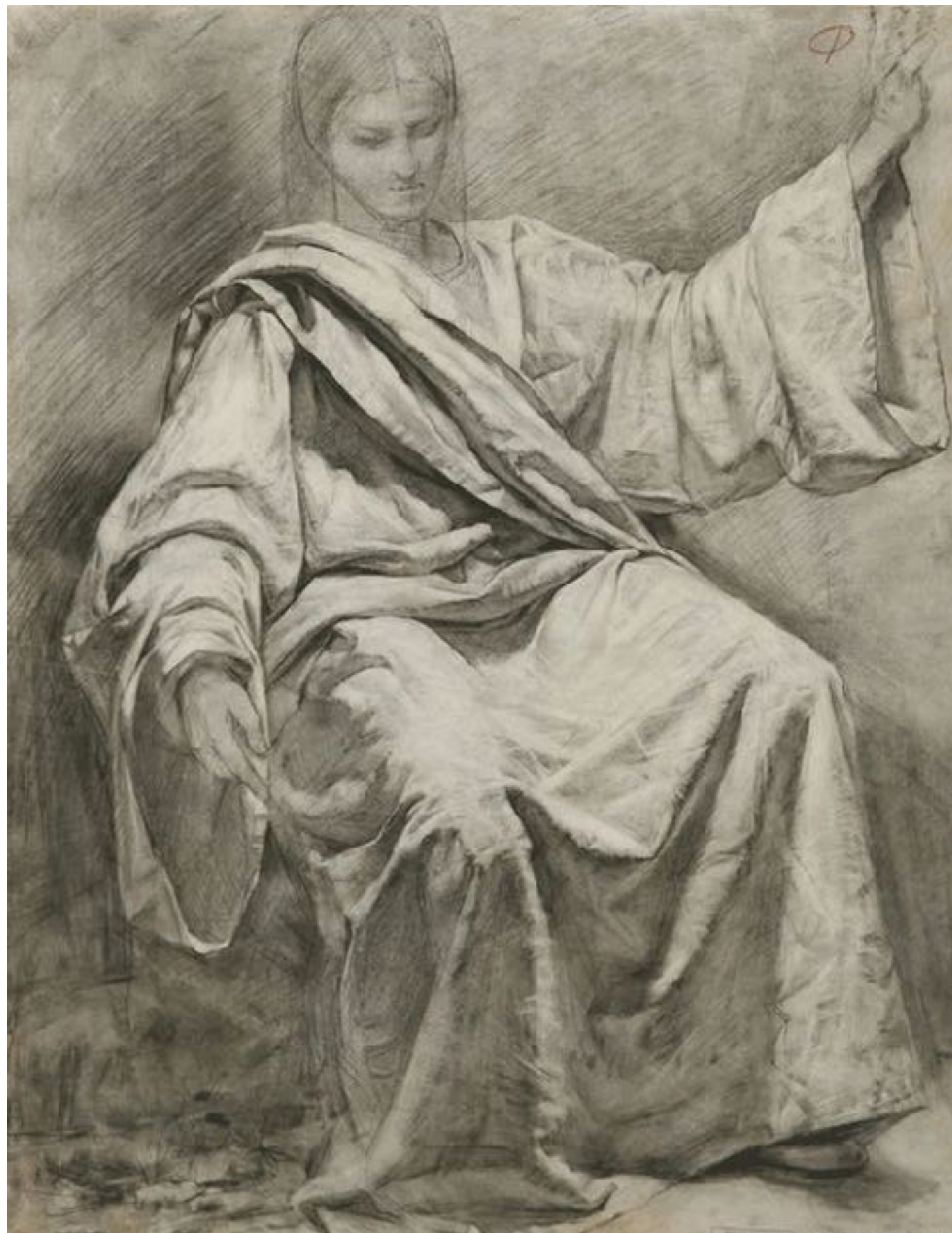
Gilberto Geraldo, étude de drapé ; 2005. Charcoal on colored paper. 70 x 55 cms