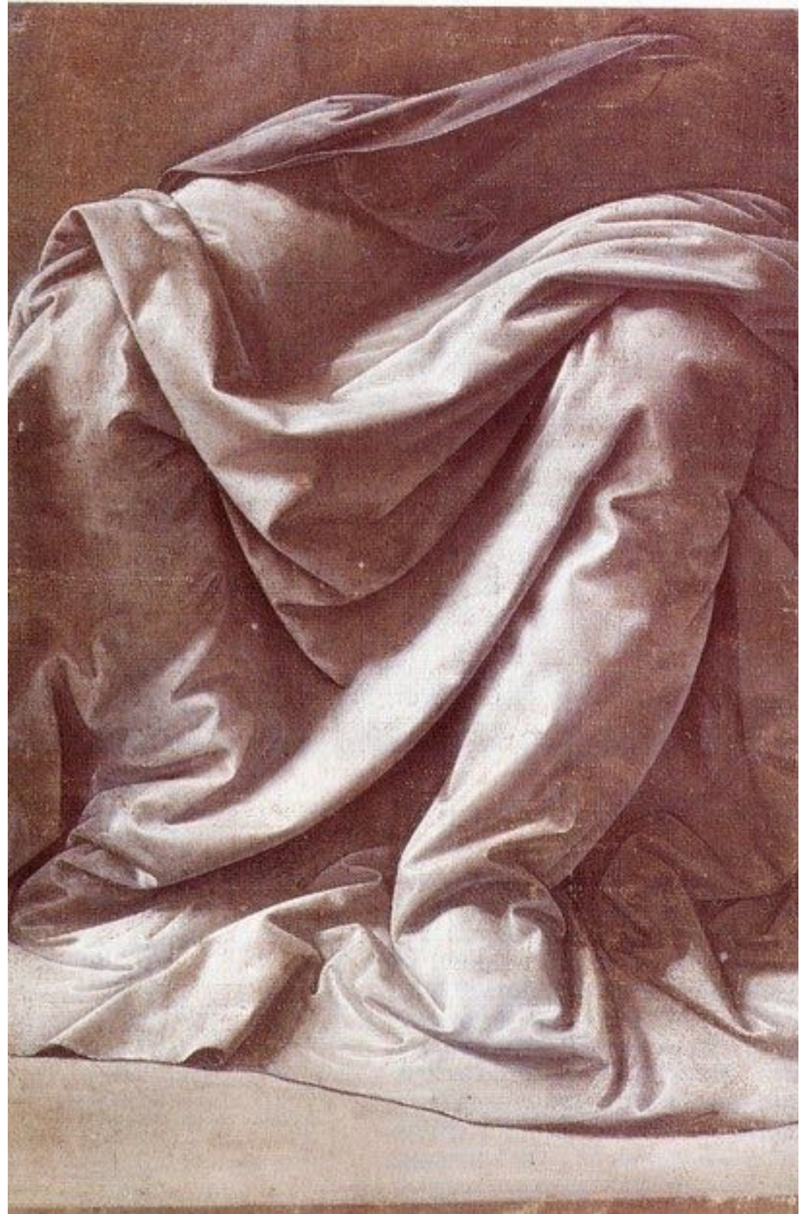
Léonard de vinci, études de drapés