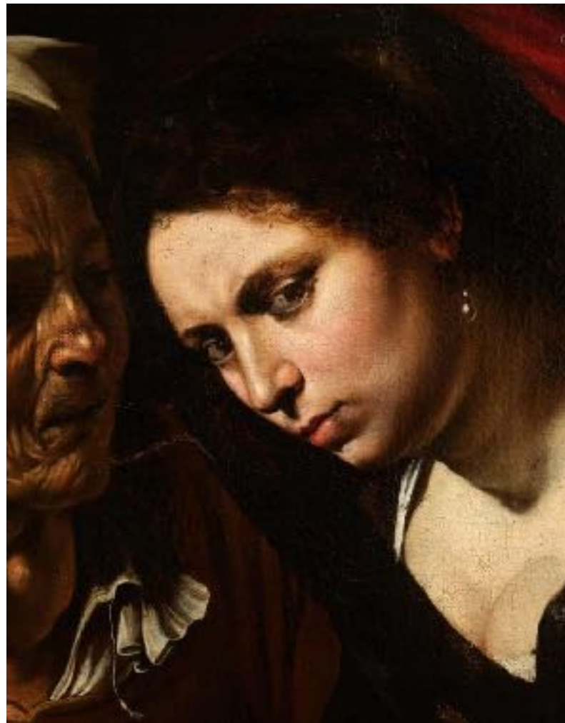
Caravage, « Judith et Holoferne », détail (vers 1598).