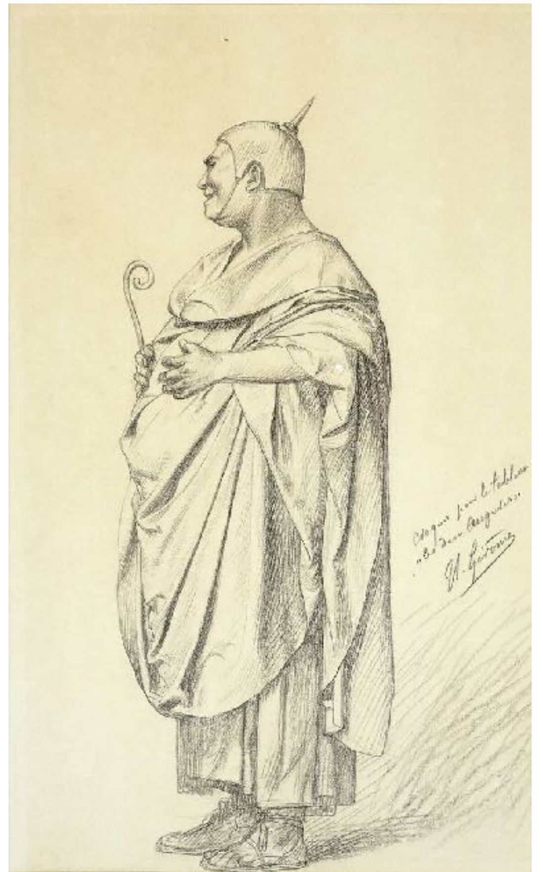
Edouard Manet / Jean-Louis Gérôme Études préparatoires