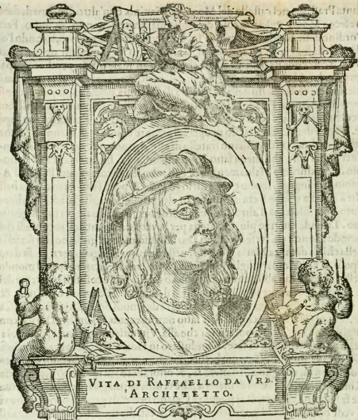
Vita di Raffaello da Urbino Pittore, & Arch.

“Ala Excellentia vostra la quale per hora non sarà advisata d'altra cosa che de la morte di Raphaello d'Urbino, quale morite la notte passata, che fu quella del venerdì santo, lasciando questa corte in grandissima et universal mestitia per la perdita de la speranza di grandissime cose che si expettavano da Lui”.