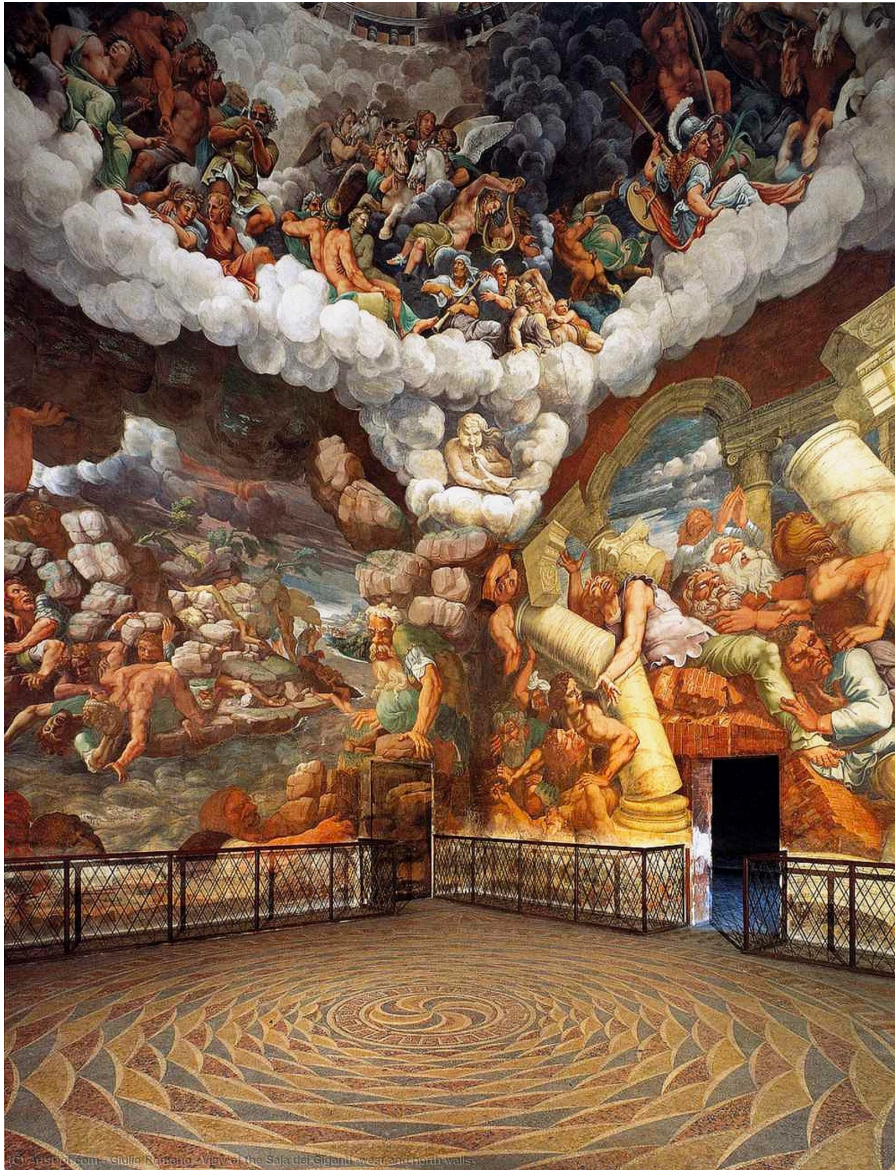
Jules Romain (1499–1546) Giulio Romano Titre VSala dei Giganti (north wall) 1532 et 1534 Fresque Mantoue Palazzo Te