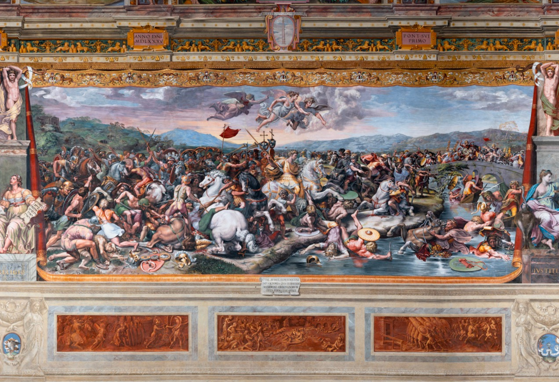
Giulio Romano et Raphaël, La Bataille du pont de Milvius, 1517-1524, Vatican, Salle de Constantin