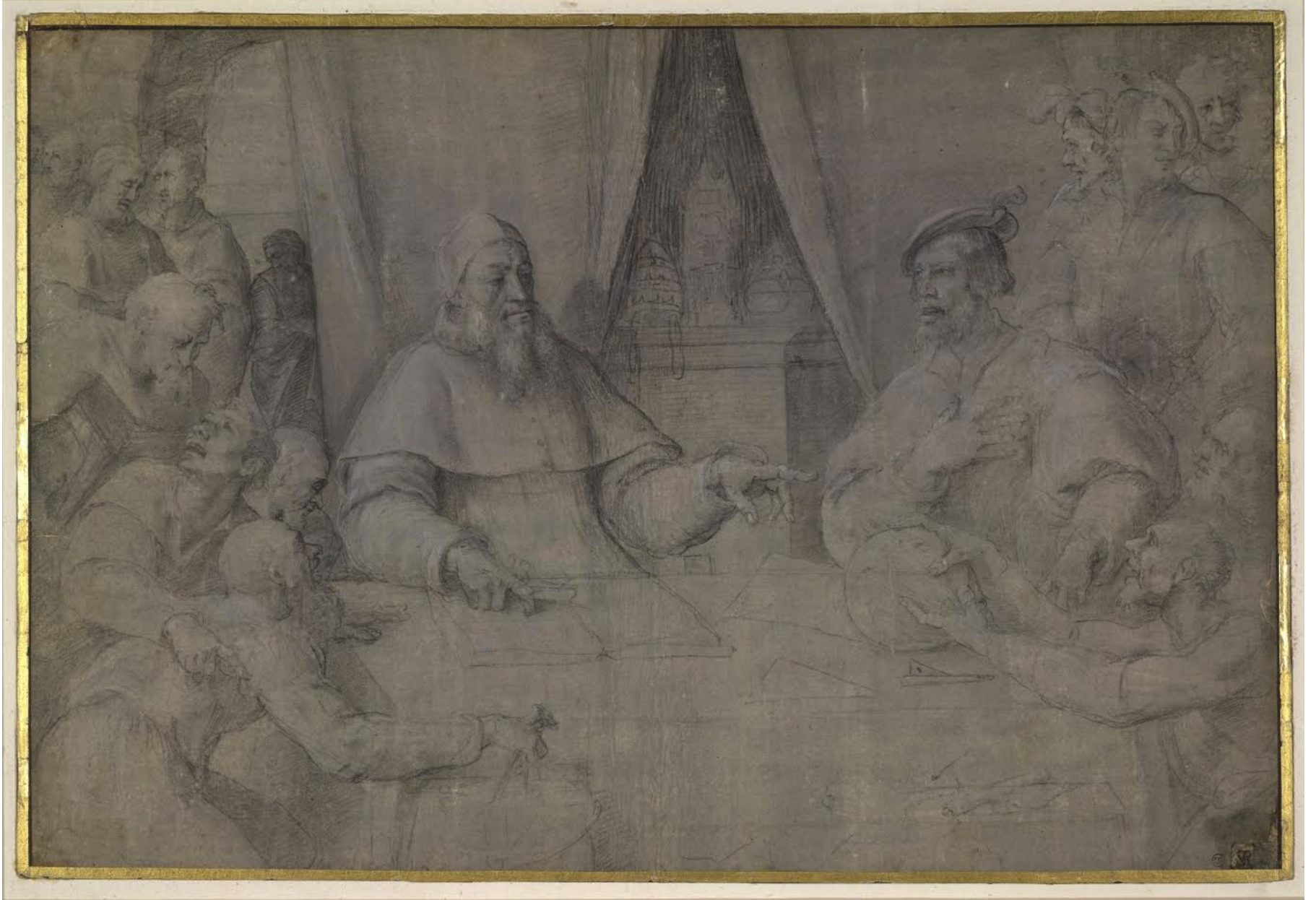
Sebastiano del Piombo, Rencontre entre l'Empereur Charles V et Clément VII à Bologne, 1530-1534, dessin, Londres, British Museum