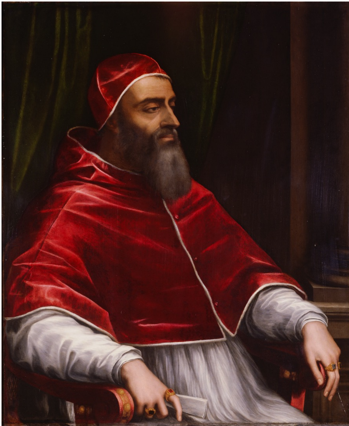
•Sebastiano del Piombo, Portrait de Clément VII, vers 1531, huile sur pierre, Los Angeles, Getty Museum