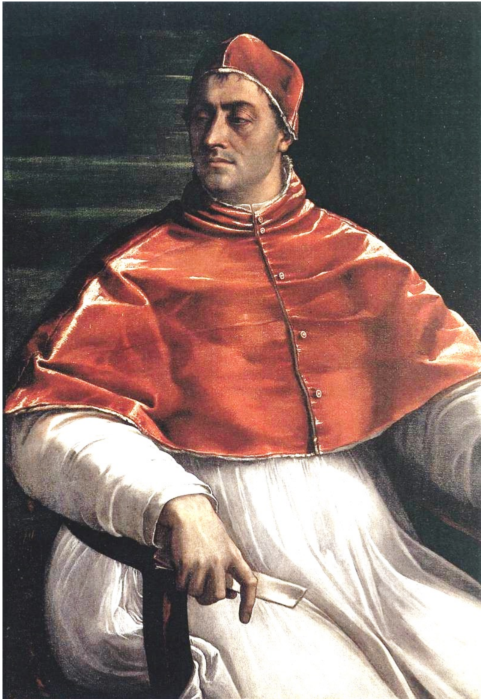
Sebastiano del Piombp Clement VII 1526 Huile sur toile Naples Capodimonte