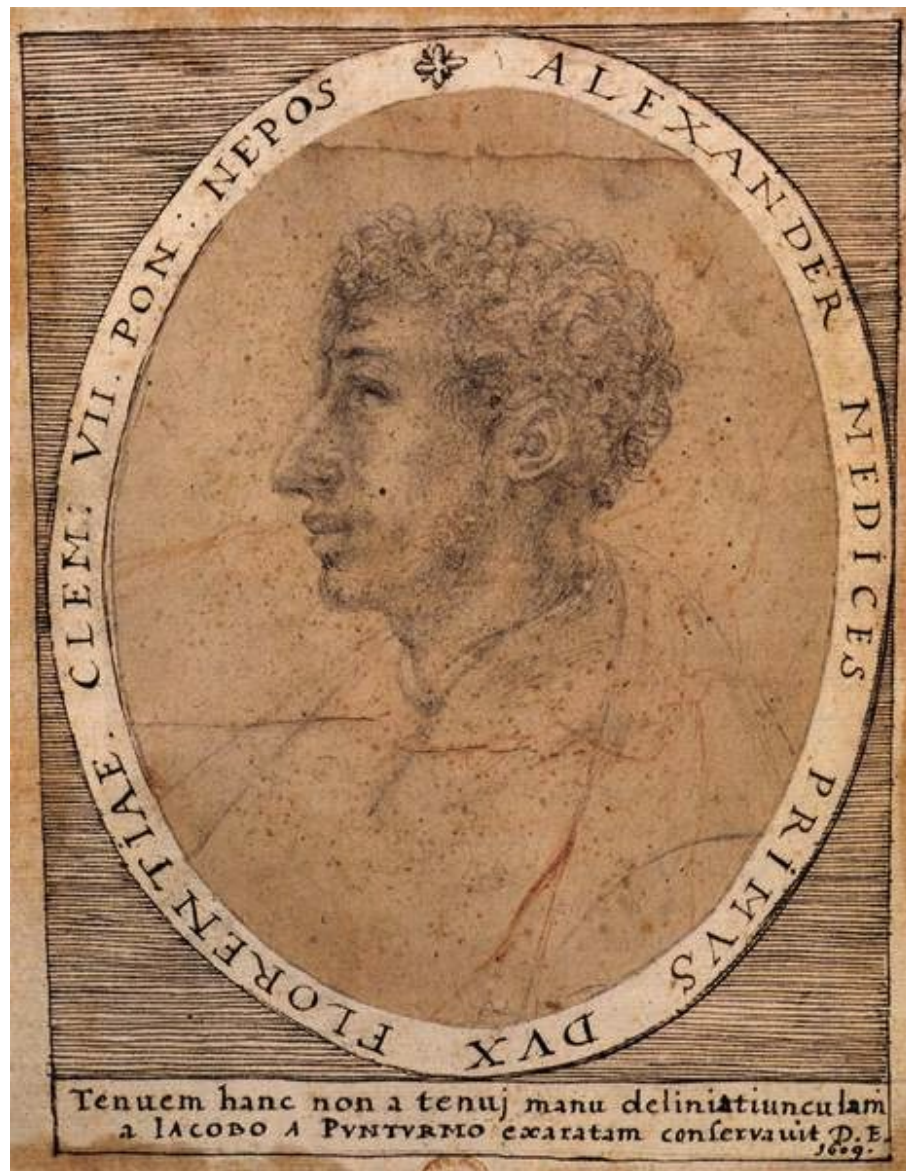
Jacopo Pontormo, Alessandro de Medici, dessin, 1534 circa, Florence, Biblioteca Marucelliana