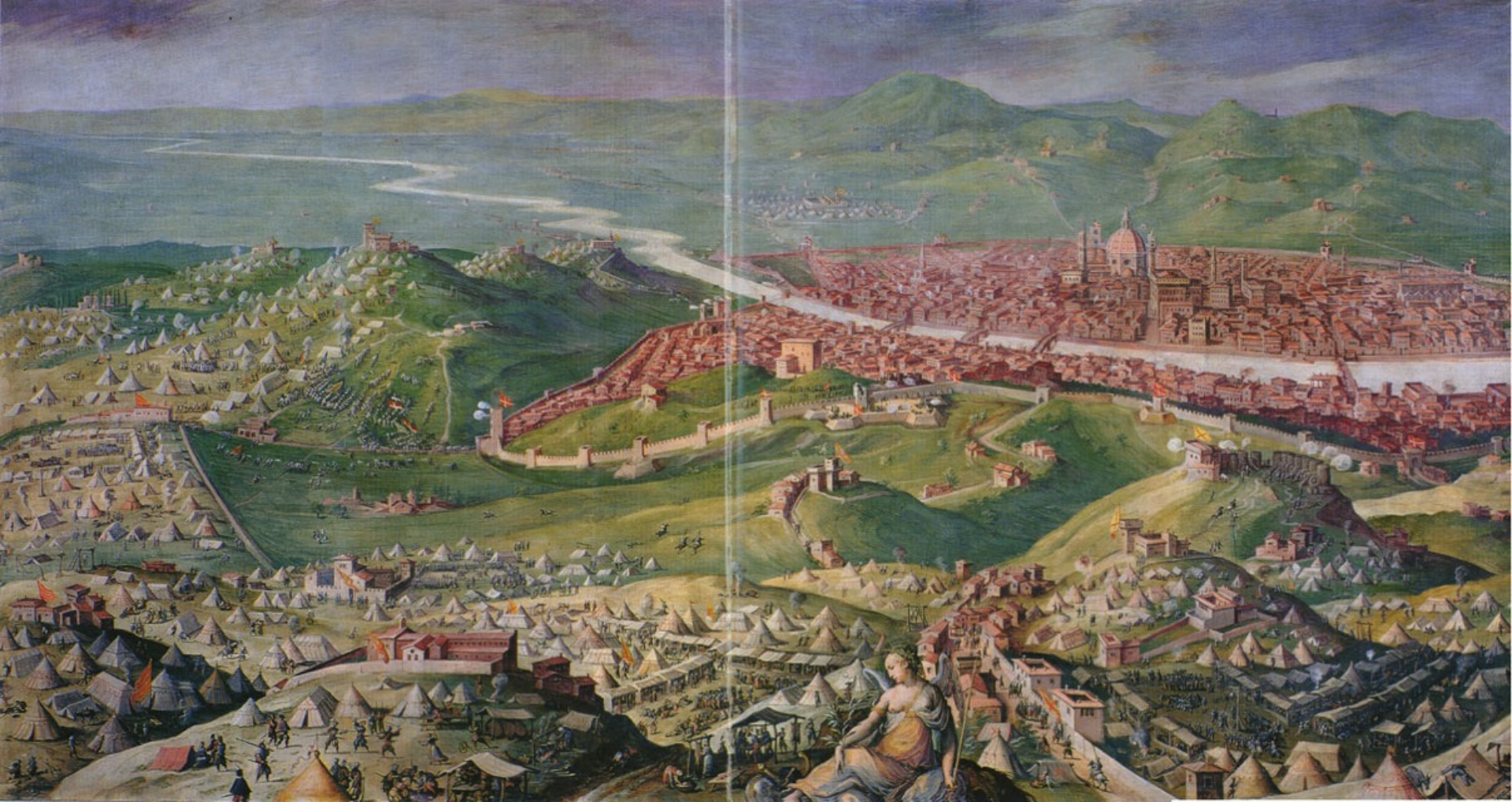
Siège de Florence ca 1560 - ca 1562 Giorgio Vasari Fresque Palazzo Vecchio, Florence