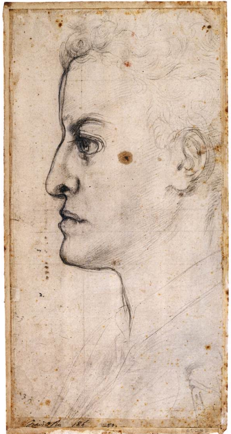
Jacopo Pontormo Portrait de Cosme Ier de Médicis de profil 1537 fusain sur papier Florence Musée des Offices