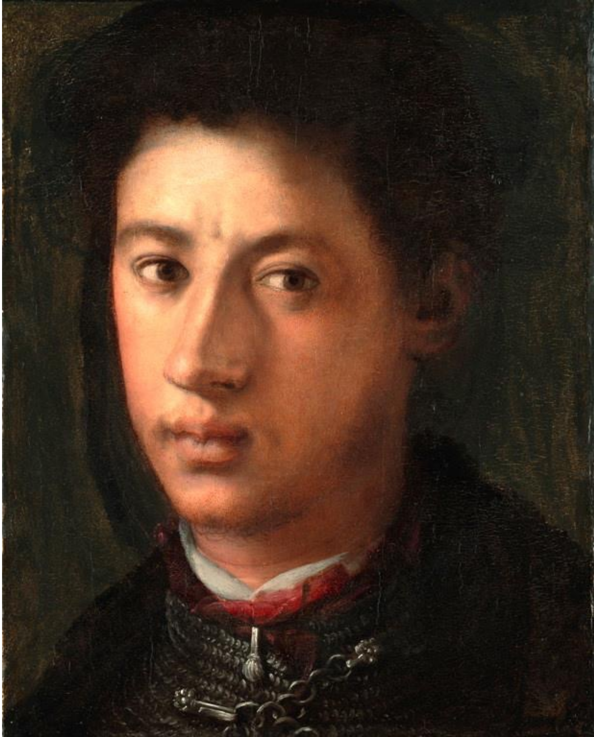
Jacopo Pontormo, Alessandro de' Medici 1534-1535 huile sur bois Art Institute of Chicago