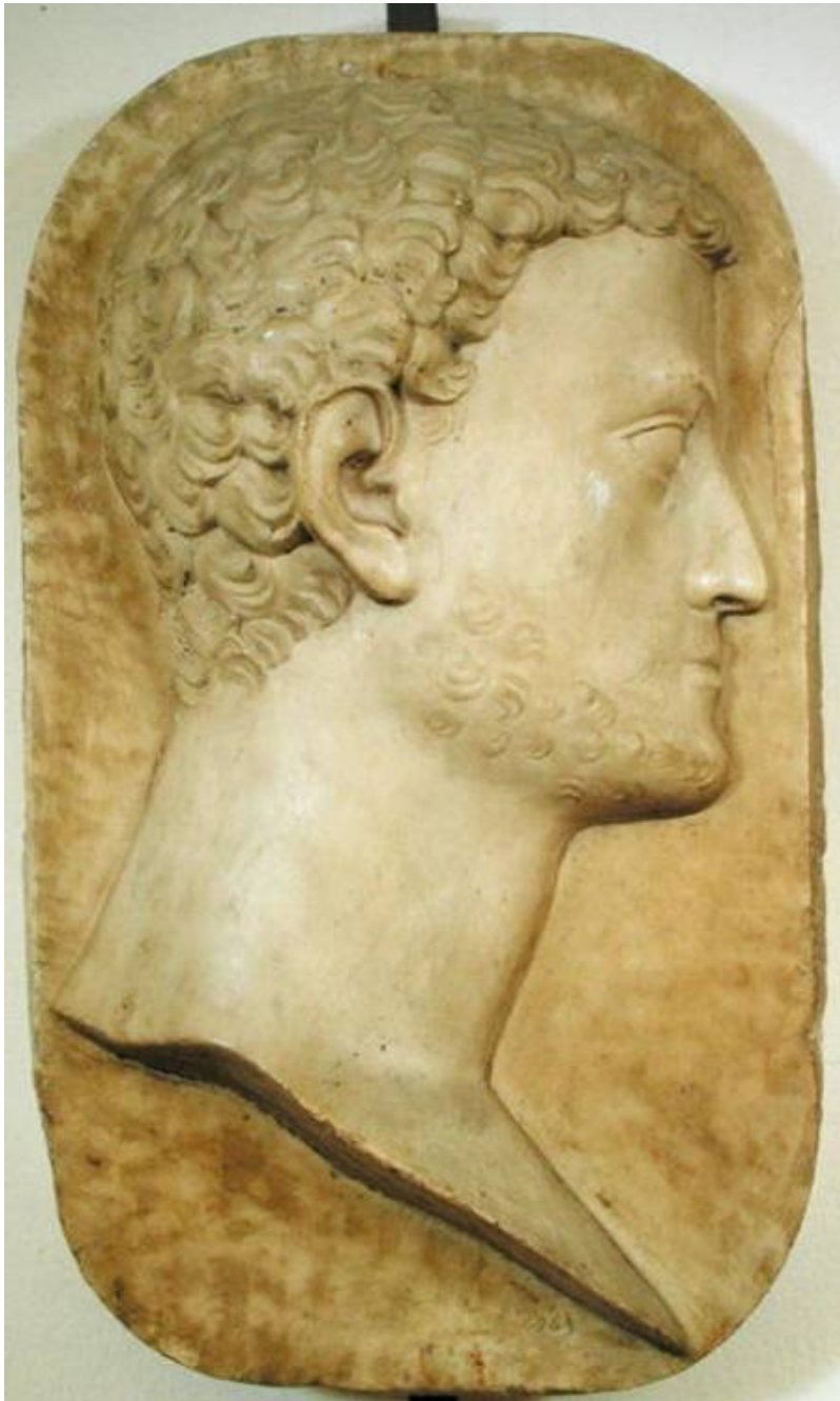
Baccio Bandinelli Portrait de Cosme Ier de Médicis de profil 1540 circa Marbre Florence Musée du Bargello