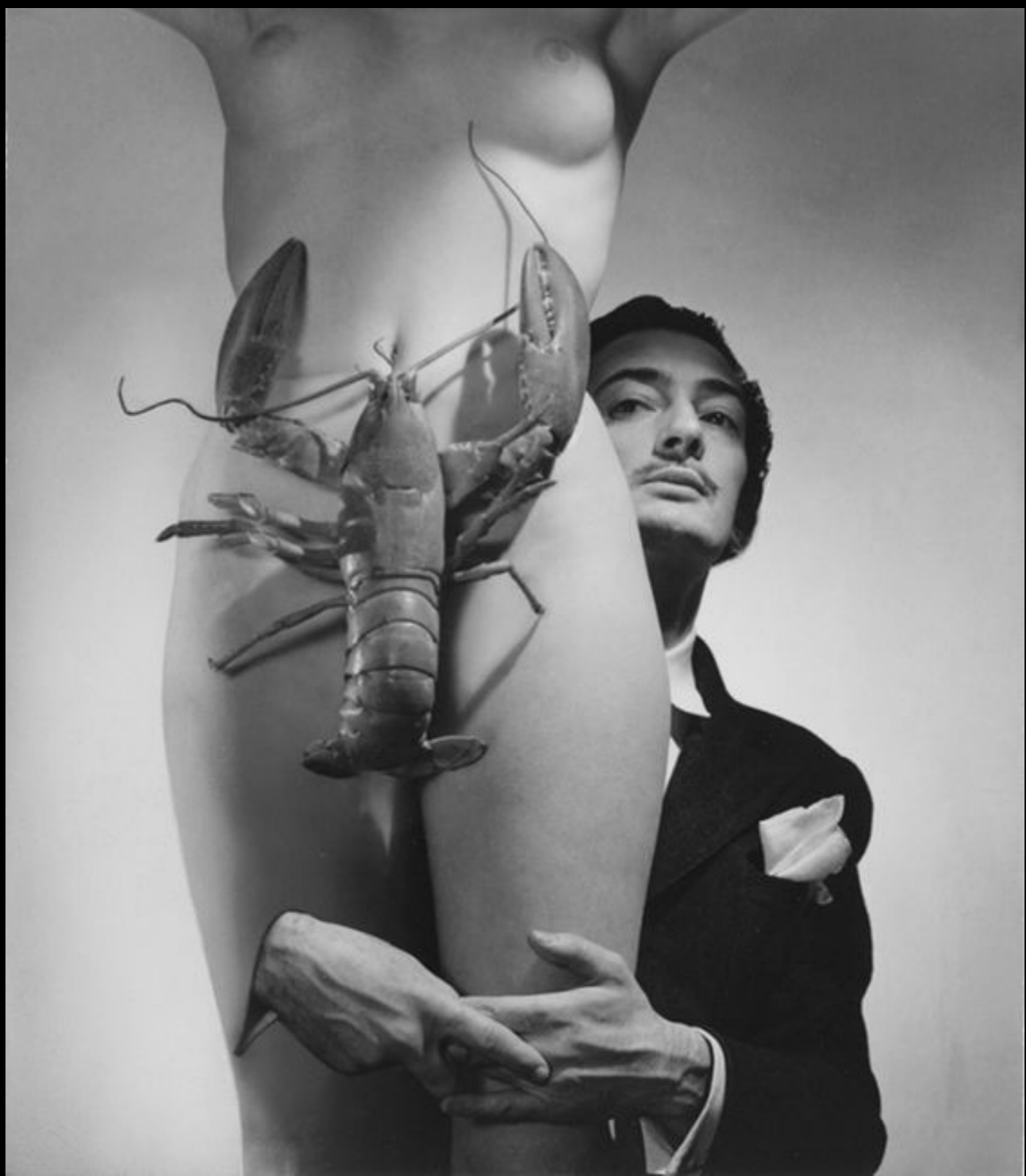
George Platt Lynes