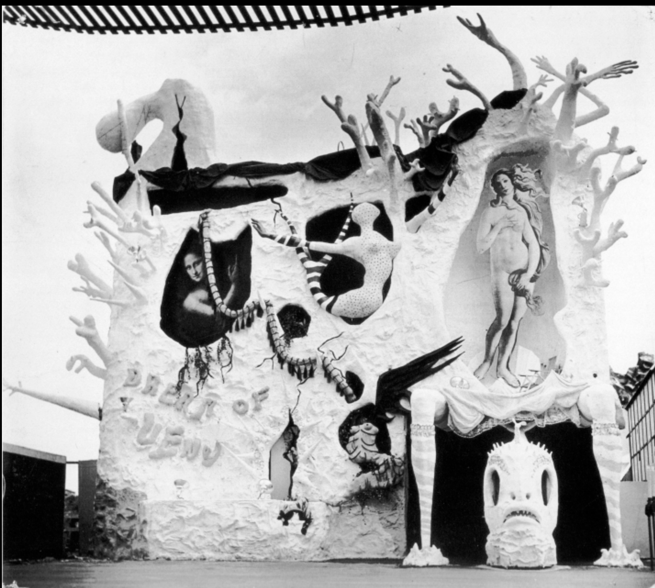
Salvador Dalí, Dream of Venus , 1939, New York World Fair