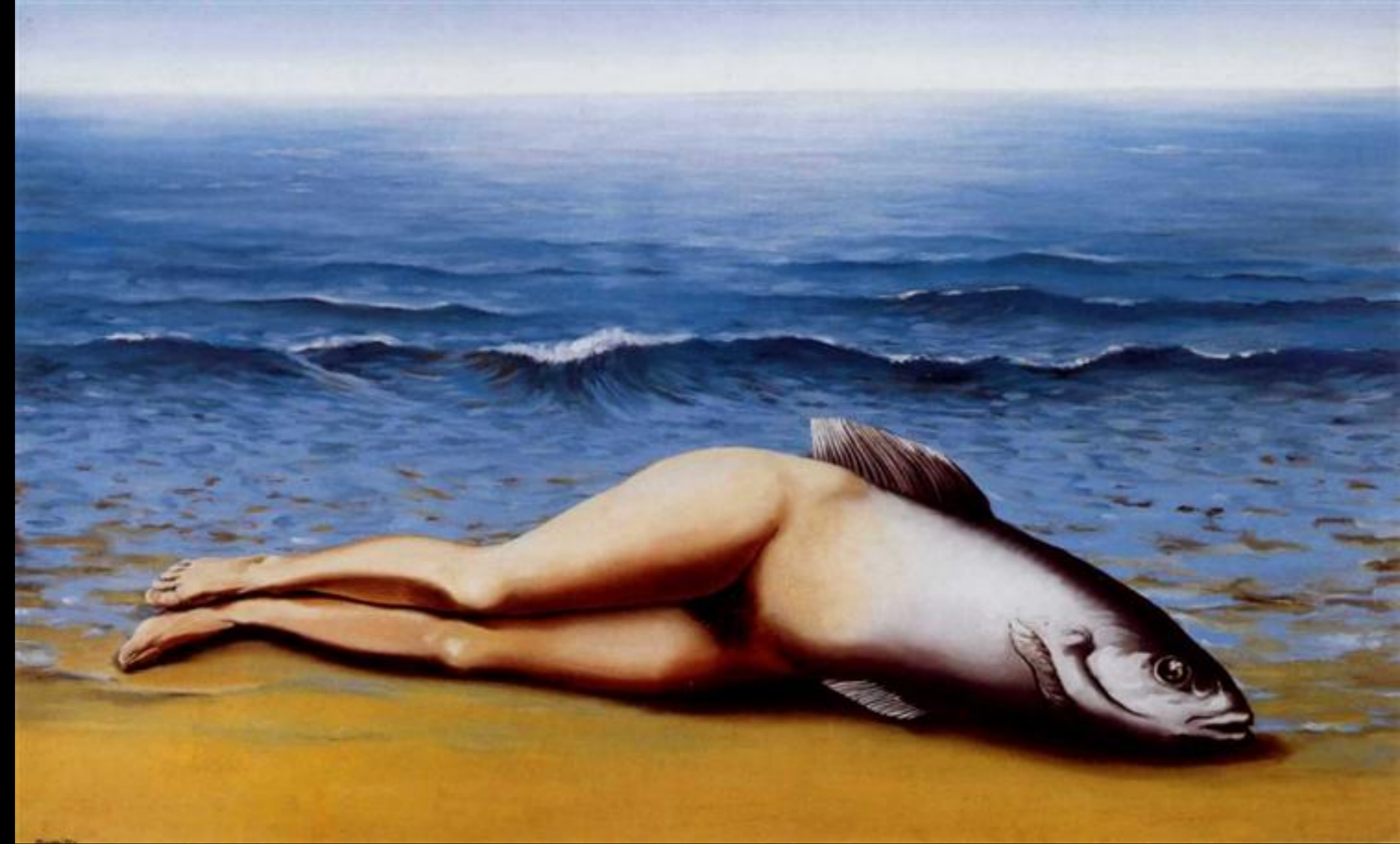
René Magritte, L'invention collective , 1934, huile sur toile, 73x116 cm