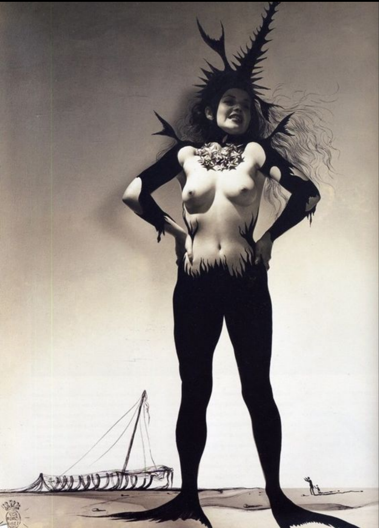
3.17 Dream of Venus invitation card, 1939.