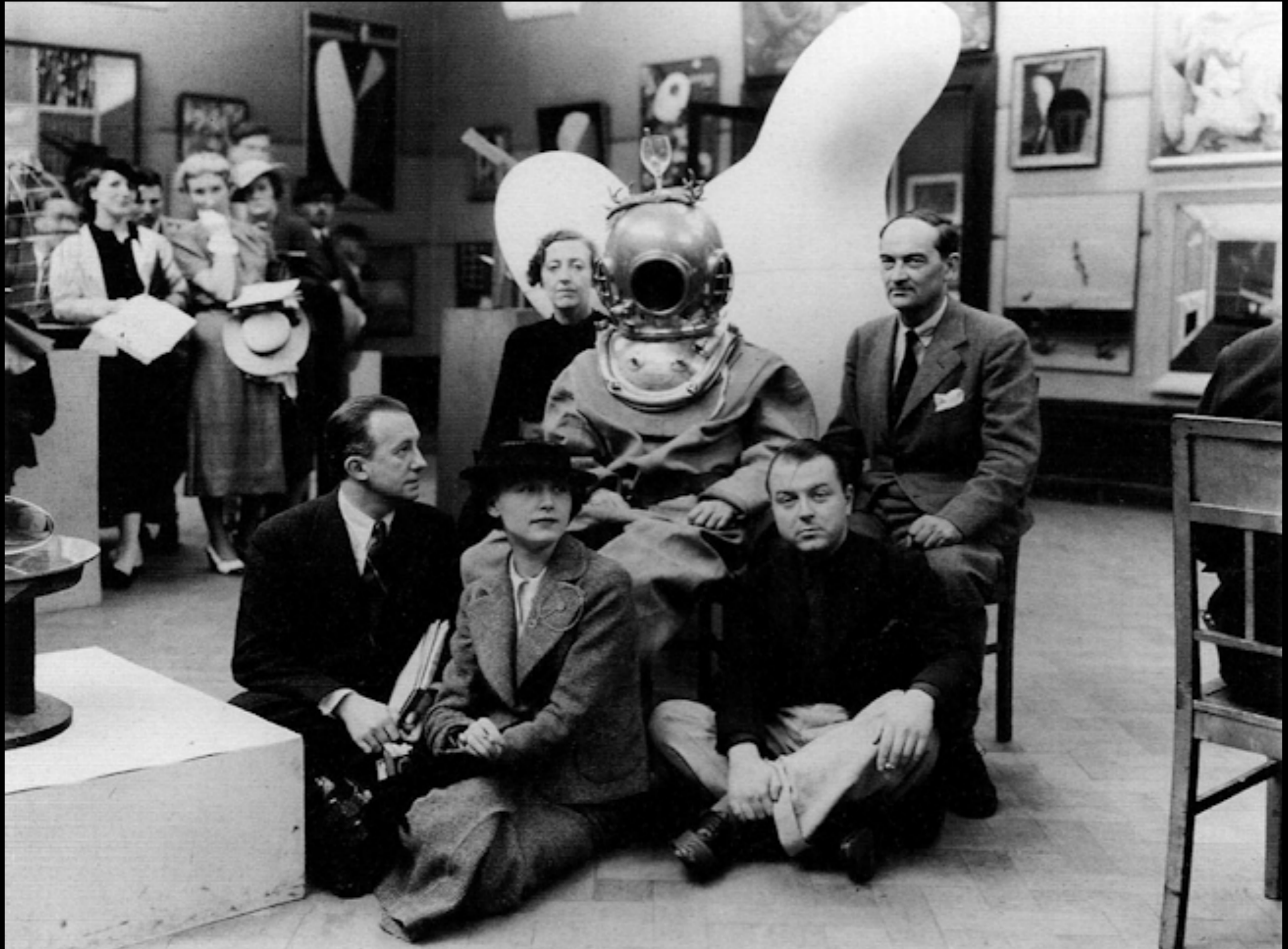
International Surrealist Exhibition in London (July 1st, 1936), at the New Burlington Galleries