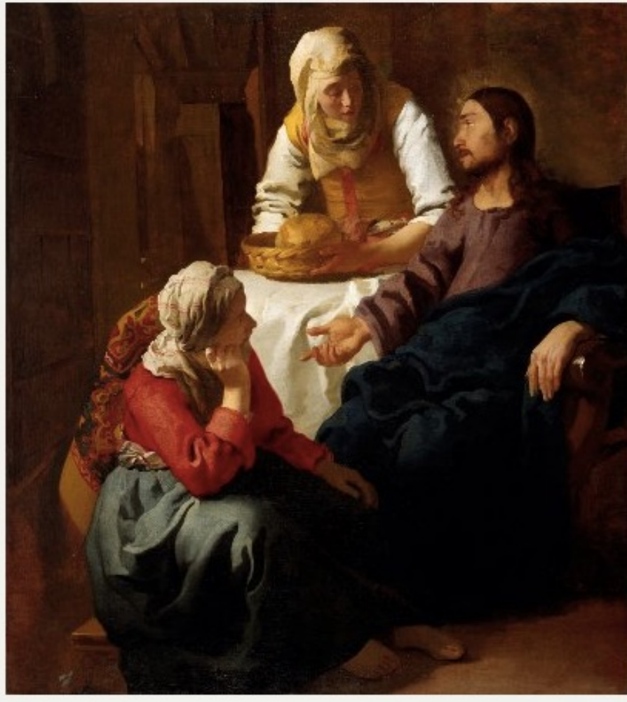
J. Vermeer, Le Christ chez Marthe et Marie, huile sur toile, 160 x 142 cm, 1654-1655, National Gallery of Scotland, Edinburgh