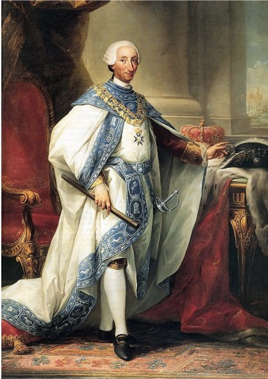
Charles de Bourbon (1716-1788), roi de Naples de 1734 à 1759, puis roi d'Espagne