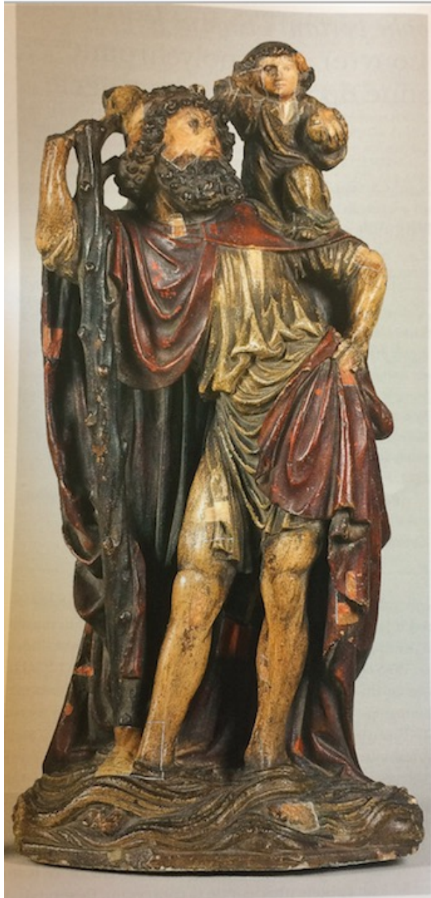
Saint Christophe, Bourgogne, XVe siècle, musée du Louvre, avant restauration