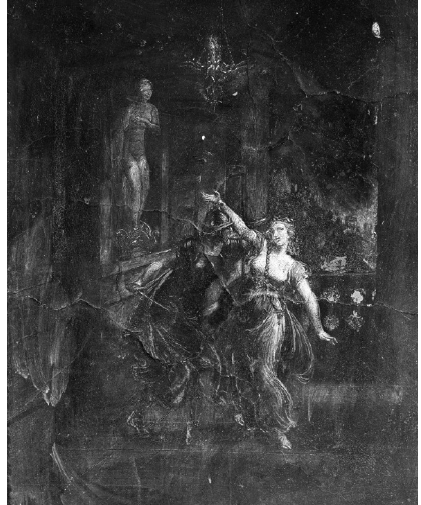
G. Guerra, Hélène et Ménélas , fausse peinture antique sur enduit, Florence.