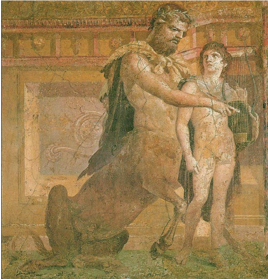
Achille et Chiron , Peinture d'Herculaneum, 1er s. av. J.C., Naples.