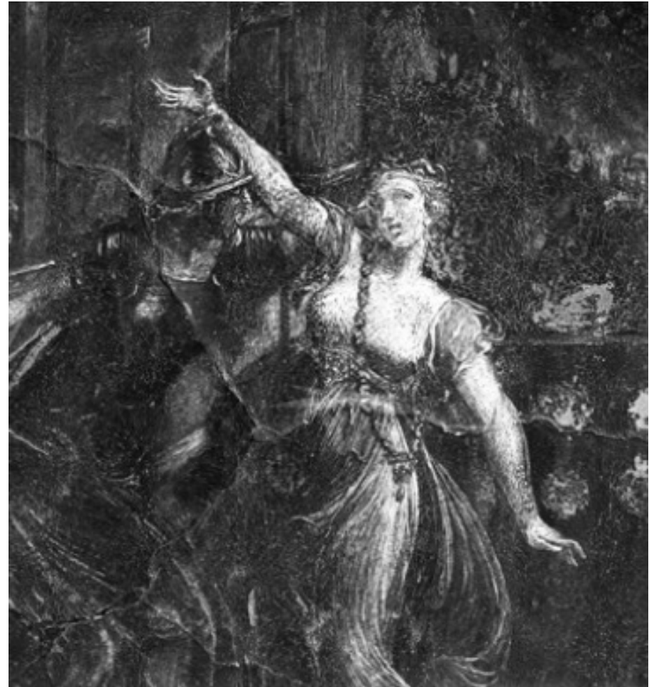
Giuseppe Guerra, Hélène et Ménélas, peinture sur enduit, Florence, musée des Offices