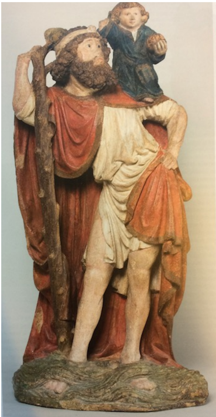
Saint Christophe, Bourgogne, XVe siècle, musée du Louvre, après restauration