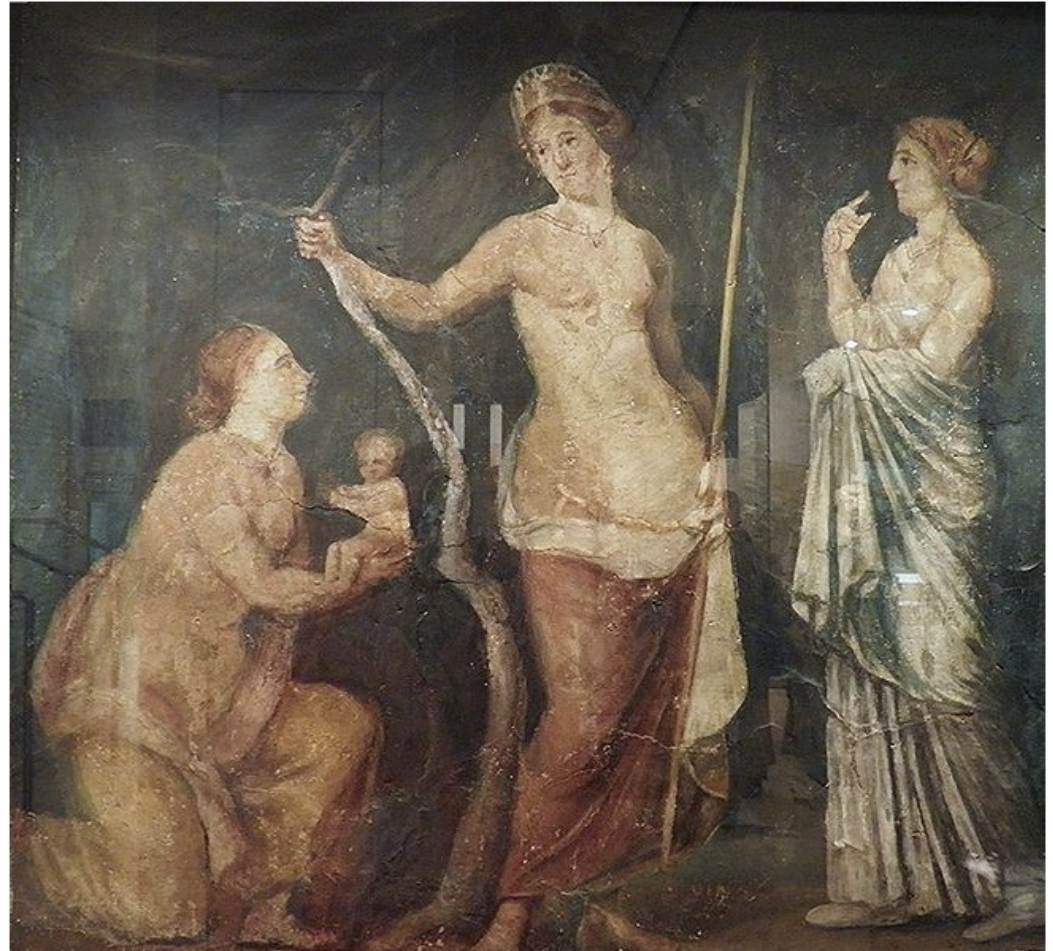
La Naissance d'Adonis, Peinture murale antique provenant de Rome, Ashmolean Museum, Oxford