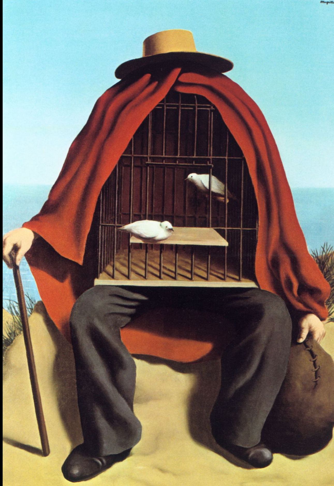
René Magritte, Thérapeute , 1937, huile sur toile, 47.6x31.3 cm