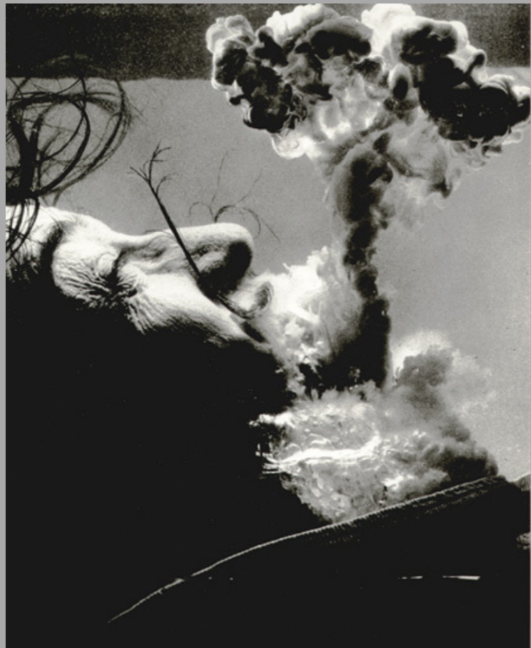
Philippe Halsman, 1954, 1956