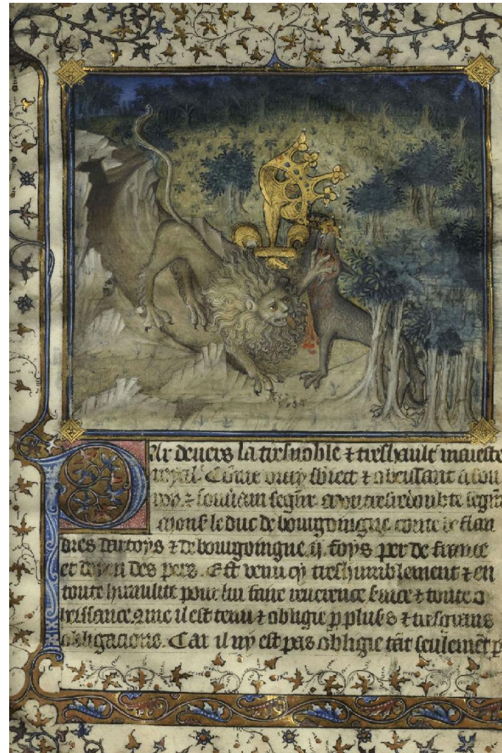
Chantilly, Musée Condé, ms 878