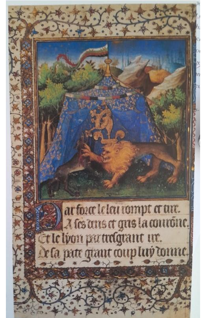
Vienne, ÖNB, ms. 2657