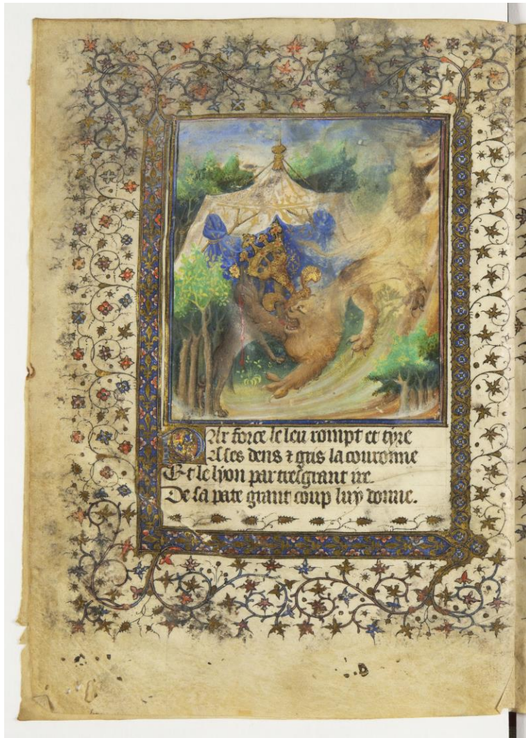
BnF, Français 5733