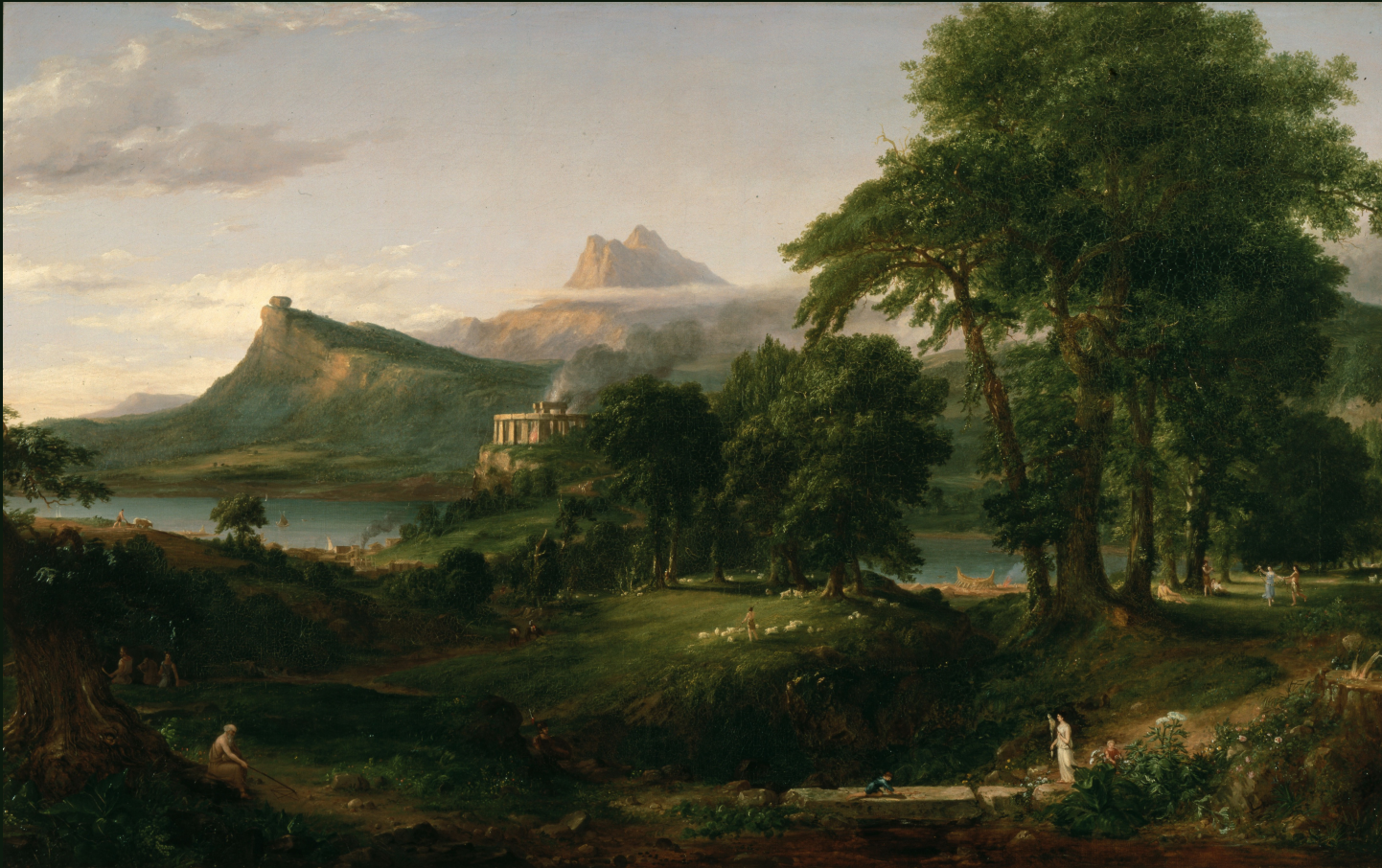
Thomas Cole, The Arcadian or Pastoral state , 1834