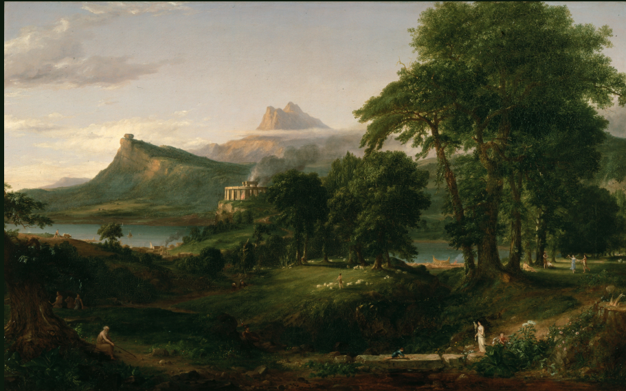
Thomas Cole, The Arcadian or Pastoral state, 1834