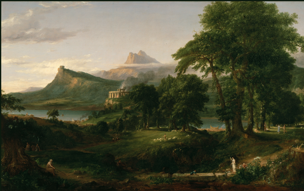
Thomas Cole, The Arcadian or Pastoral state, 1834