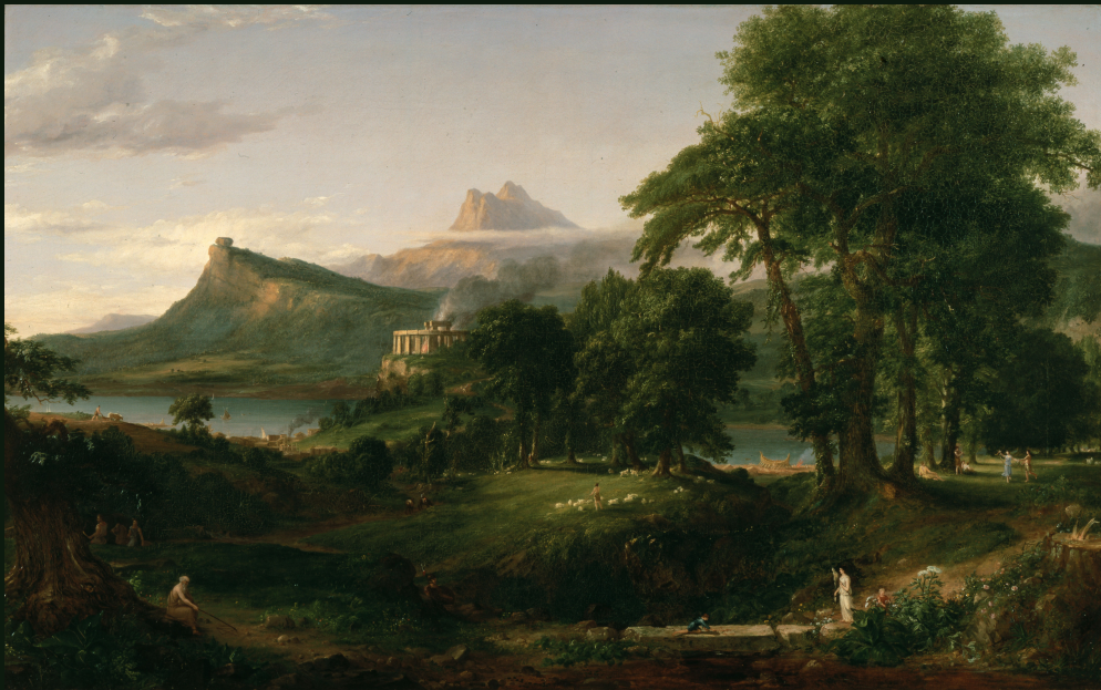
Thomas Cole, The Arcadian or Pastoral state, 1834

B) Ainsi que d’une domination de la nature