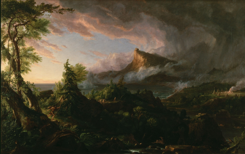
Thomas Cole, The Savage state , 1834