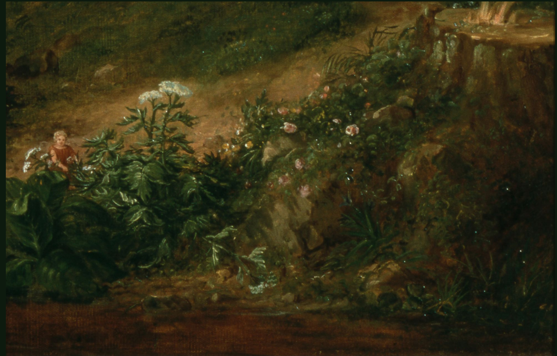
Thomas Cole, The Arcadian or Pastoral state, détail, 1834