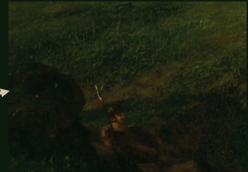
Thomas Cole, The Arcadian or Pastoral state, 1834