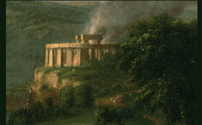
Thomas Cole, The Arcadian or Pastoral state, détail, 1834