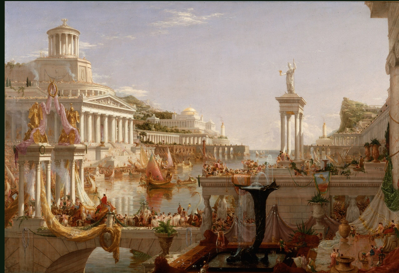
The Consummation of Empire, 1836