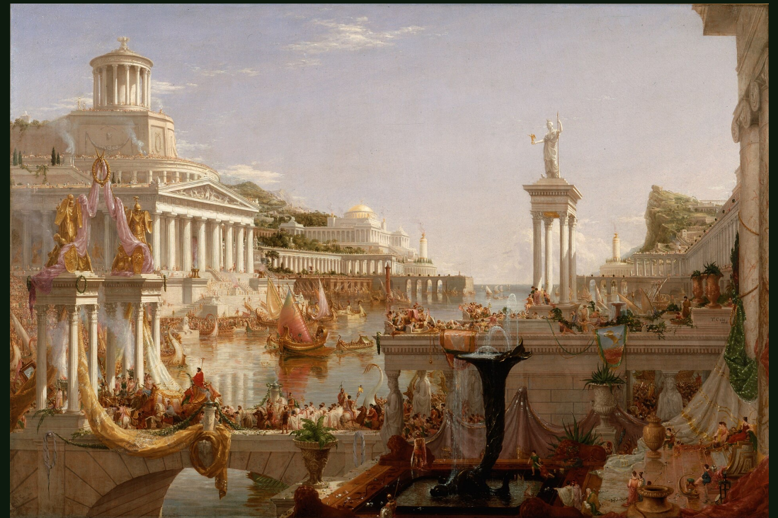
Thomas Cole, The Consummation of Empire , 1836