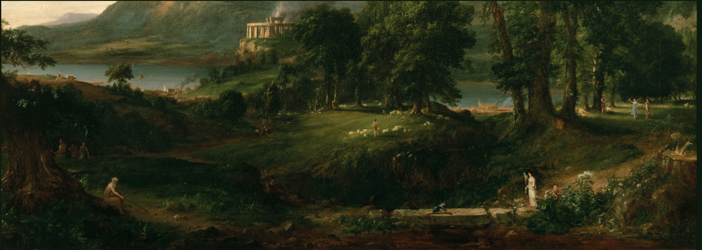
Thomas Cole, The Arcadian or Pastoral state, détail, 1834