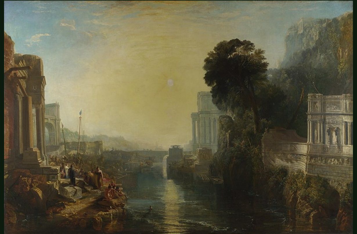
J. M. W. Turner, Dido Building Carthage, 1815