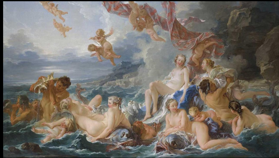
François Boucher, La Naissance de Vénus , 1740, huile sur toile, National Museum of Stockholm.