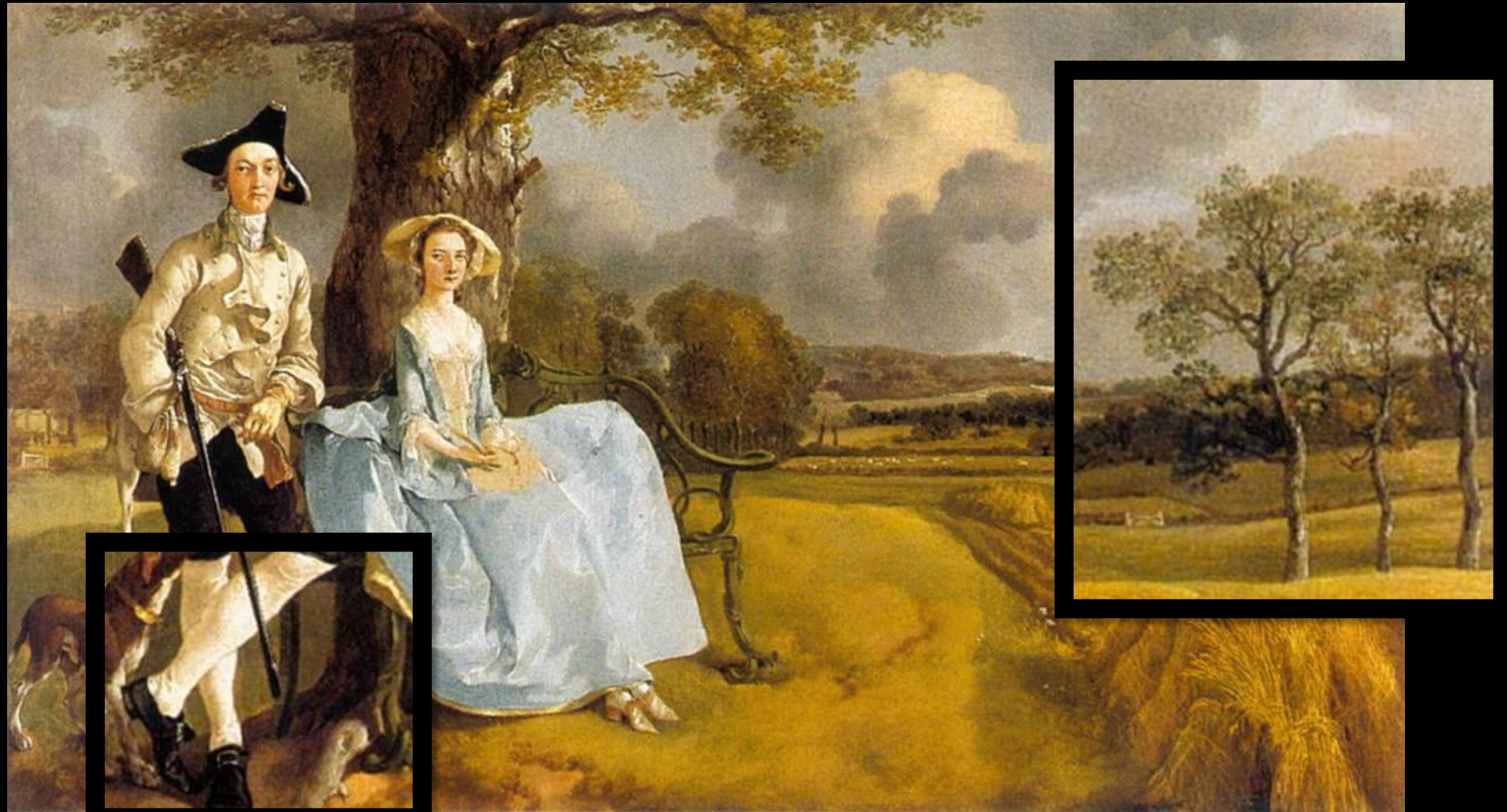
Thomas Gainsborough, Mr and Mrs Andrews , 1748-49, huile sur toile, 70 x 119 cm, National Gallery, Londres