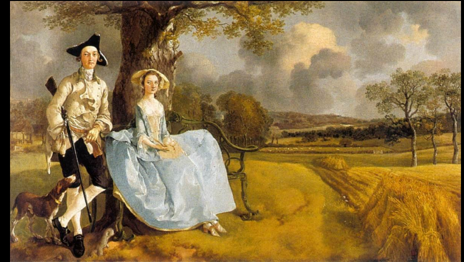
Thomas Gainsborough, Mr and Mrs Andrews , 1748-49, huile sur toile, National Gallery, Londres