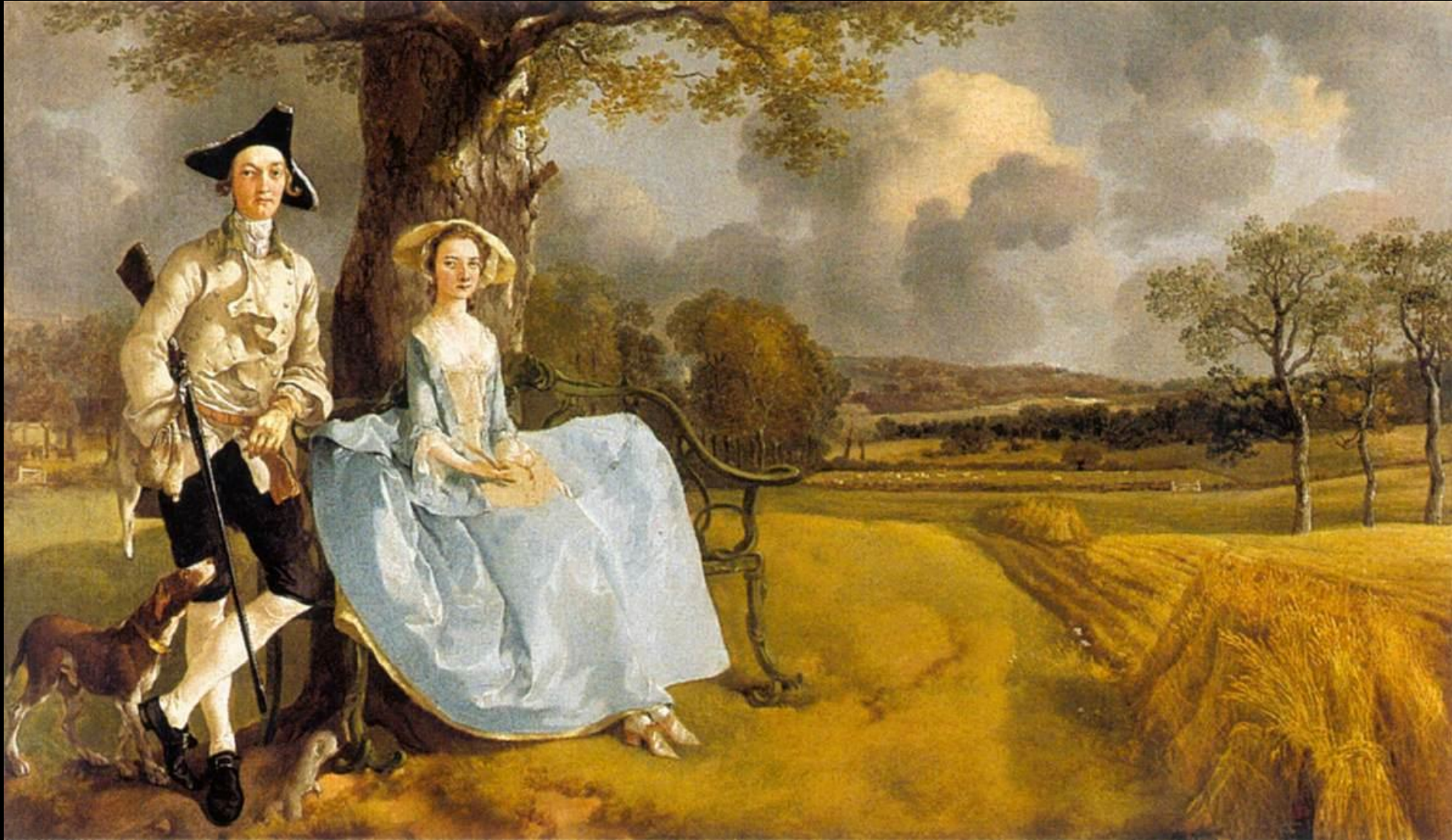
Thomas Gainsborough, Mr and Mrs Andrews , 1748-49, huile sur toile, 70 x 119 cm, National Gallery, Londres