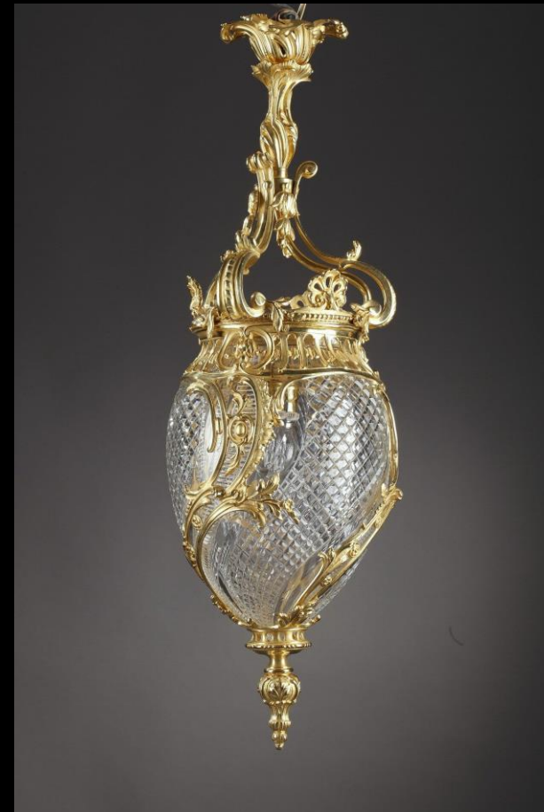
Lanterne ovoïde de style Louis XV