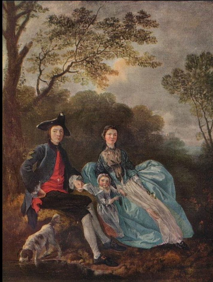
Thomas Gainsborough, Portrait of the Artist with his Wife and Daughter , 1748, huile sur toile, Collection privée