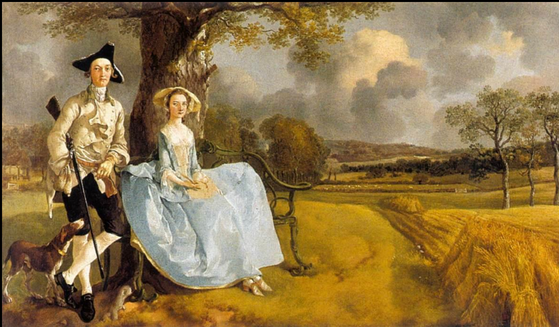
Thomas Gainsborough, Mr and Mrs Andrews , 1748-49, huile sur toile, 70 x 119 cm, National Gallery, Londres