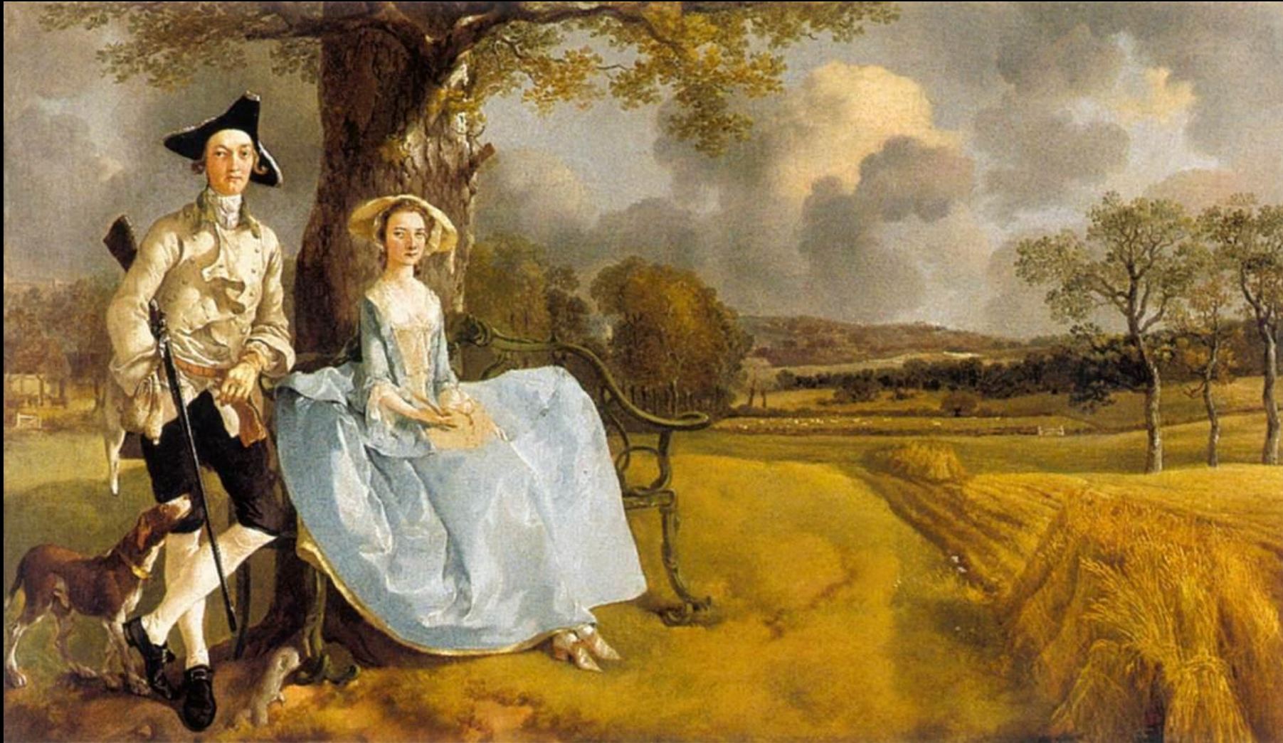
Thomas Gainsborough, Mr and Mrs Andrews , 1748-49, huile sur toile, 70 x 119 cm, National Gallery, Londres

1) Un tableau divisé en deux parties distinctes :