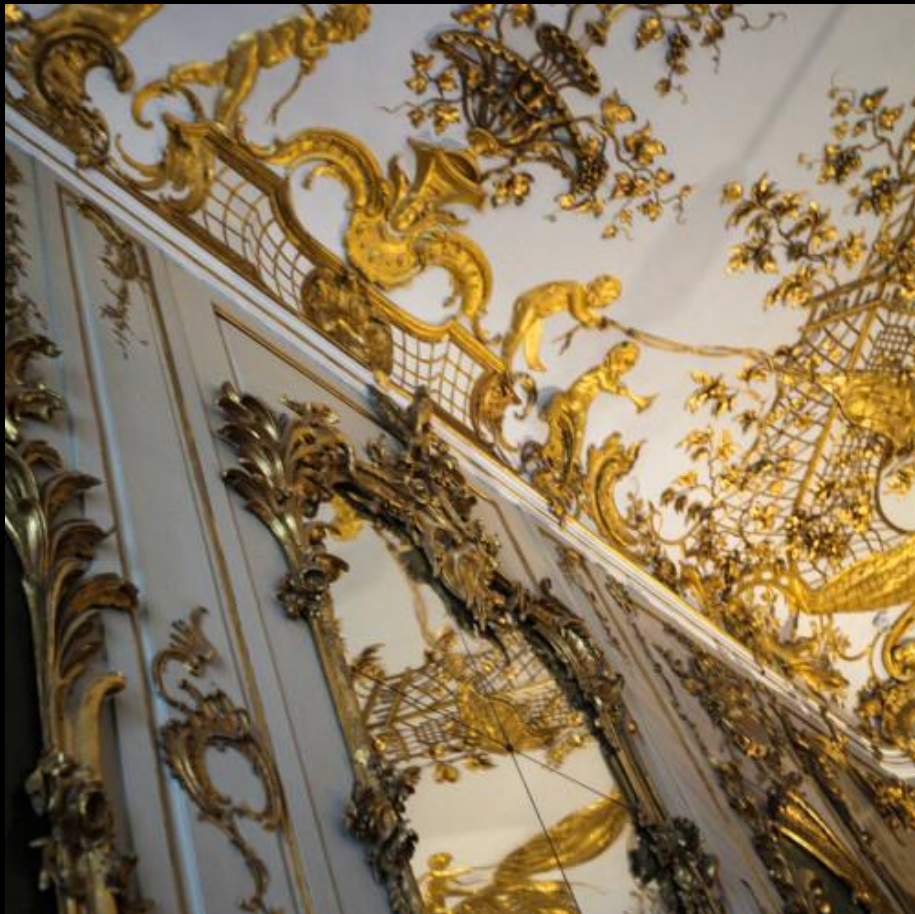
Salon du palais de Sanssouci à Potsdam près de Berlin