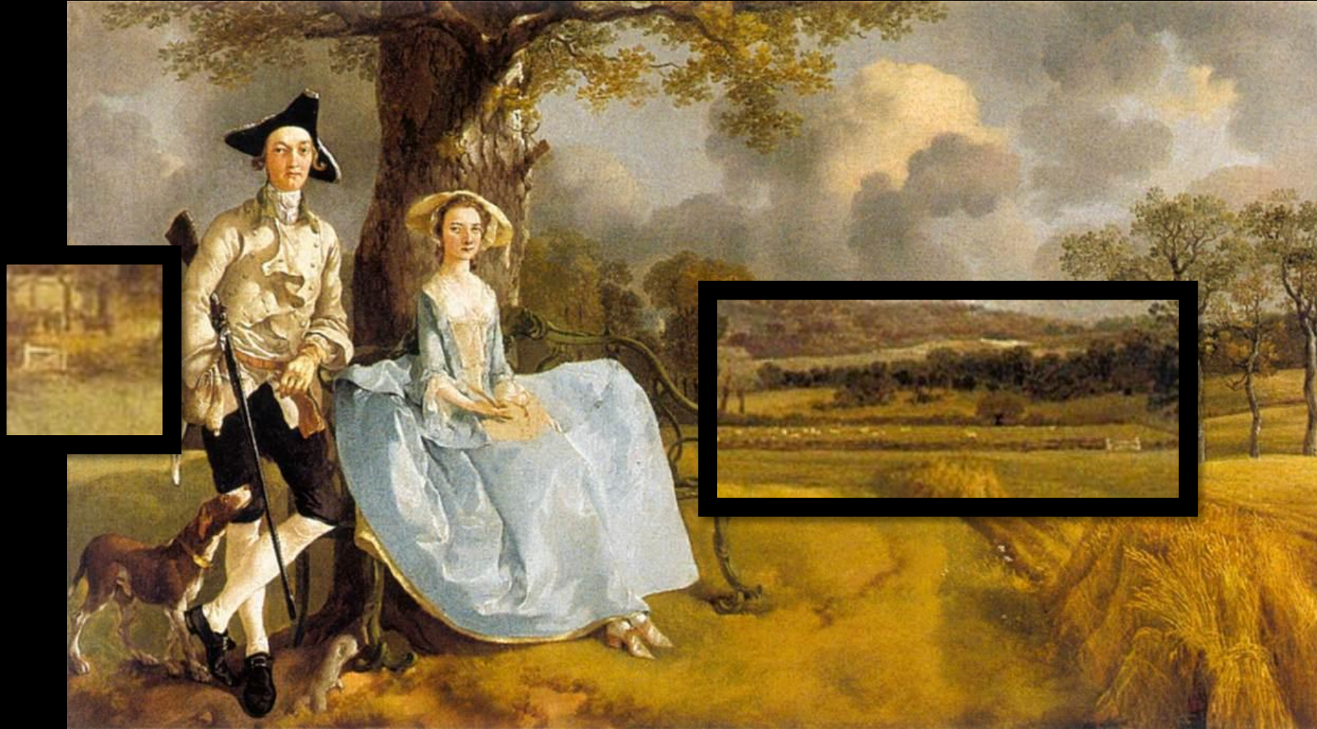
Thomas Gainsborough, Mr and Mrs Andrews , 1748-49, huile sur toile, 70 x 119 cm, National Gallery, Londres