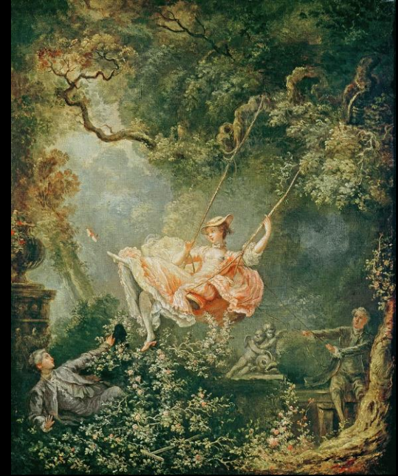
Jean Honoré Fragonard, Les Hasards heureux de l'escarpolette , 1767-1769, huile sur toile, 81 x 64cm, Wallace Collection, Londres