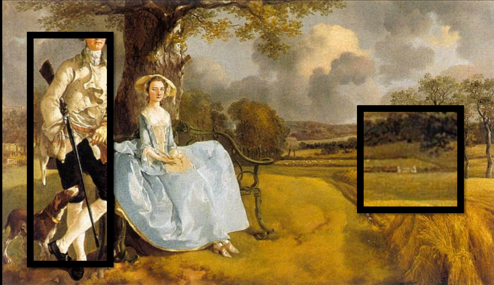
Thomas Gainsborough, Mr and Mrs Andrews , 1748-49, huile sur toile, 70 x 119 cm, National Gallery, Londres