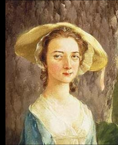
(détails) Thomas Gainsborough, Mr and Mrs Andrews , 1748-49, huile sur toile, 70 x 119 cm, National Gallery, Londres