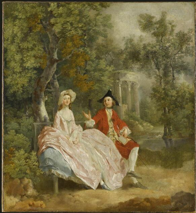
Thomas Gainsborough, Conversation dans un parc , 1746-1747, huile sur toile, musée du Louvre, Paris