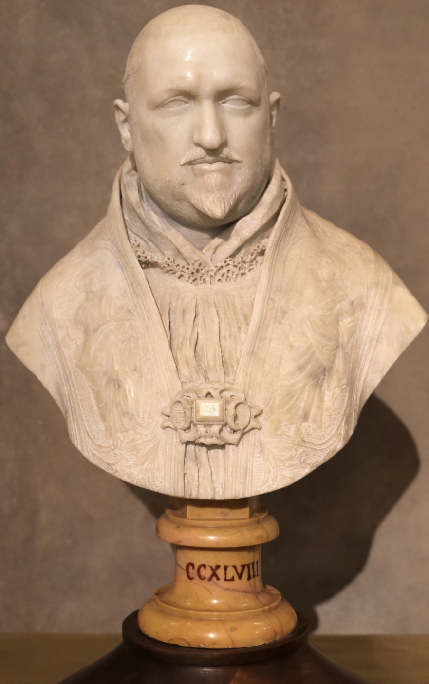
Le Bernin Paul V c. 1622 Marbre h. 33 cm Galerie Borghese Rome