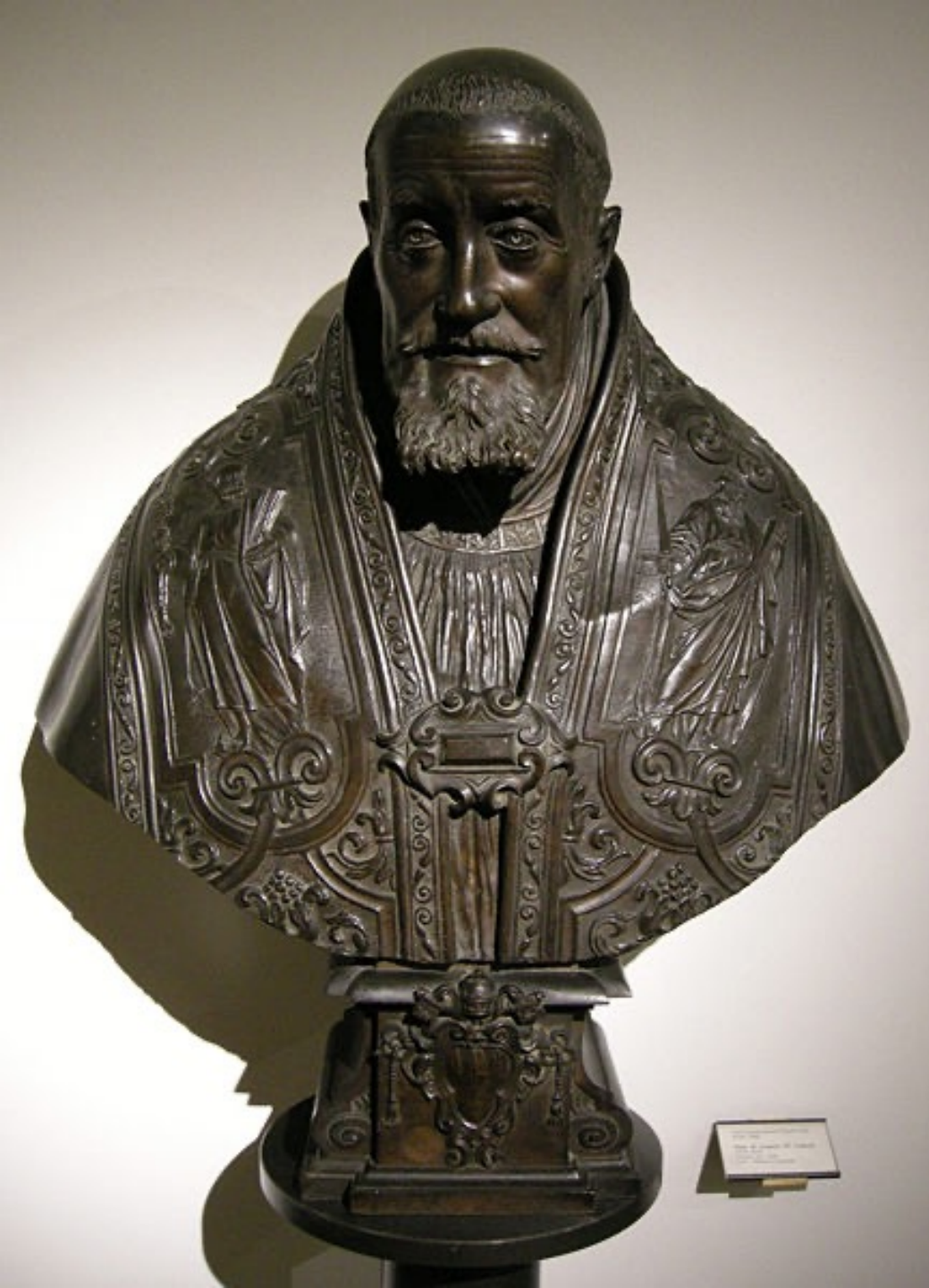
Le Bernin Grégoire XV 1622 Bronze h. 83 cm Bologna Museo Civico