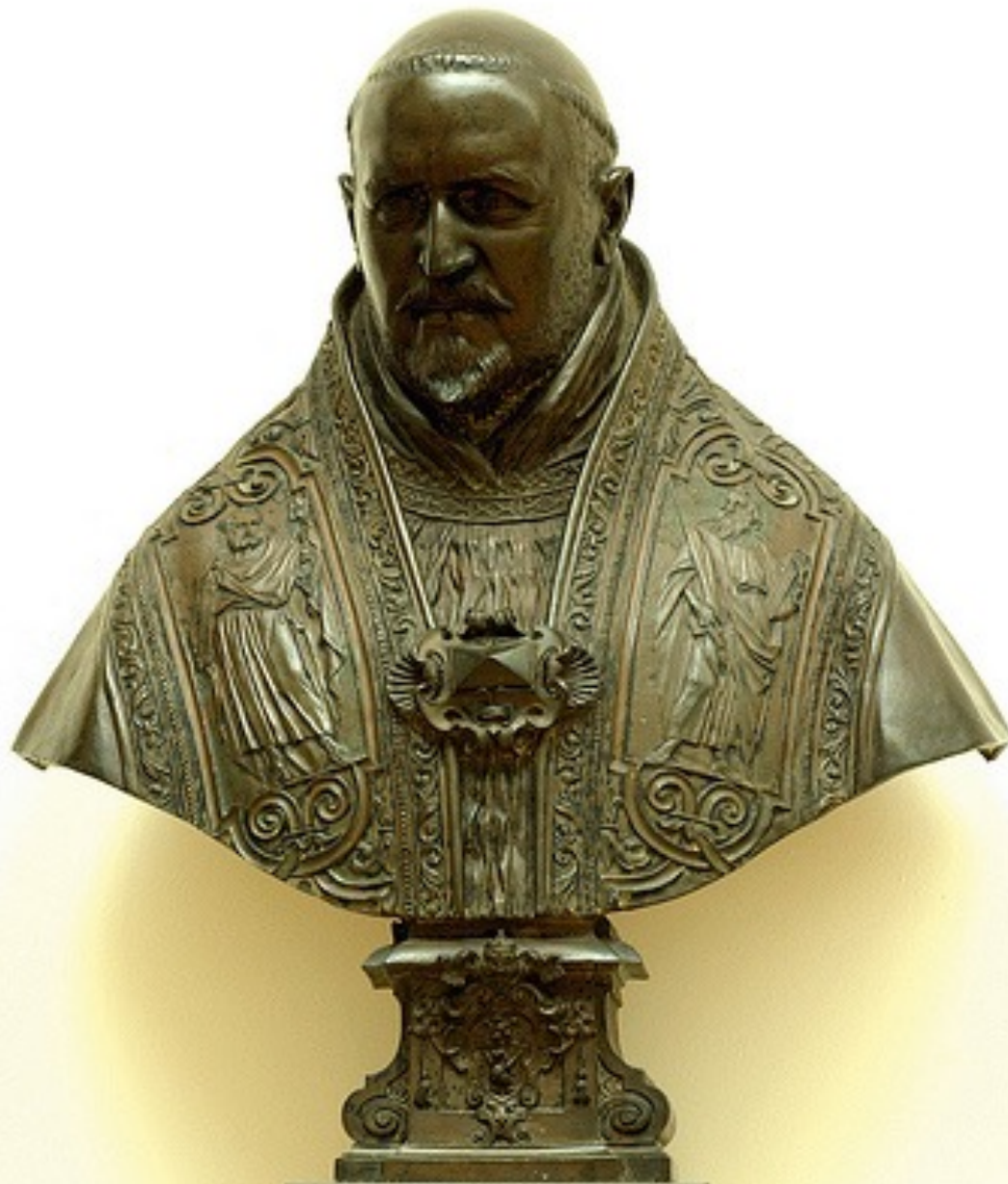
Le Bernin Paul V c. 1621-1622 Bronze h. 83 cm Copenhagen Statens museum

Giovanni Lorenzo Bernini 1598-1680 Italiensk Buste af Pave Paul V Borghese (1552, Pave 1605-1621) 1621/1622 Buste af Pape Paul V Borghese Bronze