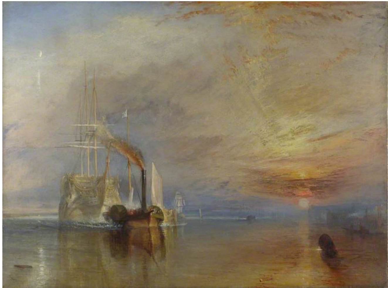
Joseph Mallord William Turner, The Fighting Temeraire tugged to her last berth to be broken up, 1839