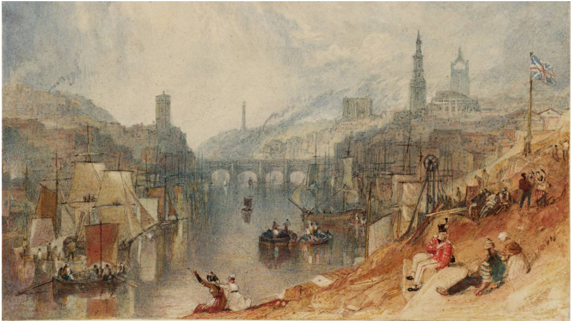
Joseph Mallord William Turner, The Provincial Antiquities and Picturesque Scenery of Scotland (1823)