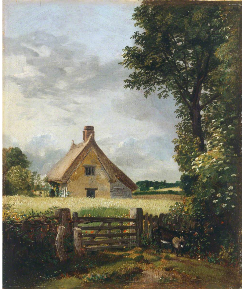
John Constable, A Cottage in a Cornfield , huile sur toile