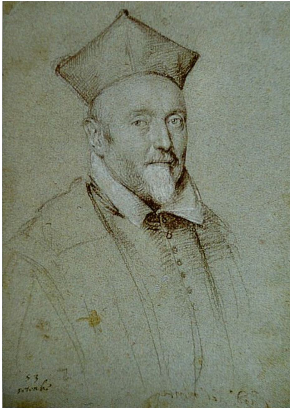
Ottovio Leoni, Portrait du cardinal Francesco Maria del Monte , 1616, dessin, 22,9 x 16,5 cm, Sarasota, John and Mable Ringling Museum of Art