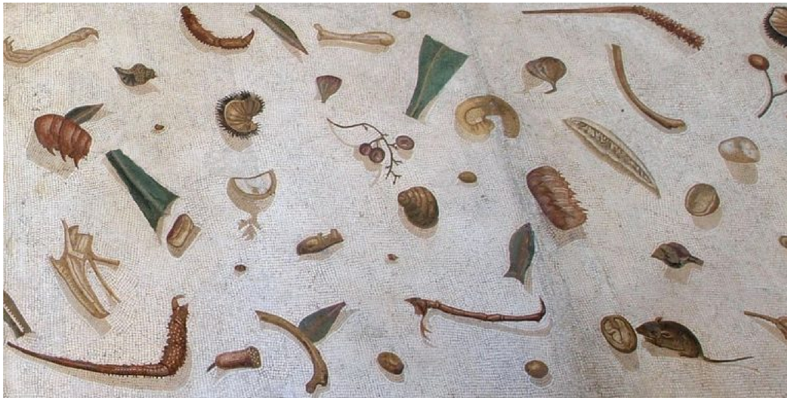
Sôsos de Pergame, Asarotos oikos. Mosaique, Ile s. ap. J.-C., Vigna Lupi, Rome, Musei Vaticani