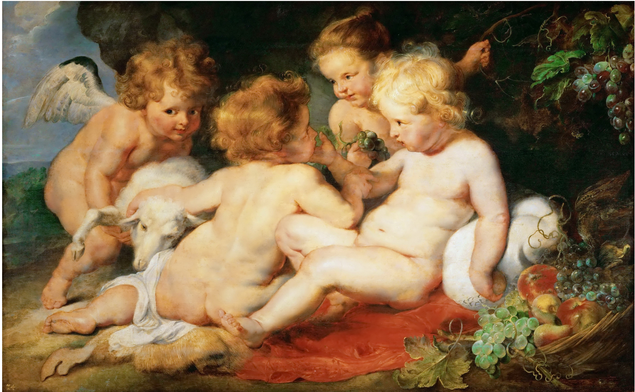
Peter Paul Rubens et Frans Snyders, L'enfant Christ avec Jean le Baptiste et deux anges , v. 1615-1620, huile sur bois, 76,5 x 122,3 cm, Vienne, Kunsthistorisches Museum