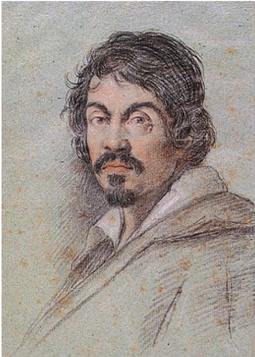
Ottavio Maria Leoni, Le Caravage, v. 1621, dessin, 23,4 x 16,3 cm , Florence, Biblioteca Marucelliana

« Une nature morte authentique naît le jour où le peintre prend la décision fondamentale de prendre pour thème un groupe d'objets et de les disposer en une entité picturale »