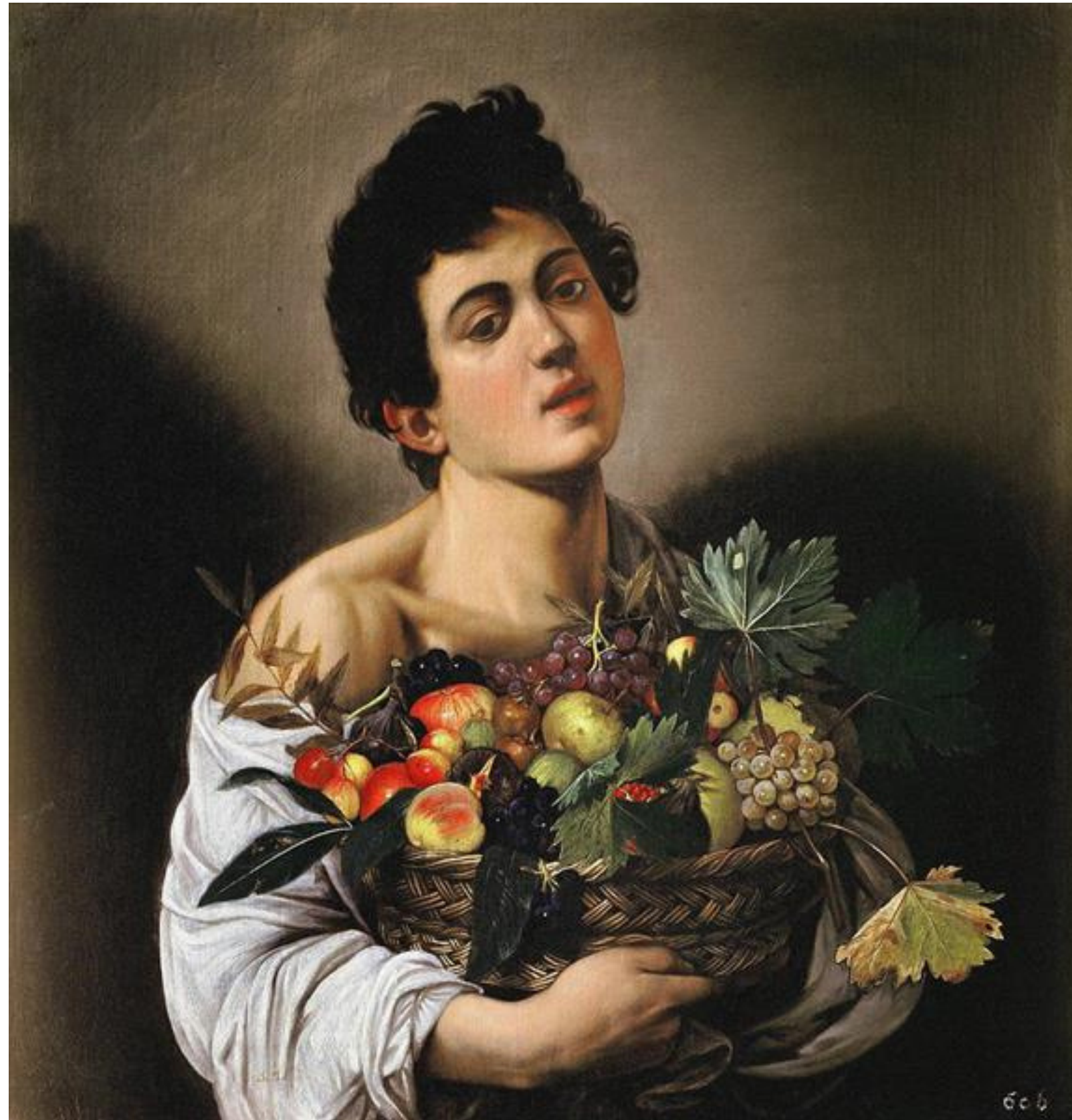
Caravaggio, Garçon avec un panier de fruits , 1593, huile sur toile, 70 x 67 cm, Rome, Galleria Borghese