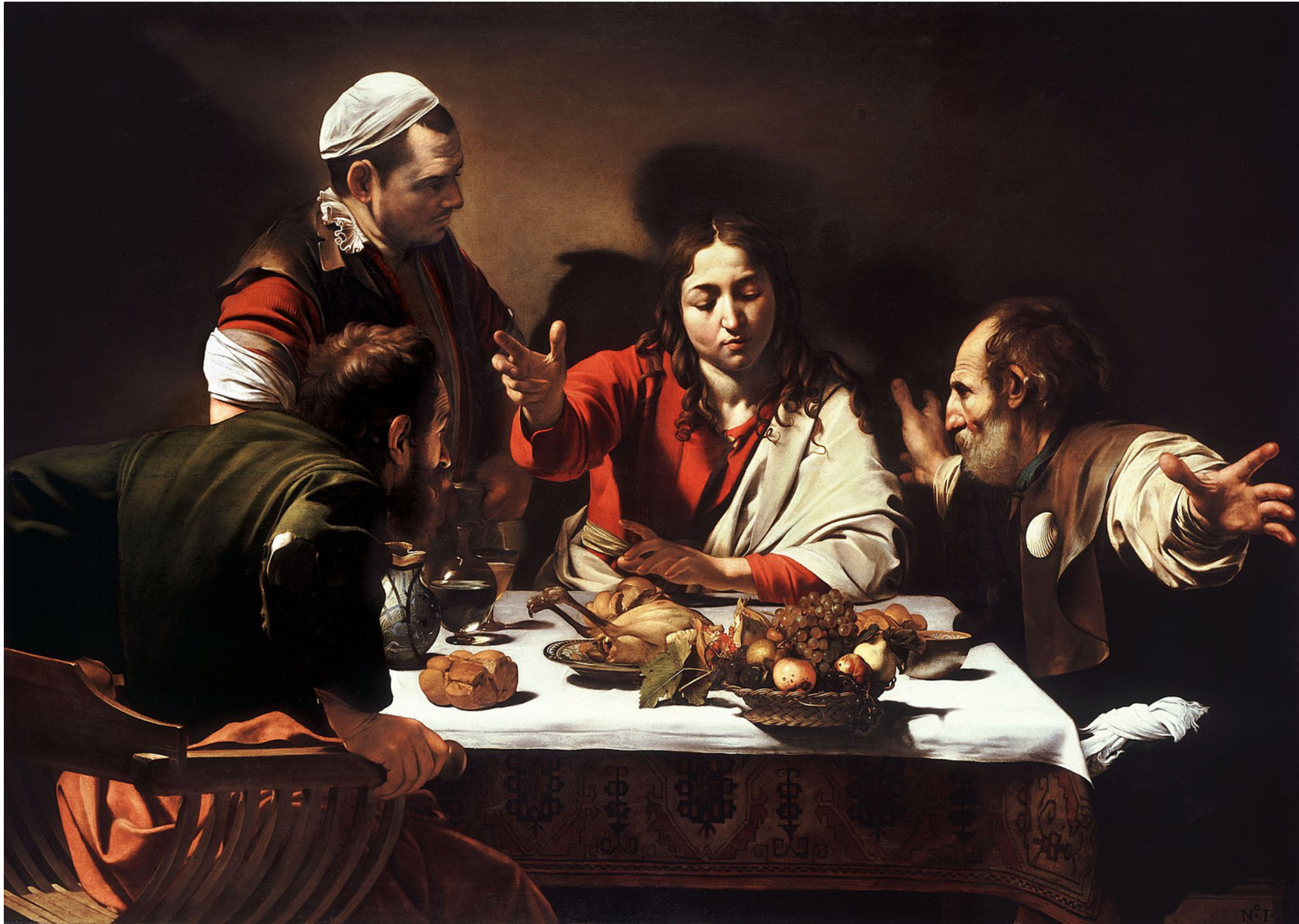
Caravage, Le Souper à Emmaüs , 1606, huile sur toile, 141 x 175 cm, Milan, Pinacoteca di Brera