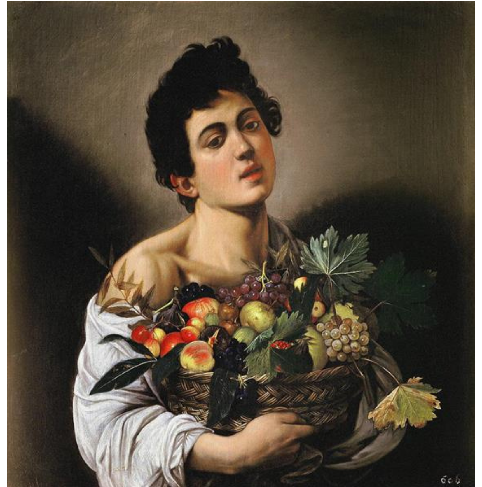
Caravaggio, Garçon avec un panier de fruits, 1593, huile sur toile, 70 x 67 cm, Rome, Galleria Borghese