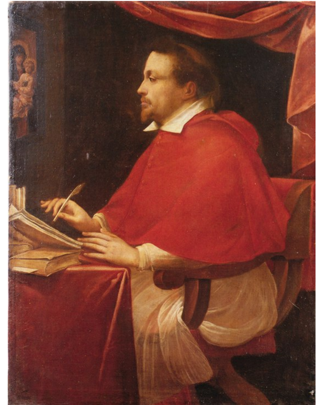
Giulio Cesare Procaccini, Portrait de Federico Borromée , 1610, huile sur toile, 68 x 55 cm, Milan, Museo Diocesano