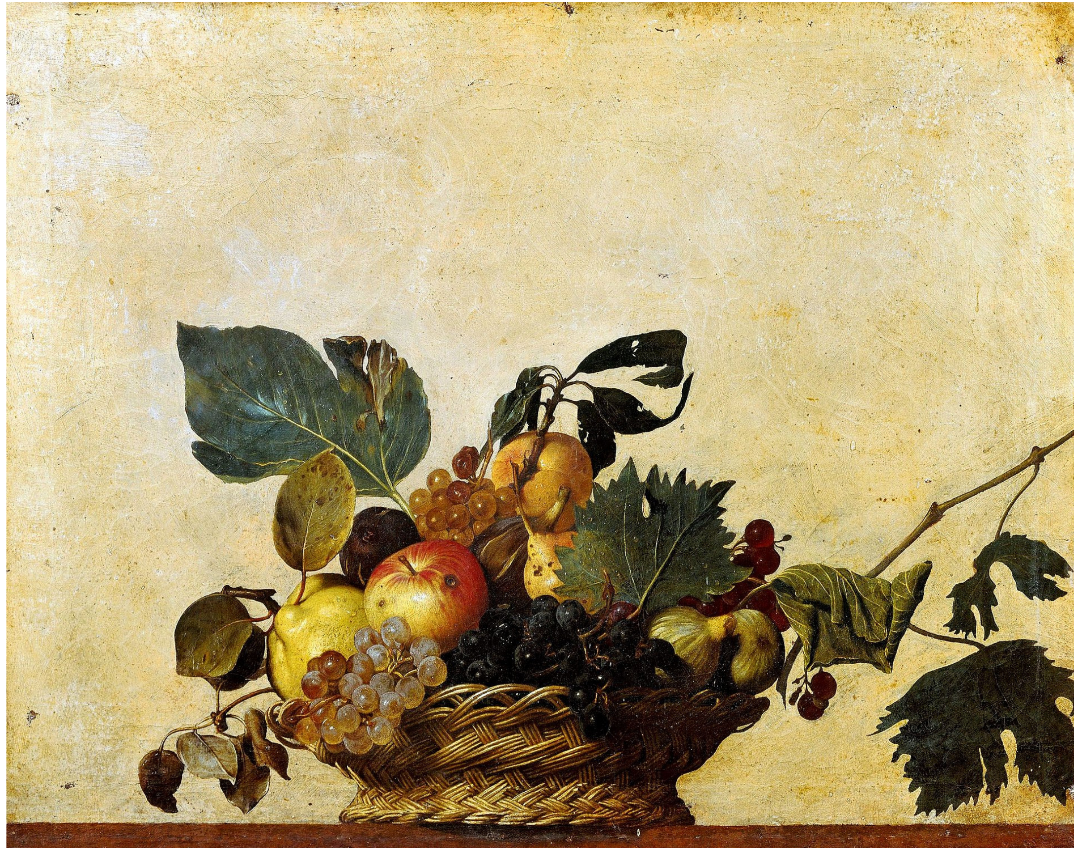
Caravaggio, Corbeille de fruits , v. 1594-1602, huile sur toile, 46 x 64,5 cm, Milan, Pinacoteca Ambrosiana