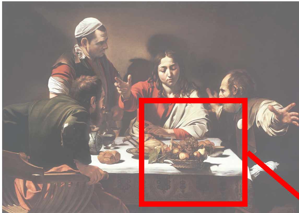
Caravage, Le Souper à Emmaüs, 1606, huile sur toile, 141 x 175 cm, Milan, Pinacoteca di Brera