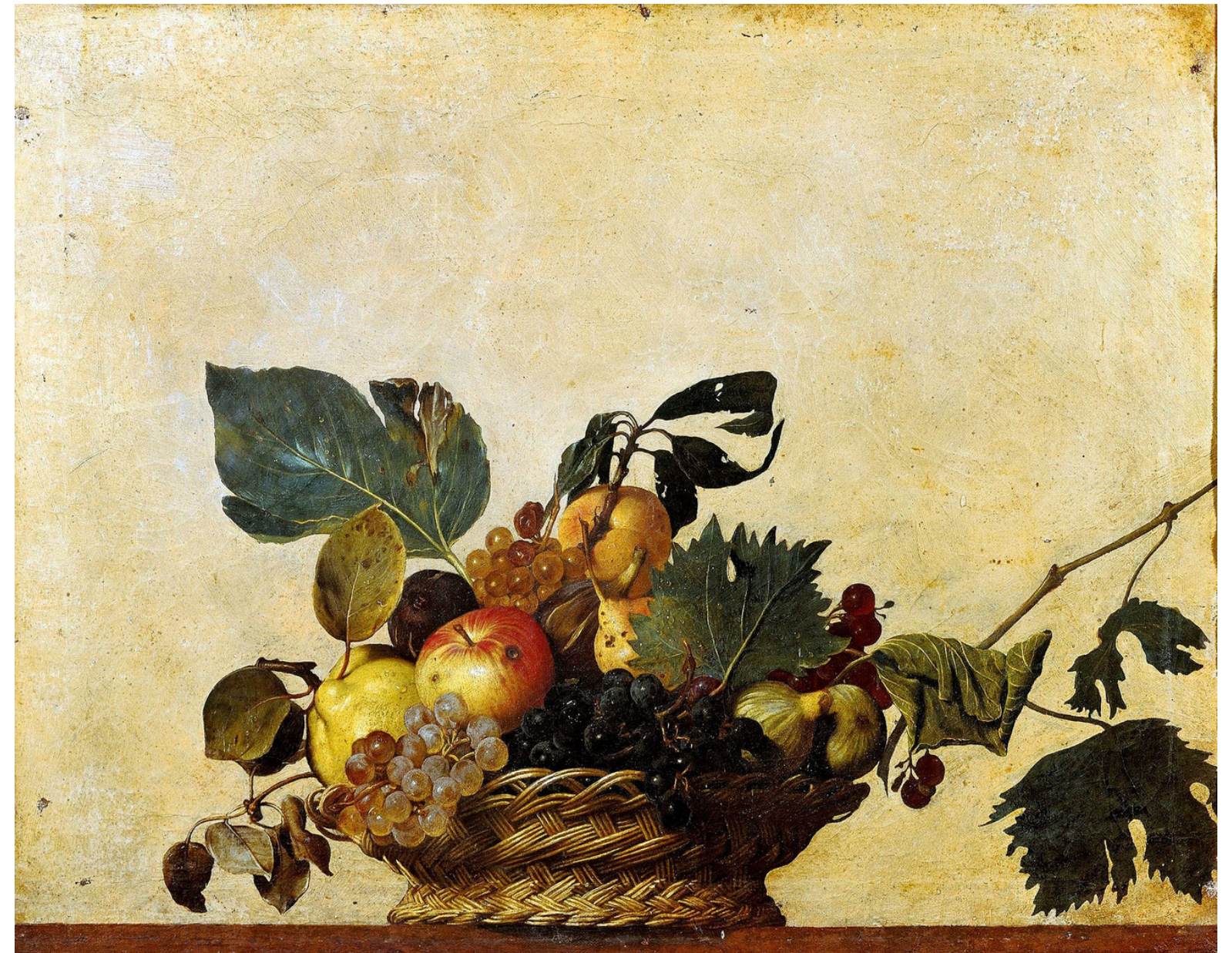
Caravage, Corbeille de fruits , v. 1594-1602, huile sur toile, 46 x 64,5 cm, Milan, Pinacoteca Ambrosiana