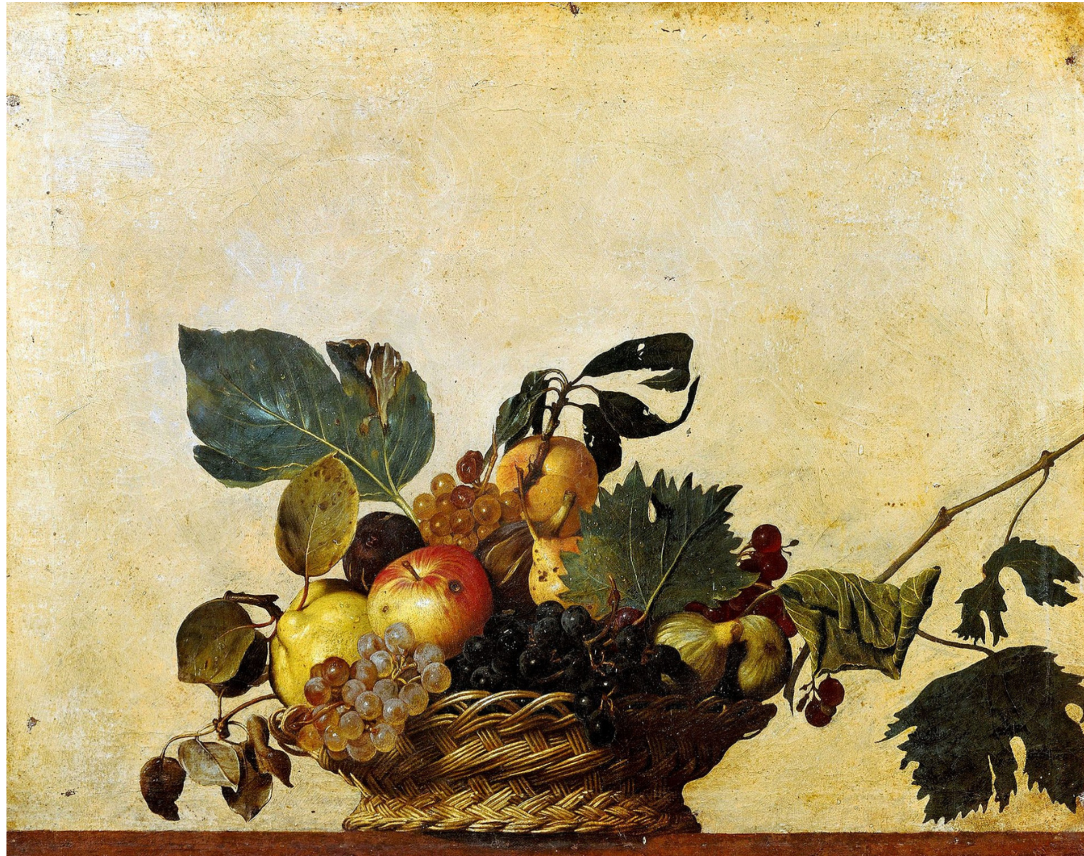
Caravaggio, Corbeille de fruits , v. 1594-1602, huile sur toile, 46 x 64,5 cm, Milan, Pinacoteca Ambrosiana