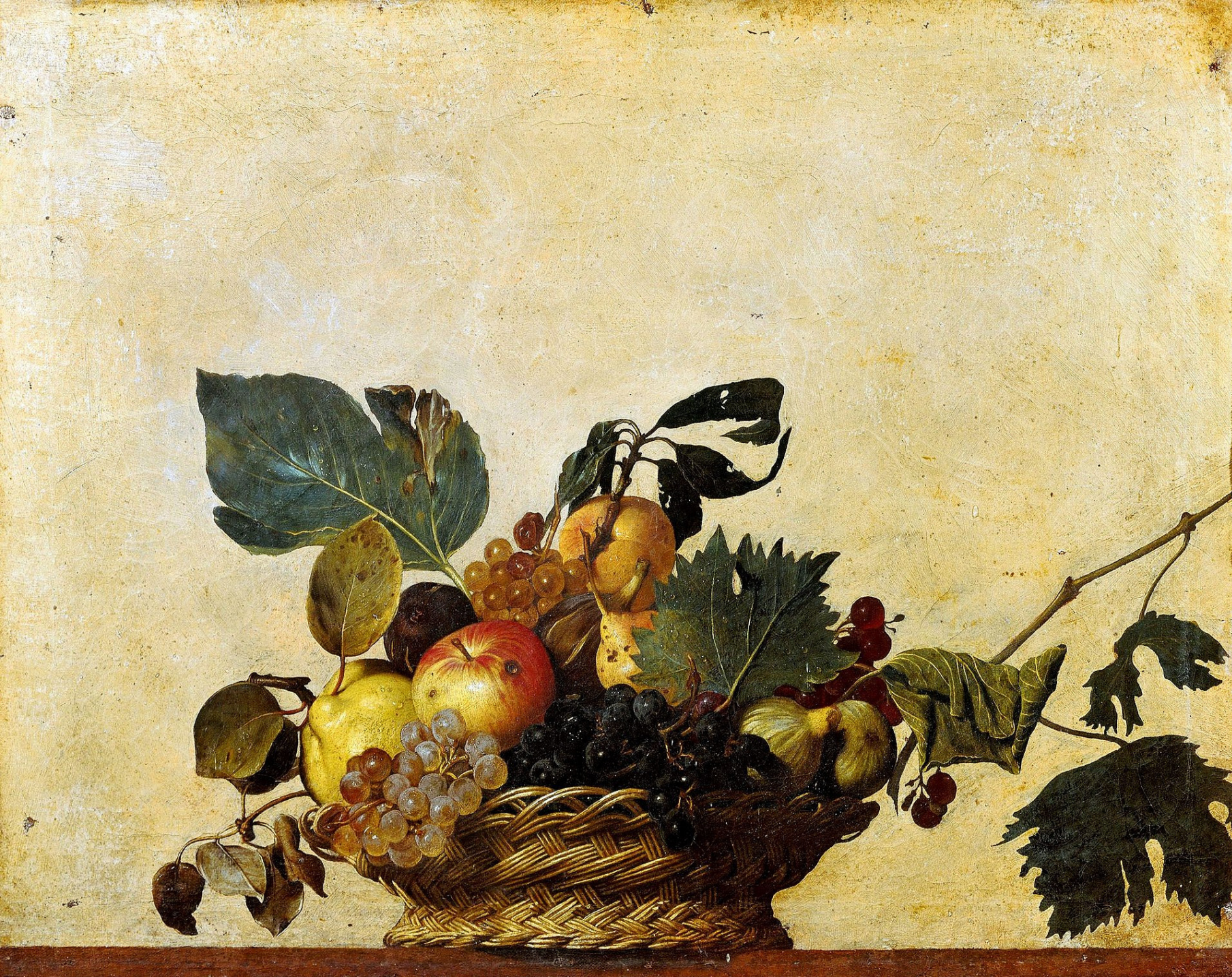
Caravaggio, Corbeille de fruits , v. 1594-1602, huile sur toile, 46 x 64,5 cm, Milan, Pinacoteca Ambrosiana