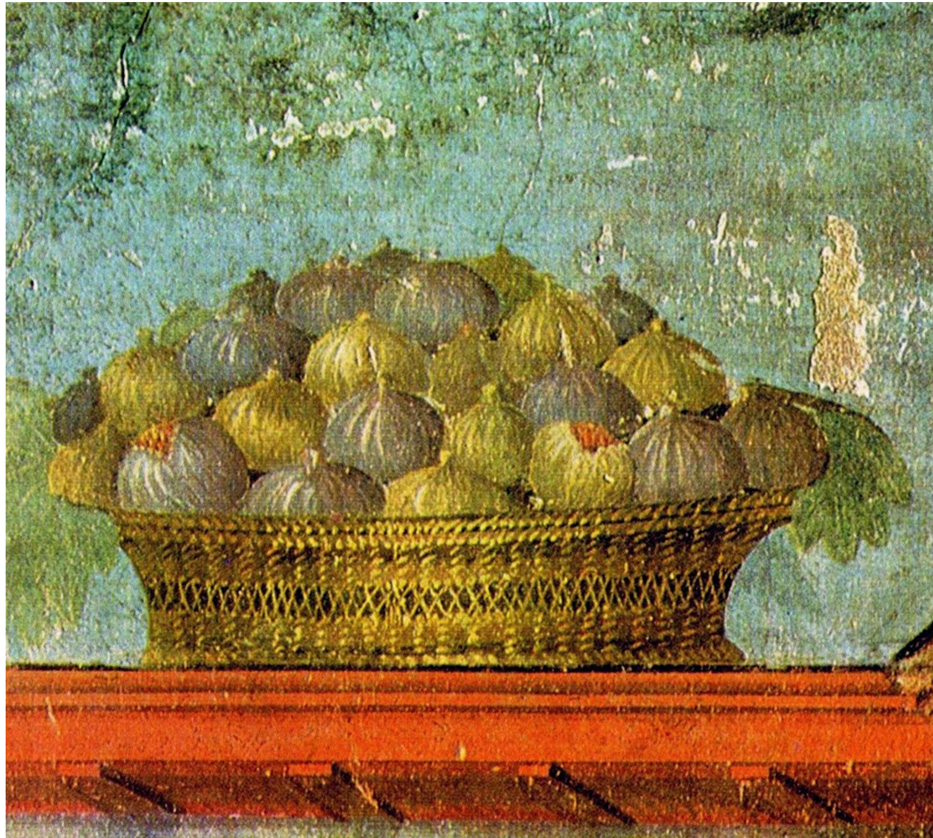
Fresque du 1er siècle après JC représentant un panier en osier rempli de figes trouvée sur le mur du fond du triclinium de la Villa de Poppée à Oplontis, (pas encore découverte à l'époque)