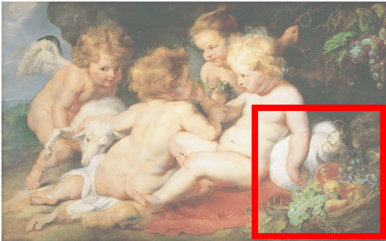
Peter Paul Rubens et Frans Snyders, L'enfant Christ avec Jean le Baptiste et deux anges, 1615-1620, Vienne, Kunsthistorisches Museum