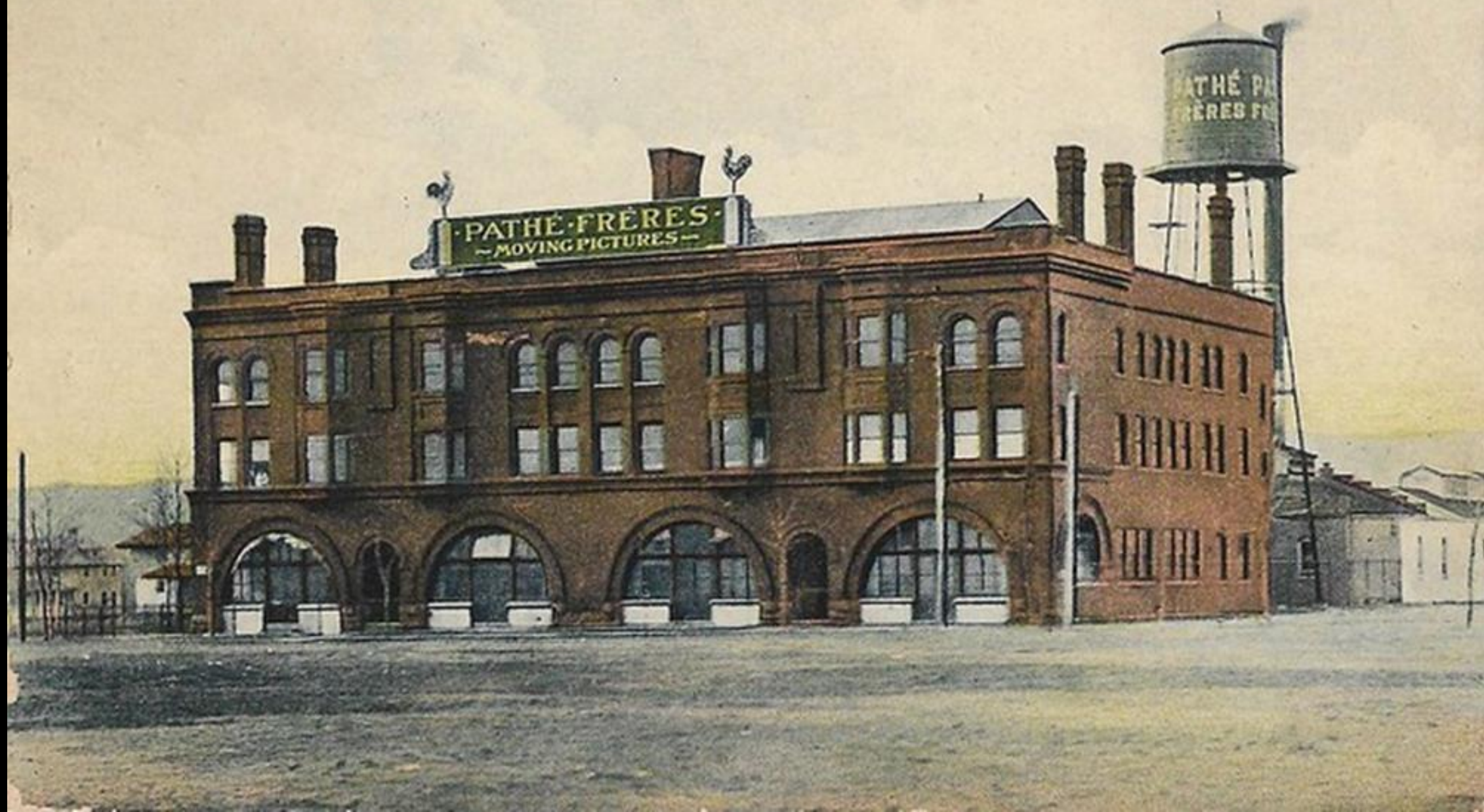
Pathé Frères, Bound Brook, N. J.