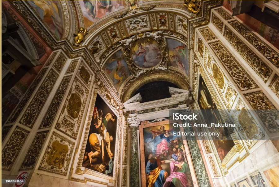
Vue de la chapelle Cerasi