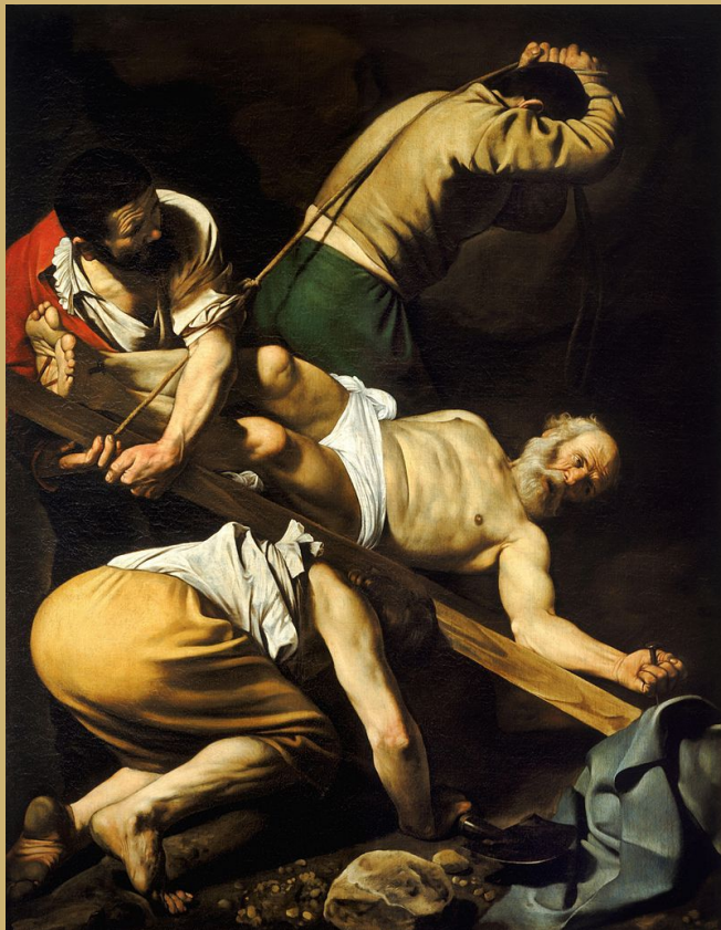
Caravage, La crucifixion de saint Pierre , 1600, huile sur toile