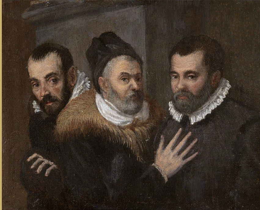
Annibale, Ludovico et Agostino Carracci (école bolonaise du XVIIe siècle).