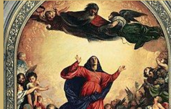
Détail du tableau de Titien, assomption de la vierge, 1515-1518