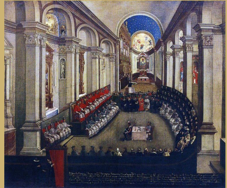
Réunion du concile en l'église Santa Maria Maggiore de Trente. Musée diocésain de Trente.