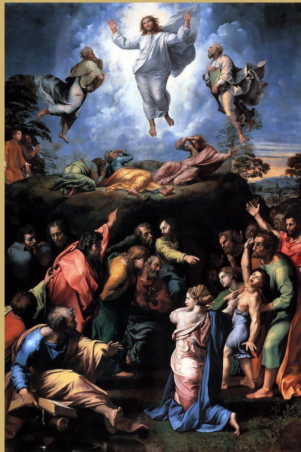
Raphaël, Transfiguration , 1518-1520, huile sur bois, 405 x 278 cm, Musée du Vatican