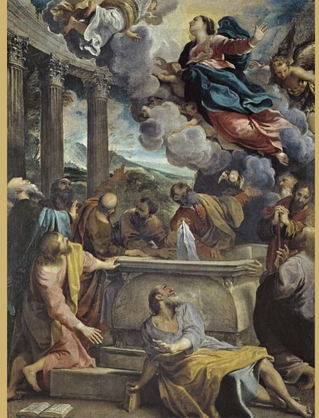
Annibal Carrache, L'Assomption de la Vierge, vers 1590, huile sur toile, 130x97 cm, Musée du Prado, Madrid