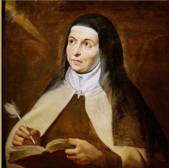
Sainte Thérèse d'Avila par Rubens (v. 1615).

« à l'impuissance des mots à décrire l'extase, répondent les pouvoirs d'une image destinée à ravir à son tour le dévot spectateur »