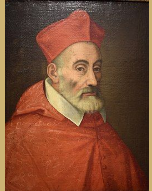
Portrait du cardinal Gabriele Paleotti à la Pinacothèque Domenico Inzaghi à Budrio, ville métropolitaine de Bologne.