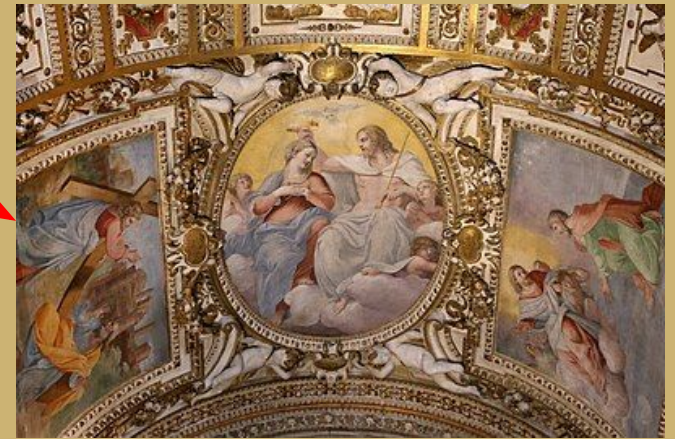
Détail de la chapelle Cerasi, couronnement de la Vierge, Annibal Carrache, 1600