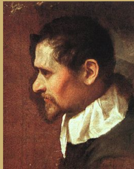
Annibal Carrache, Autoportrait de profil , 1590-1600 c., peinture à l'huile sur toile, 45,4 × 37,9 cm, Florence, Galerie des Offices.