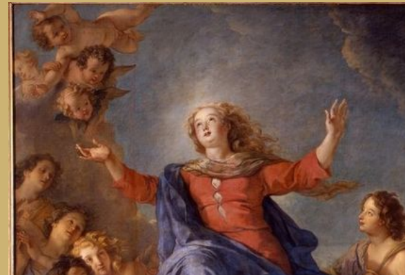
Détail du tableau de l'assomption de Charles de la Fosse en 1616