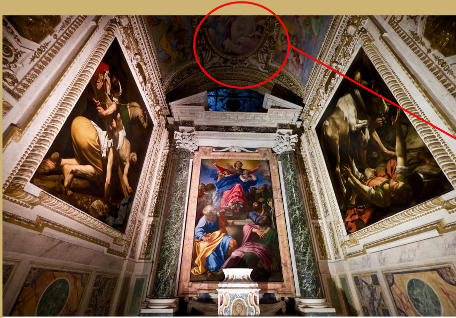
Vue de la chapelle Cerasi