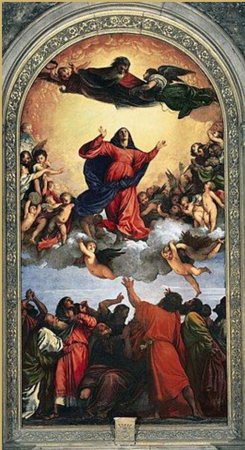
Titien, L'Assomption , 1516-1518, Huile sur bois 690 × 360 cm, Église Santa Maria Gloriosa dei Frari, Venise