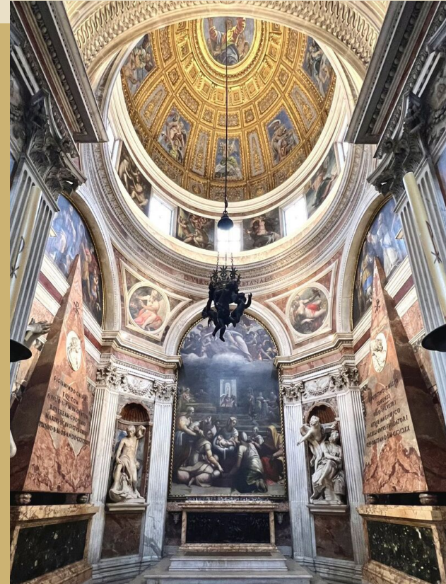
Photo de la chapelle Chigi, réalisé par Raphaël