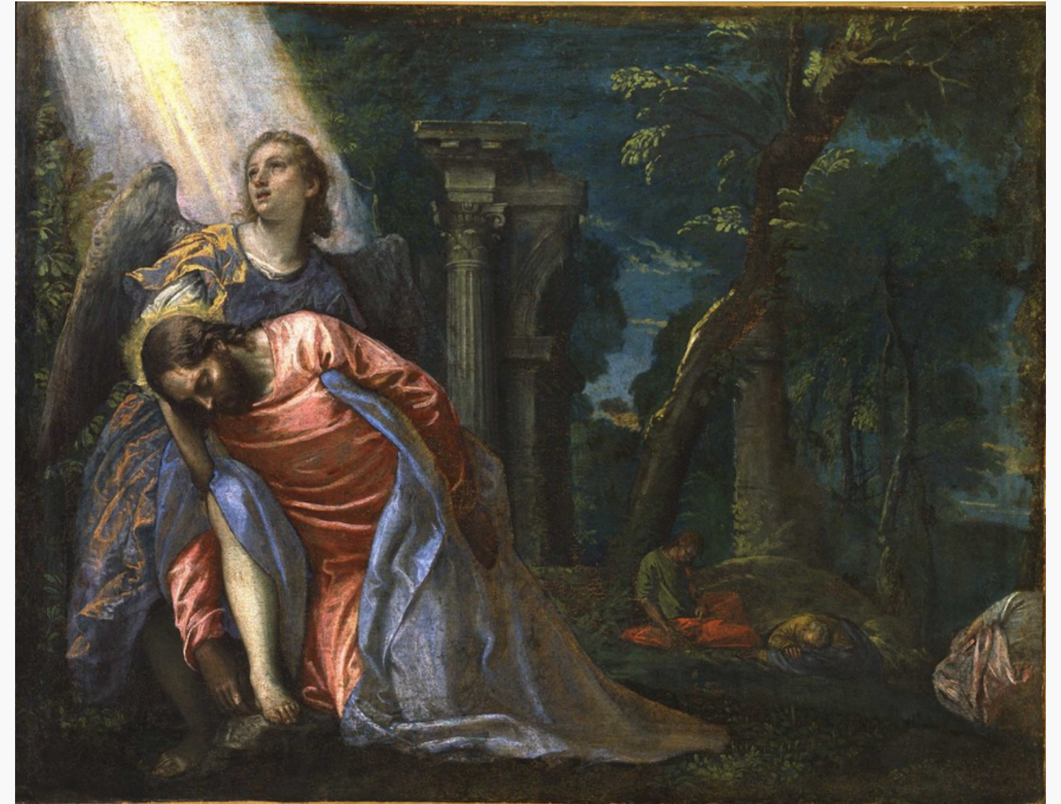
Véronèse, La Prière au jardin des oliviers , 1582-1583, huile sur toile, 108 x 180 cm, Milan, Pinacothèque de Brera