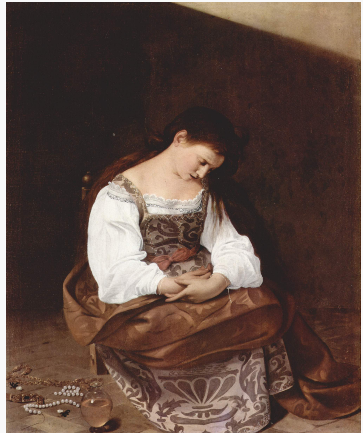
Caravage, Madeleine repentante , 1593-1594, huile sur toile, 122,5 x 98,5 cm, Rome, Galerie Doria-Pamphilj