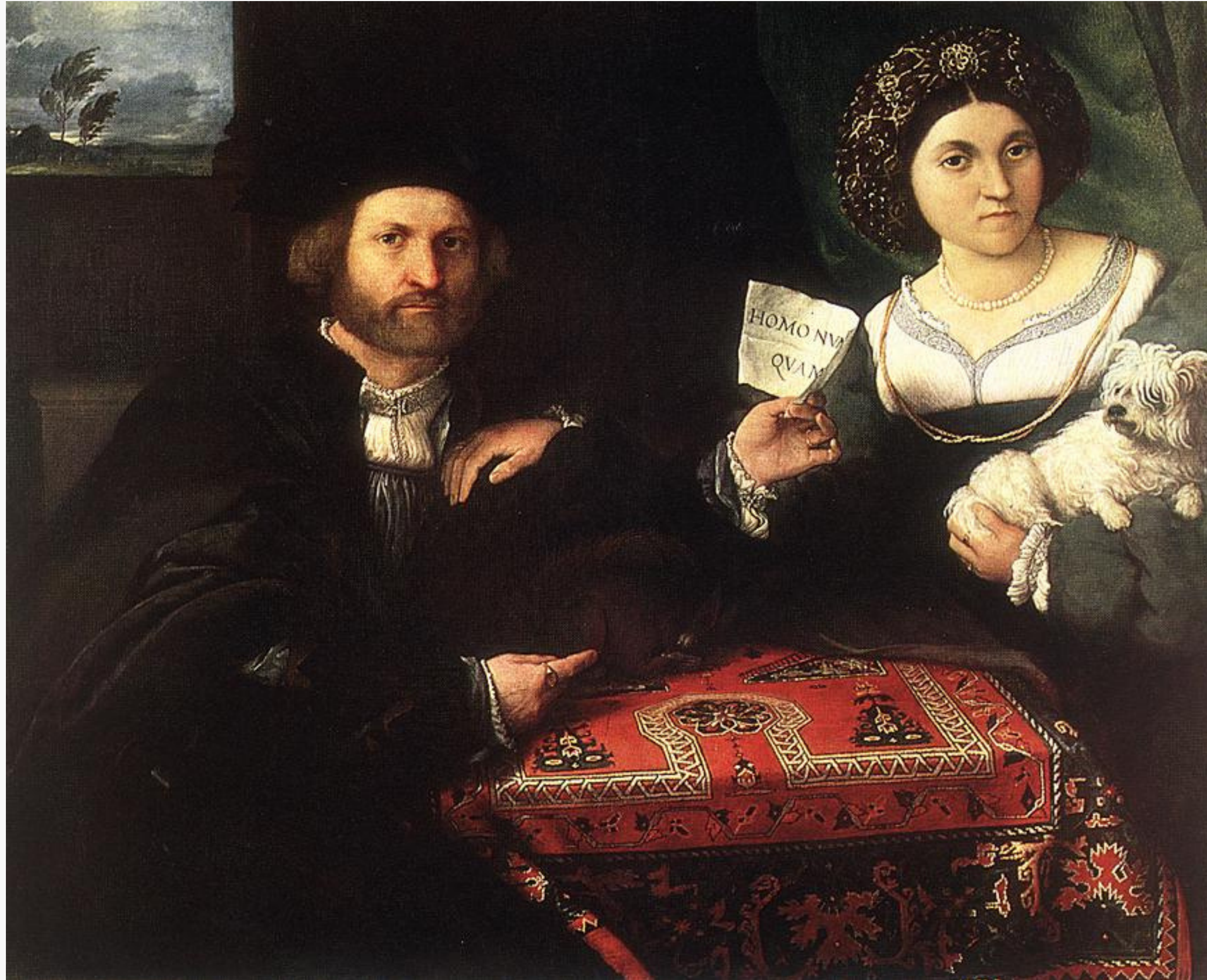
Lorenzo Lotto, Husband and Wife , 1523, huile sur toile, 98*118 cm, Saint-Pétersbourg, Musée de l'Ermitage