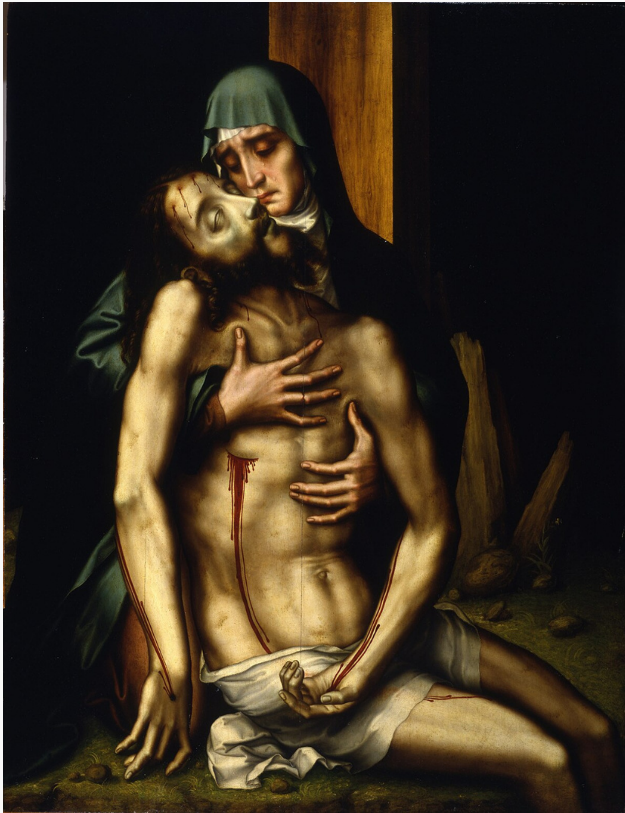
Luis de Morales, Pietà , XVIème siècle, huile sur panneau de bois, 126*98 cm, Madrid, Real Academia de Bellas Artes de San Fernando, Institut d'Espagne