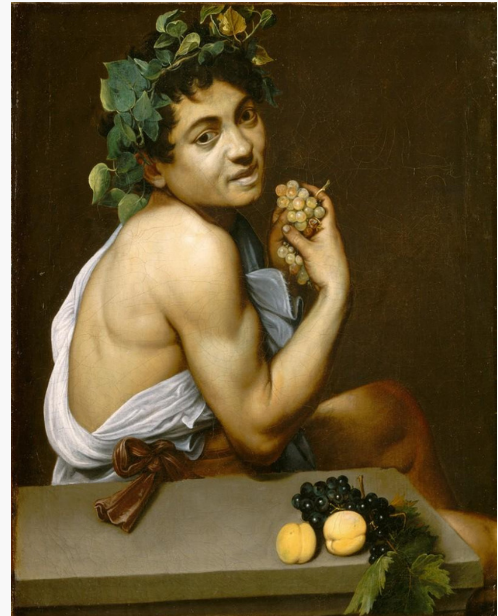
Michelangelo Merisi da Caravaggio. Self-Portrait as Bacchus. 1593-1594. Oil on canvas, 67 x 53 cm. Galleria Borghese, Rome, Italy.