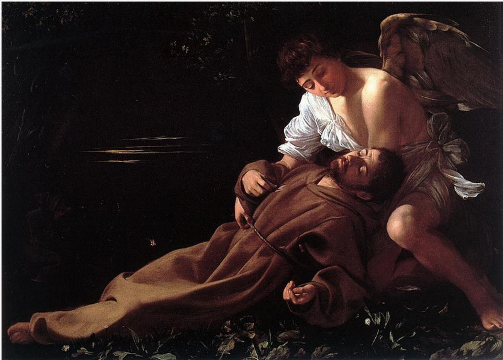
Caravage, L'Extase de saint François , 1597, huile sur toile, 92,5*128,4 cm, Hartford, Wadsworth Atheneum