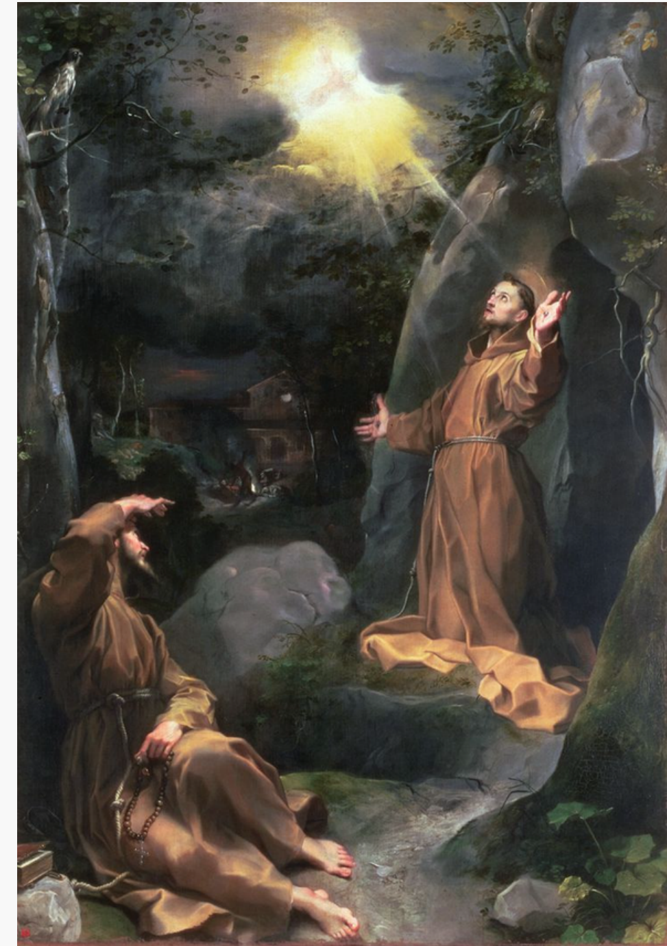
Caravaggio, L'Extase de saint François , 1597, huile sur toile, 92,51 x 28,4 cm, Hartford, Wadsworth Atheneum