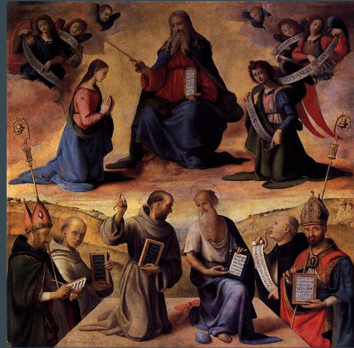
Piero di Cosimo, Immaculée Conception avec saints , 1480, huile sur panneau, 184 X 178cm, Fiesole, Couvent de Saint Francesco