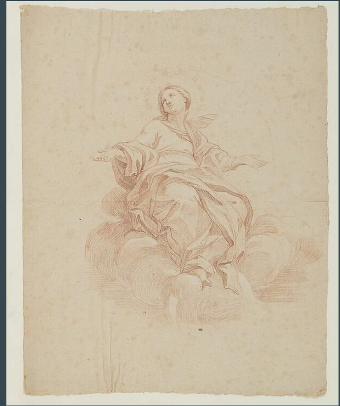
Edme Bouchardon, L'Immaculée Conception , vers 1723, sanguine et craie blanche, 51,4 X 40,3cm, Paris, Louvre