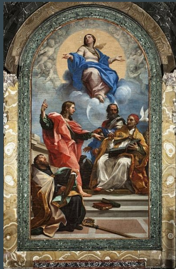
Carlo Maratta, La Vierge Immaculée avec quatre saints masculins, plume et encre brune, 45,6 X 25,7cm