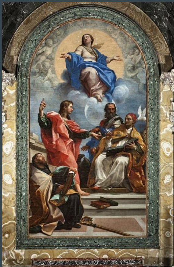
Carlo Maratta, Immaculée Conception, 1689, huile sur toile, 228 X 158cm, Rome, Santa Maria del Popolo