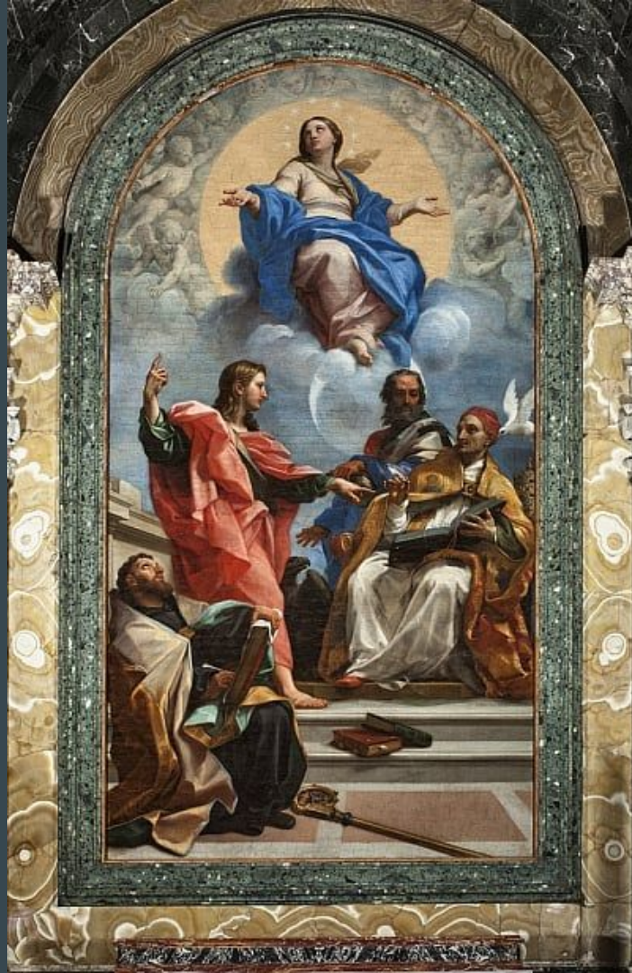
Carlo Maratta, Immaculée Conception, 1689, huile sur toile, 228 X 158cm, Rome, Santa Maria del Popolo