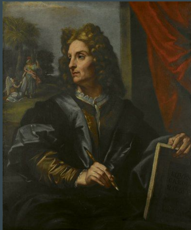
Carlo Maratta, Autoportrait , 1690, huile sur toile, 82,5 X 100 cm, Belgique, Royal Museum of Fine Arts