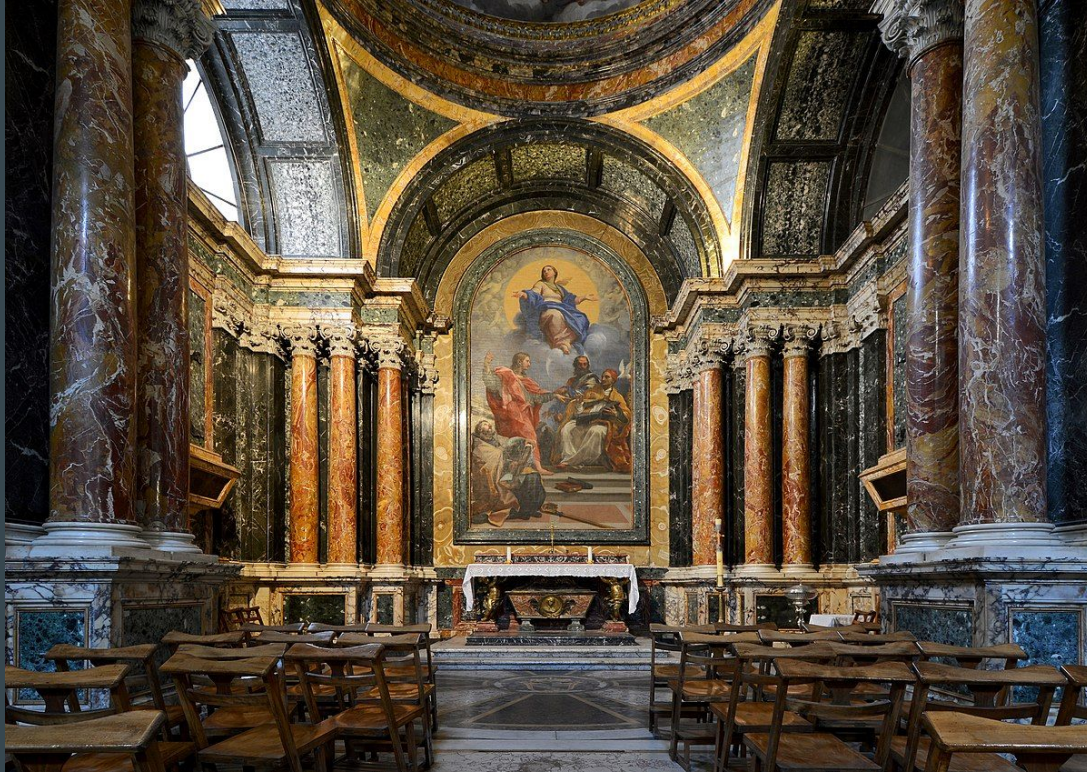
Vue de la Chapelle Cibo, Santa Maria del Popolo