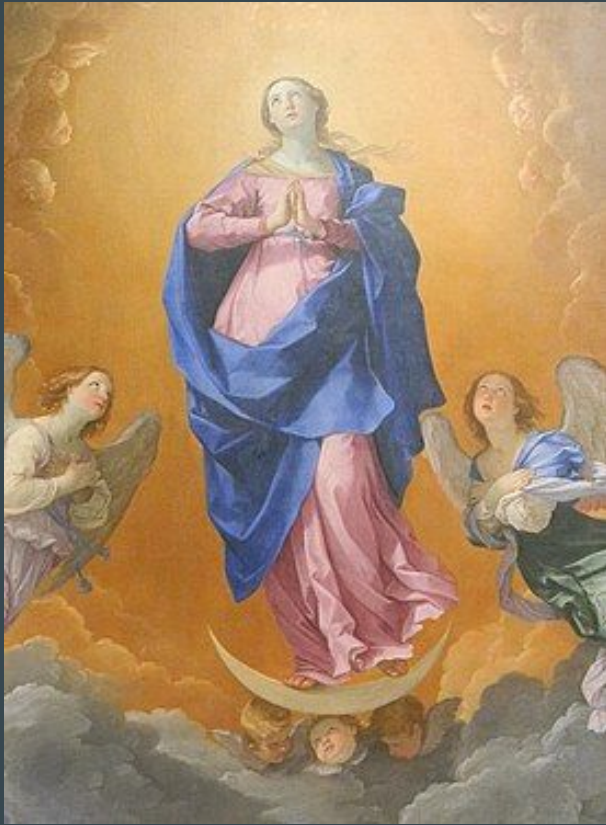
Guido Reni, L'Immaculée Conception , 1627, huile sur toile, 268 X 184,5cm, New York, Metropolitan Museum of Arts