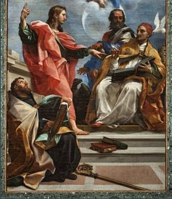
Le Greco, L'Immaculée Conception vue par Saint Jean l'évangéliste , vers 1580, huile sur toile, 236 X 115cm, Tolède, Musée Santa Cruz