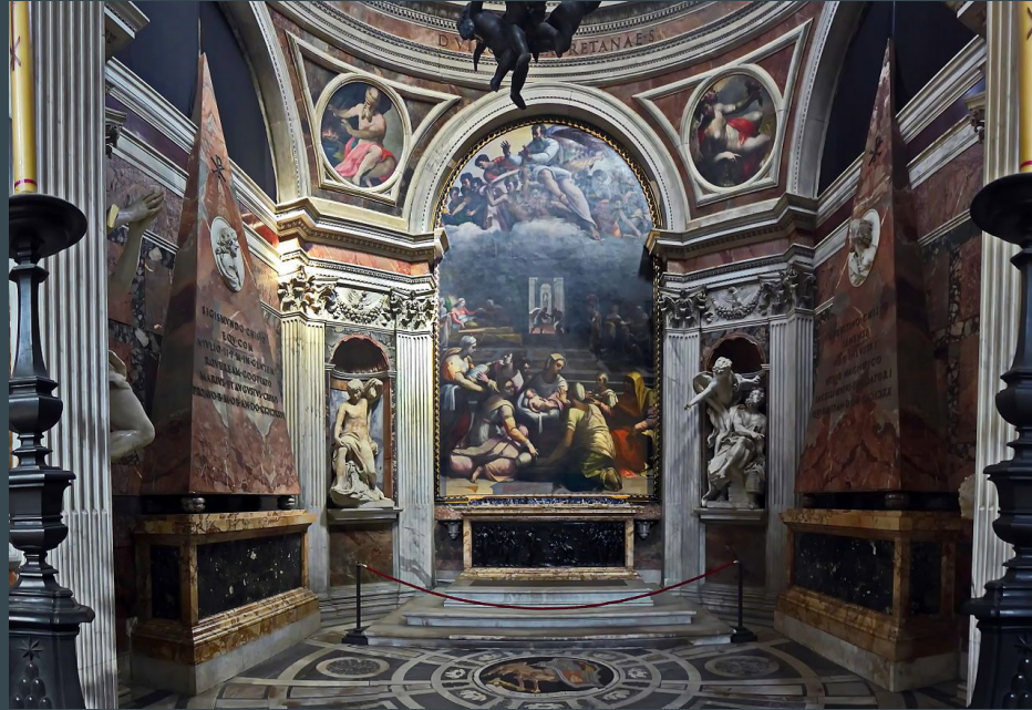
Vue de la Chapelle Chigi, Santa Maria del Popolo

Rappel : définition Baroque selon Panofsky ( Qu'est ce que le Baroque , 1935)