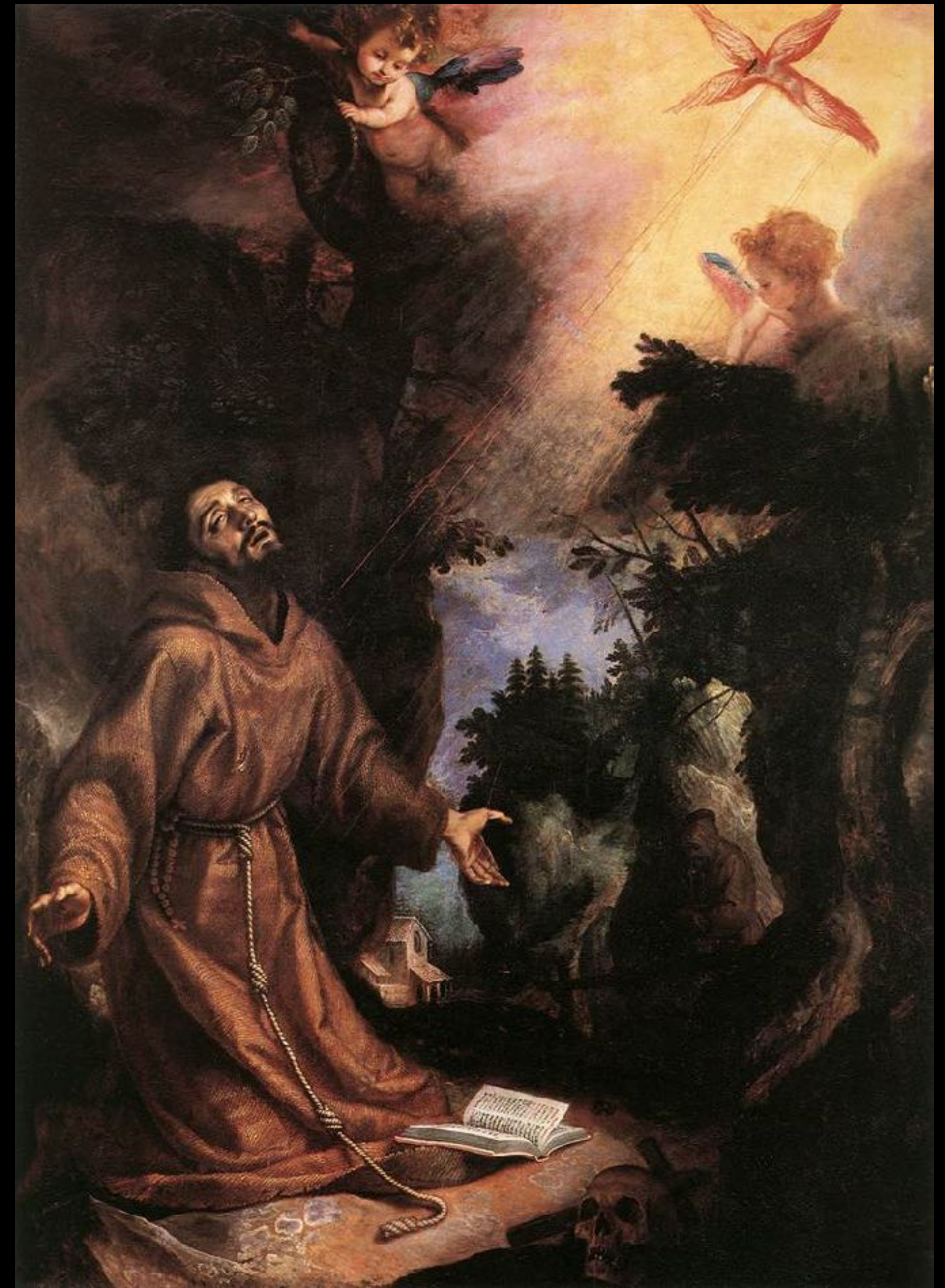
Cigoli, Stigmatisation de François , 1596, huile sur bois, 247 × 171 cm, Florence, Gallerie degli Uffizi