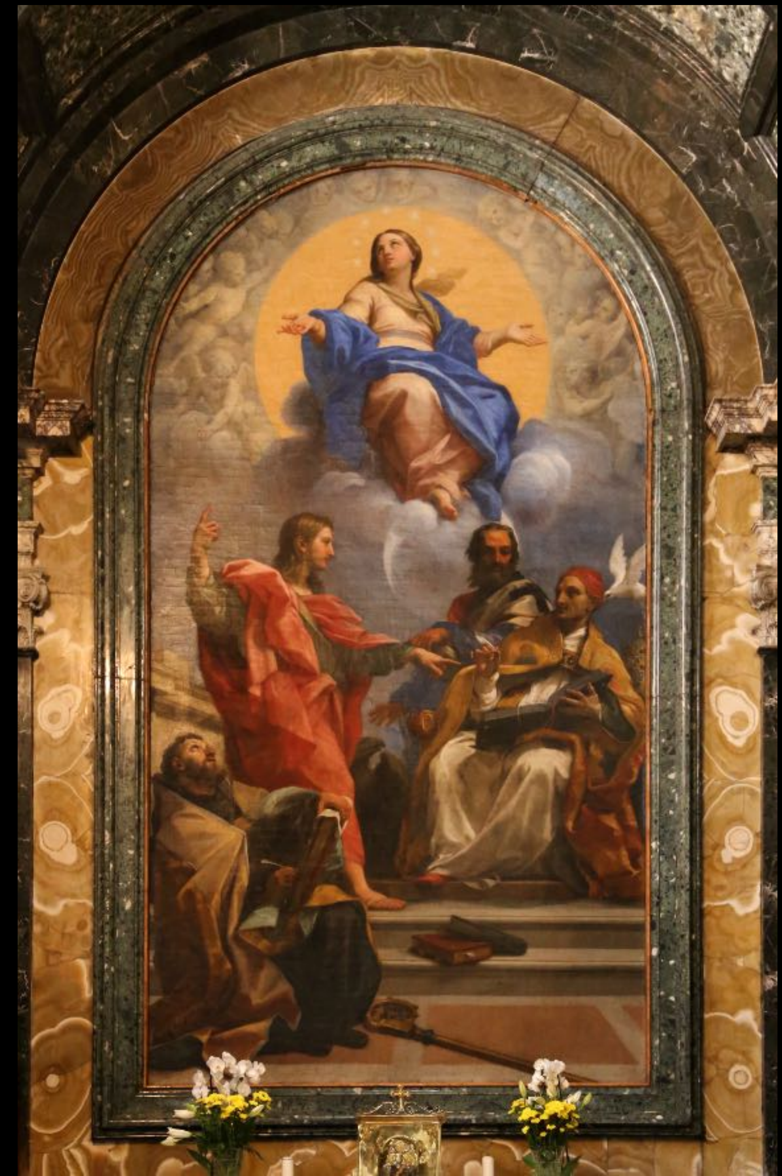
Carlo Maratta, Immaculée Conception , 1686, huile sur toile, 228 × 158 cm, Rome, Santa Maria del Popolo