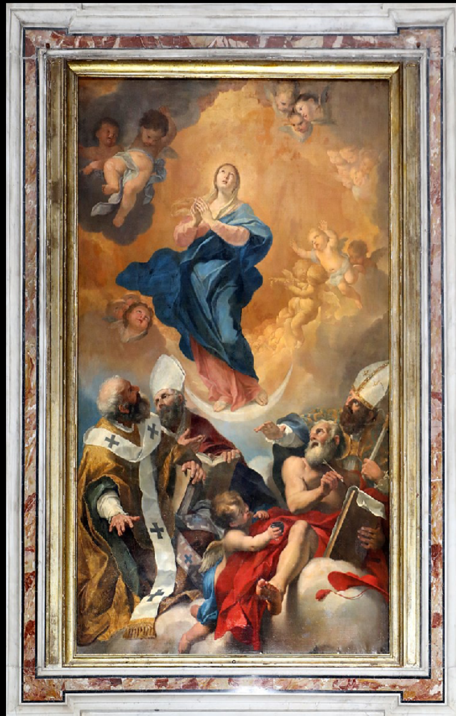
Carlo Maratta, Immaculée Conception , 1684, huile sur toile, s. d., Massa, Duomo