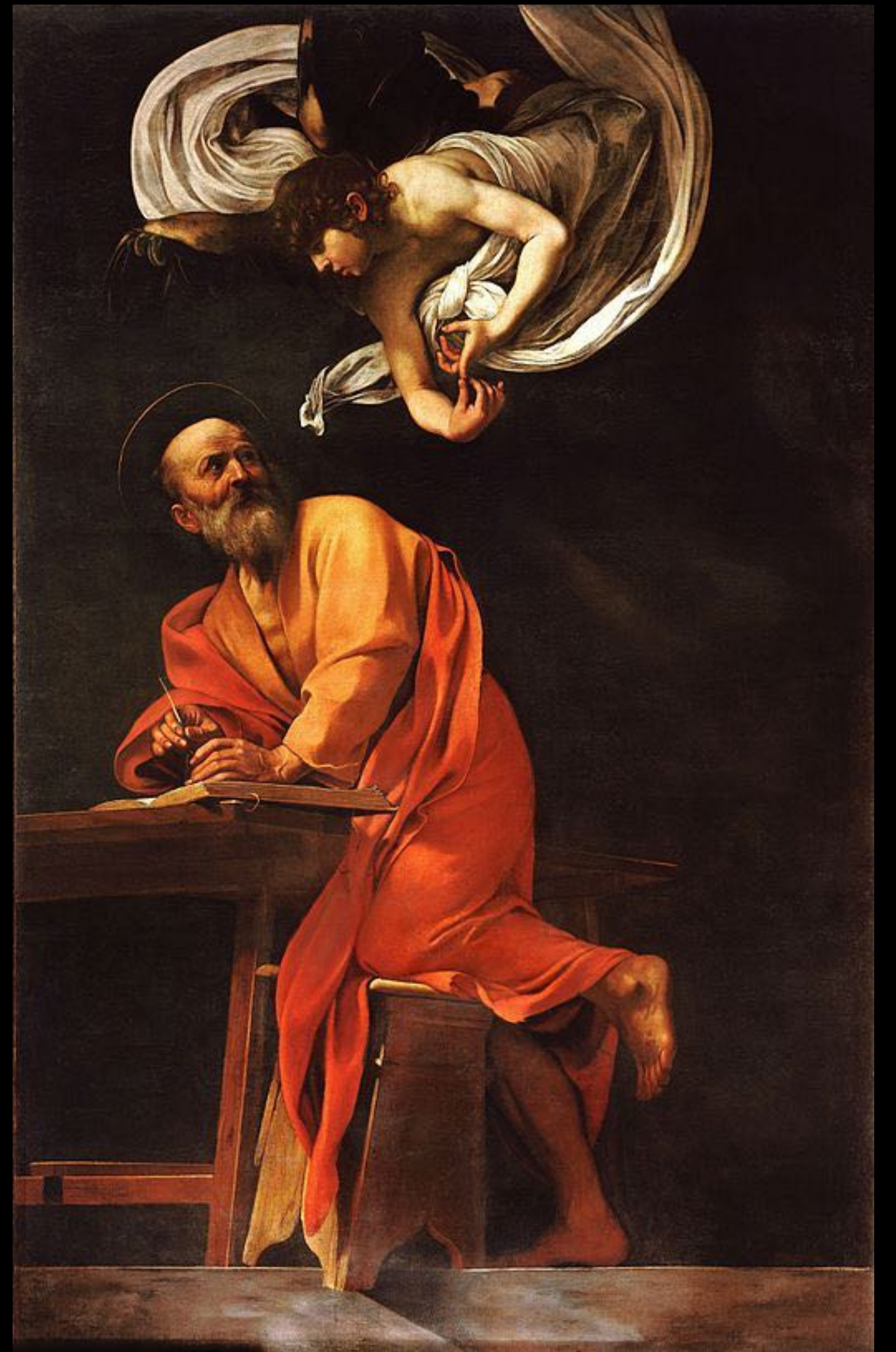
Caravaggio, Matthieu et l'ange , 1602, huile sur toile, 295 × 195 cm, Rome, San Luigi dei Francesi