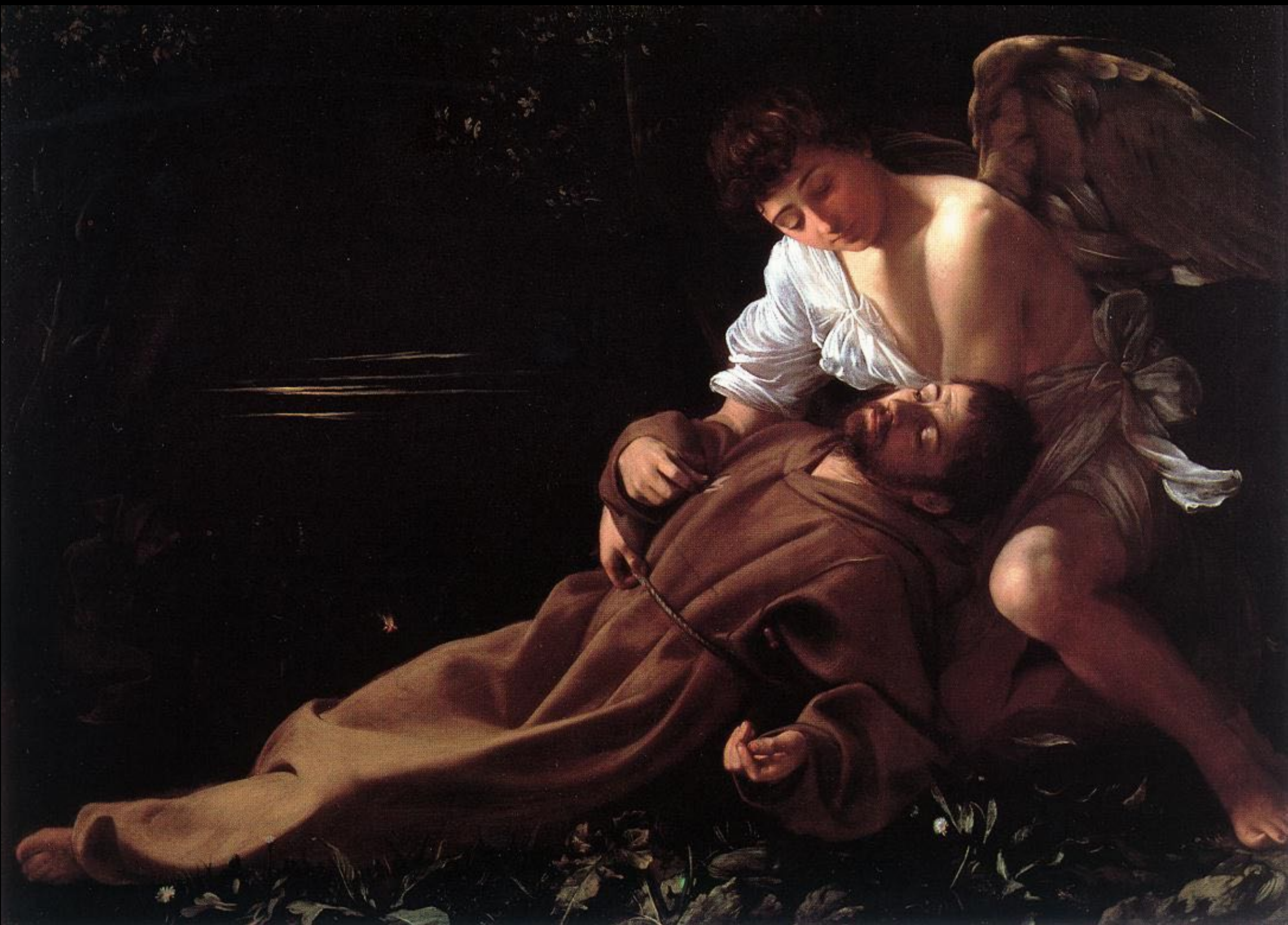
Caravage, Extase de François , 1597, huile sur toile, 92,5 × 128,4 cm, Hartford, Wadsworth Atheneum