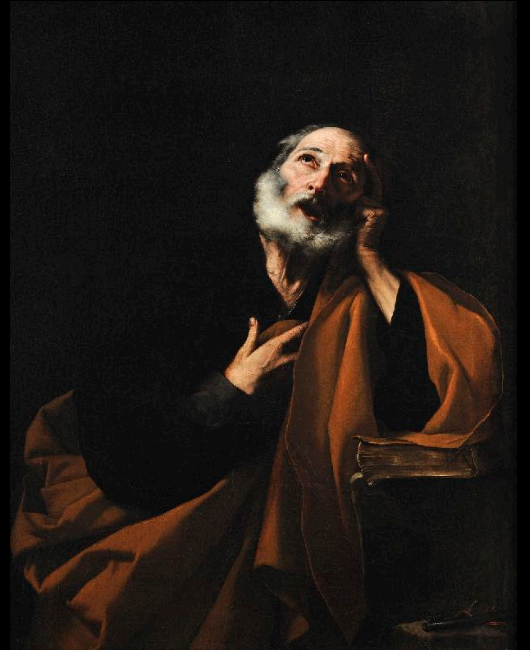
Jusepe de Ribera, Pierre , XVII e siècle, huile sur toile, s. d., Lyon, musée des Beaux-Arts