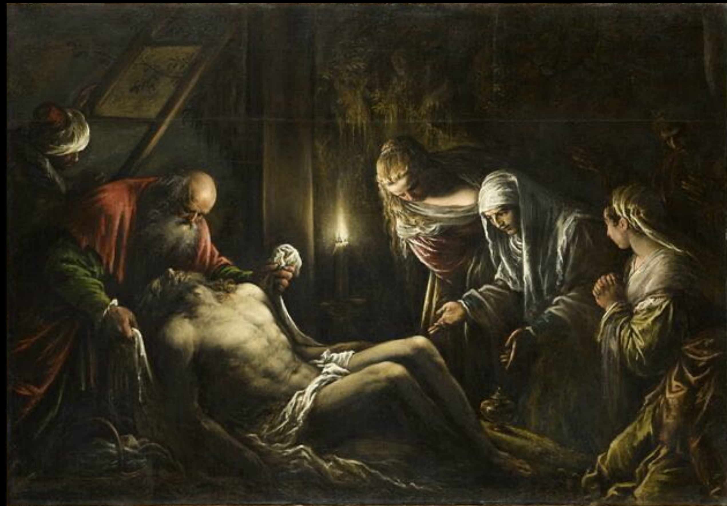
Cercle de Jacopo Bassano, Déposition , 1575-1577, huile sur toile, 154 × 225 cm, Paris, musée du Louvre