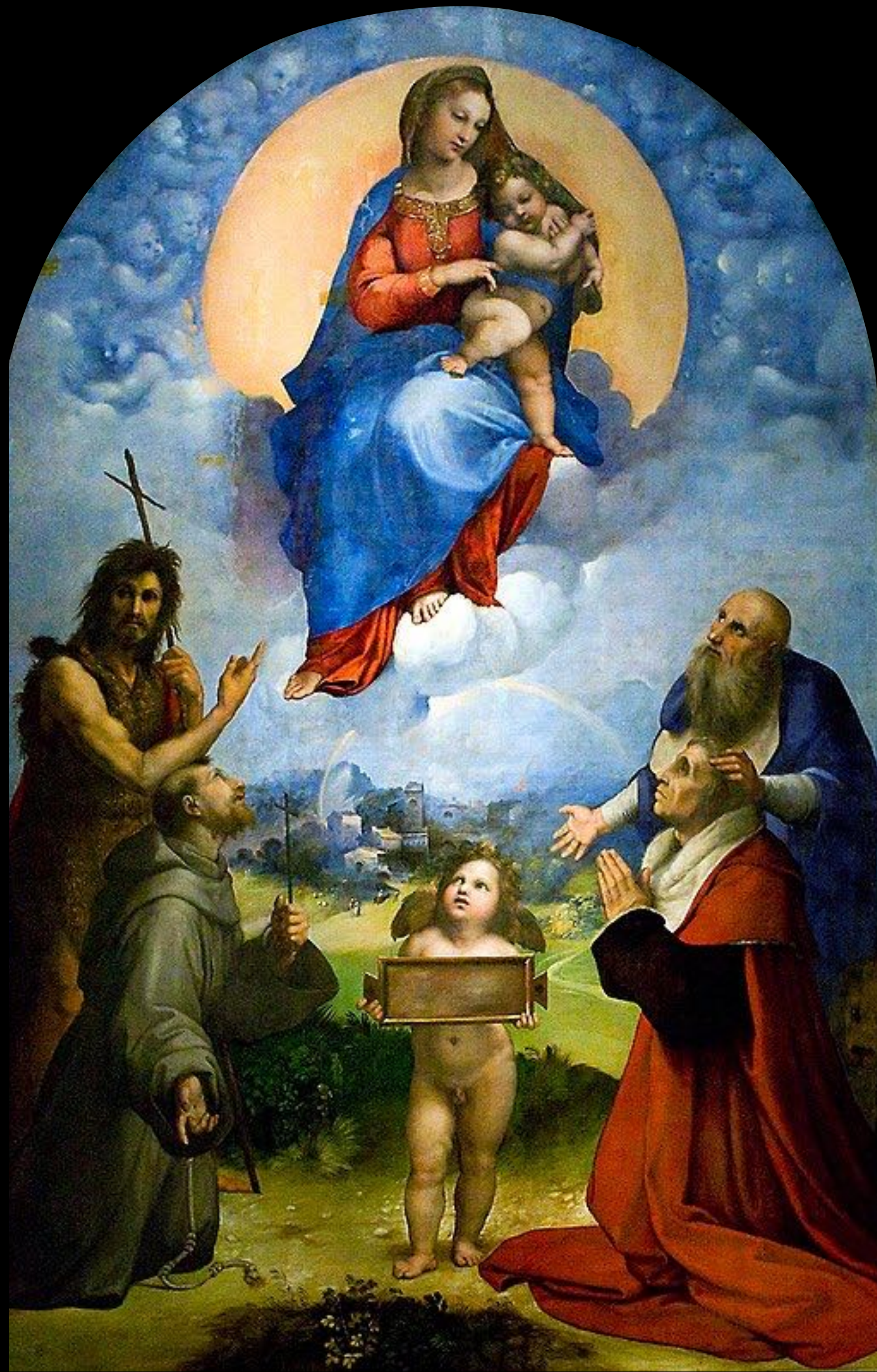
Raphaël, Madone de Foligno , 1513-1514, huile sur toile, 308 × 198 cm, Vatican, Musei Vaticani