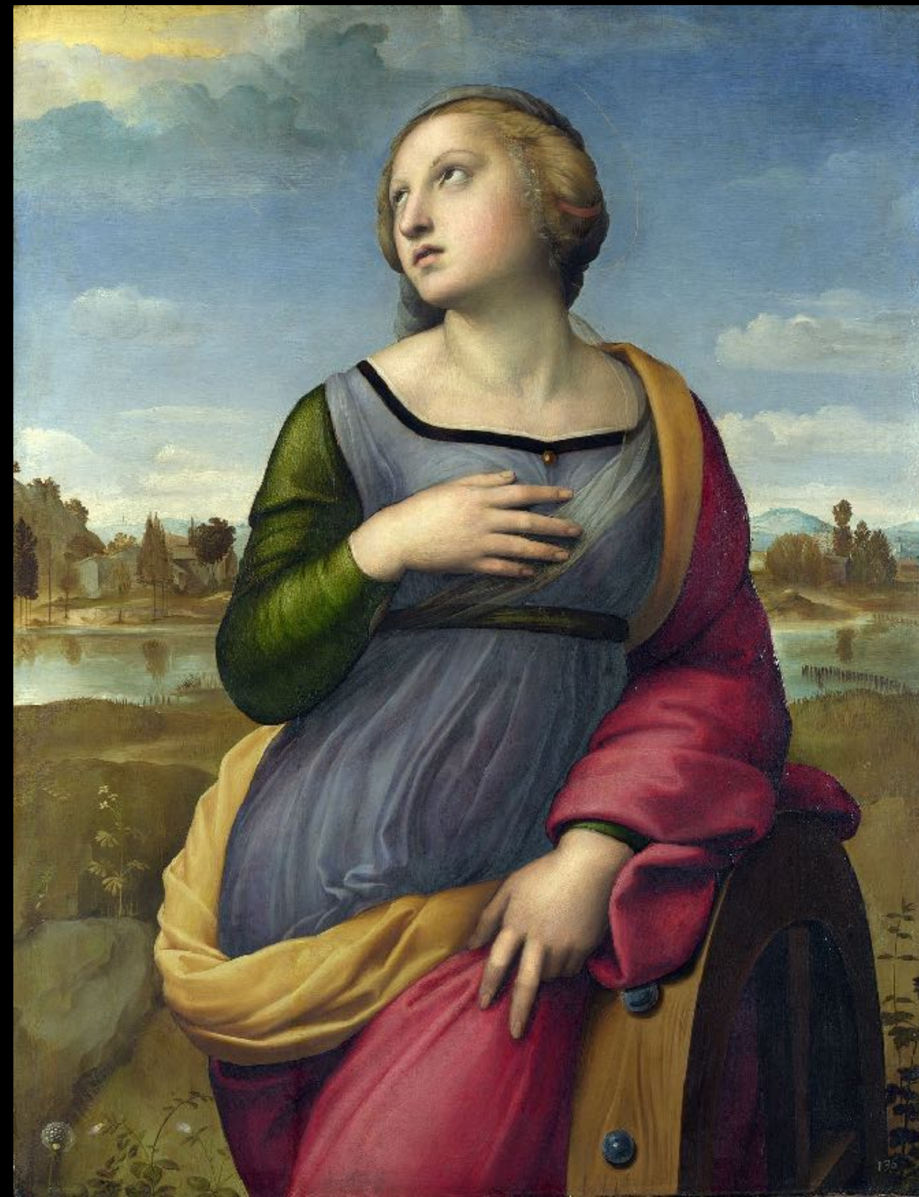
Raphaël, Catherine d'Alexandrie , 1507-1509, huile sur bois, 71 × 55 cm, Londres, National Gallery