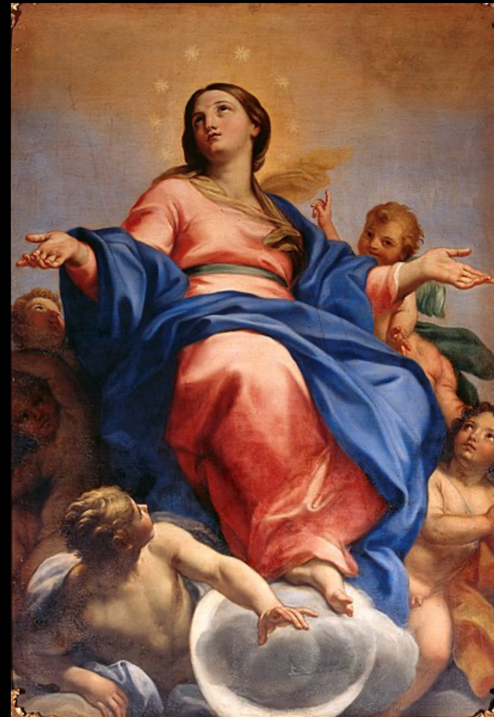
Carlo Maratta, Immaculée Conception , 1685-1688, huile sur toile, 181,5 × 128 cm, Potsdam, Sanssouci Picture Gallery