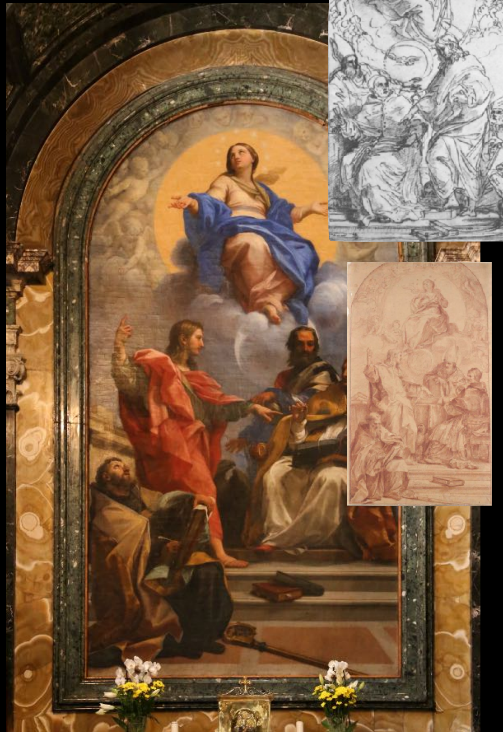
Carlo Maratta, Immaculée Conception , 1686, huile sur toile, 228 × 158 cm, Rome, Santa Maria del Popolo