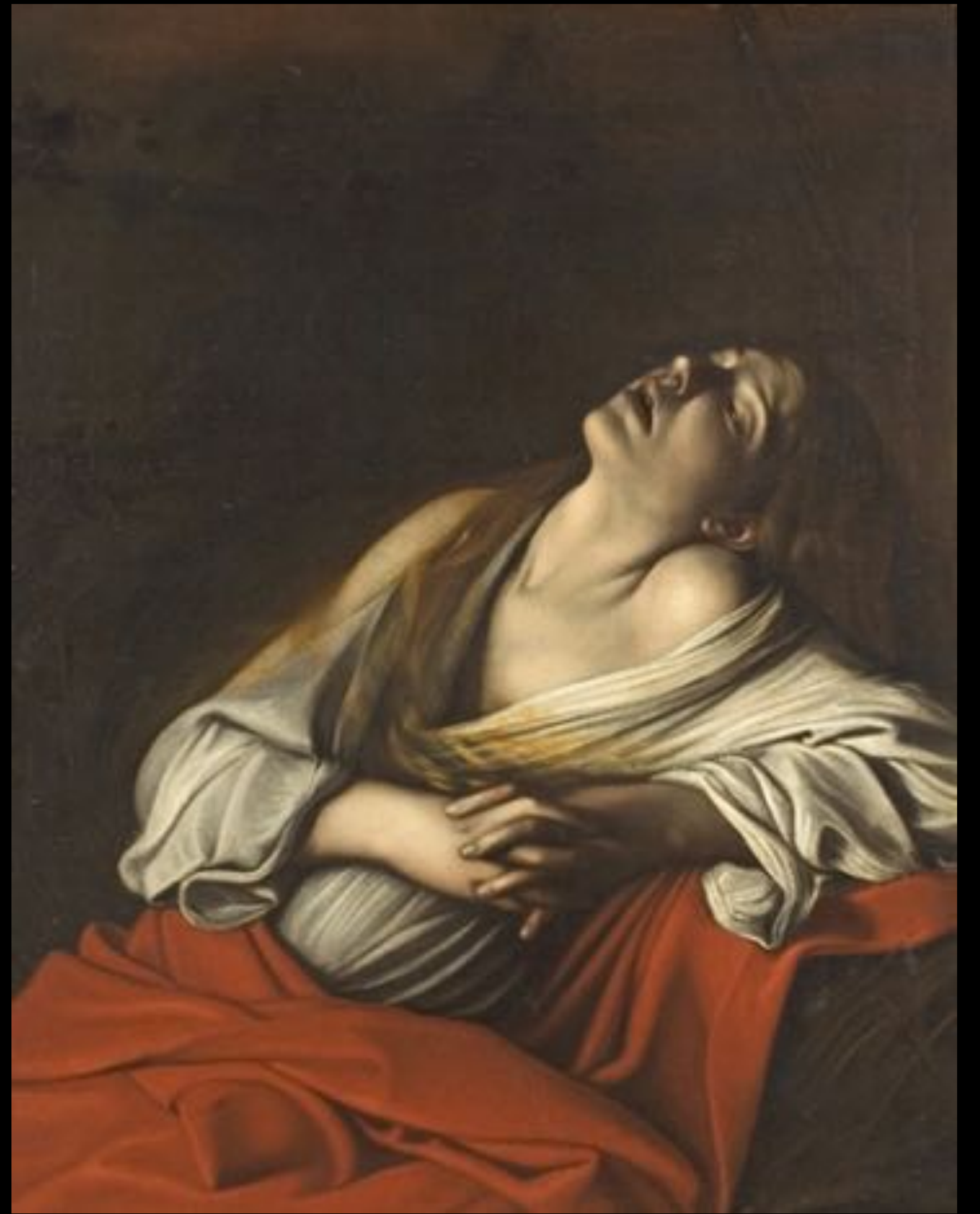
Caravage, Extase de Marie-Madeleine , 1606, huile sur toile, 106 × 91 cm, Rome, collection privée