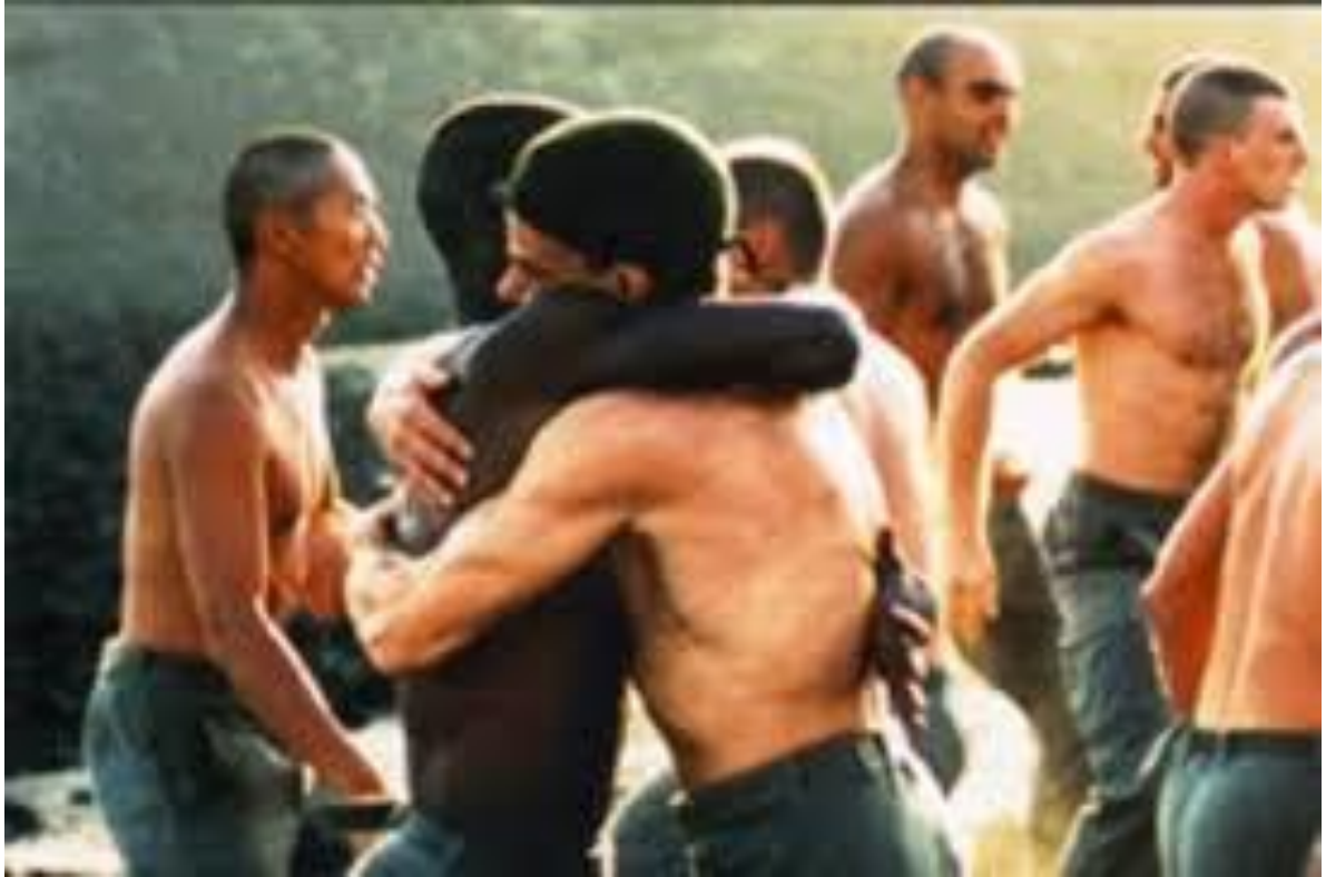
Claire Denis, Beau travail , France, 2000