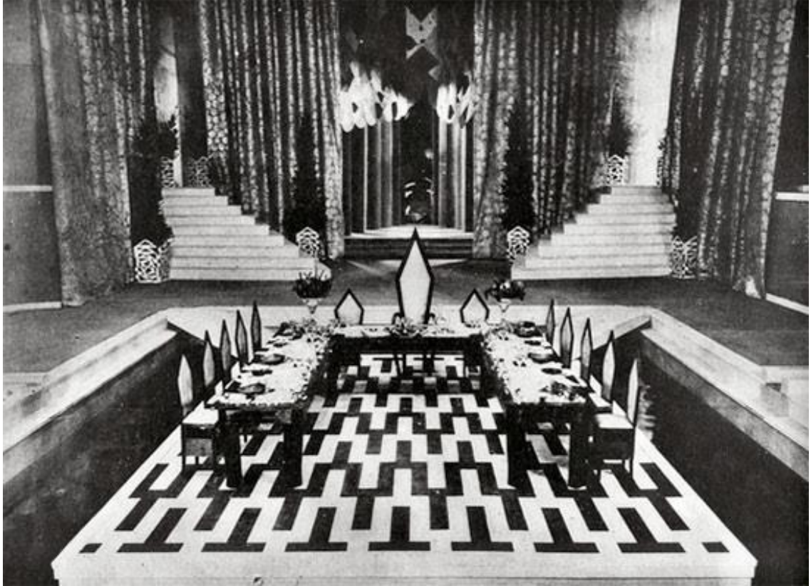
Marcel L'Herbier, L'inhumaine , France, 1924