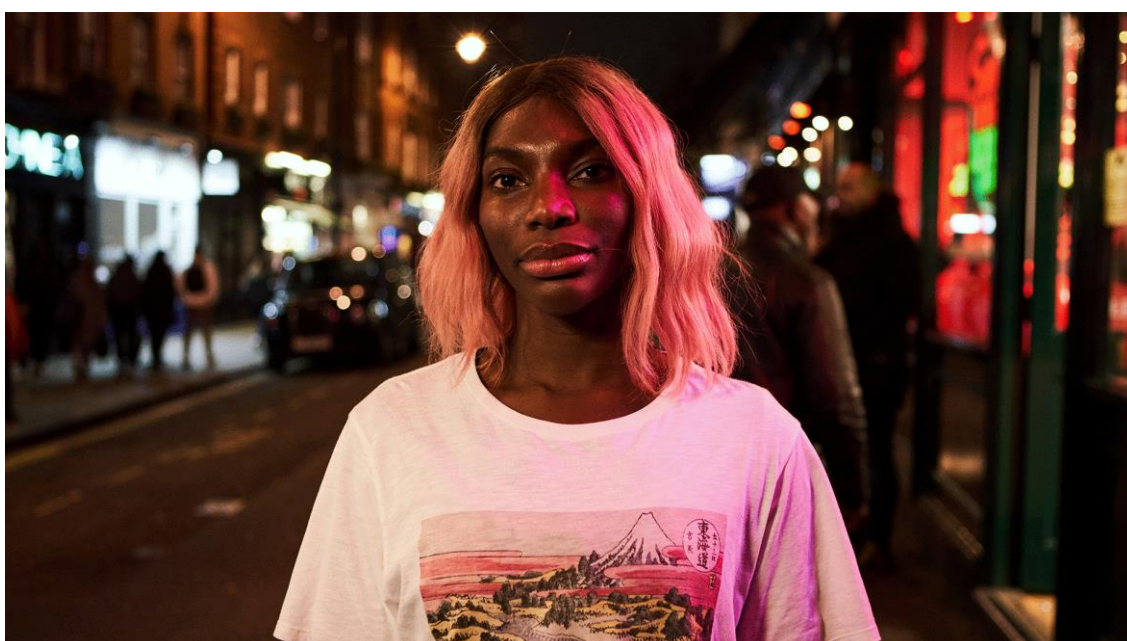
Michaela Coel, I may destroy you