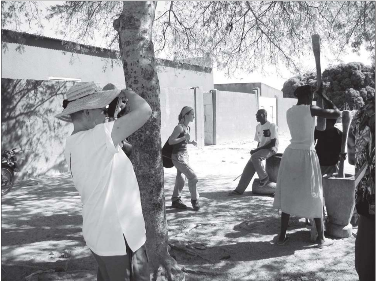
DES TOURISTES « IMMERGÉS » dans un village du Burkina Faso.