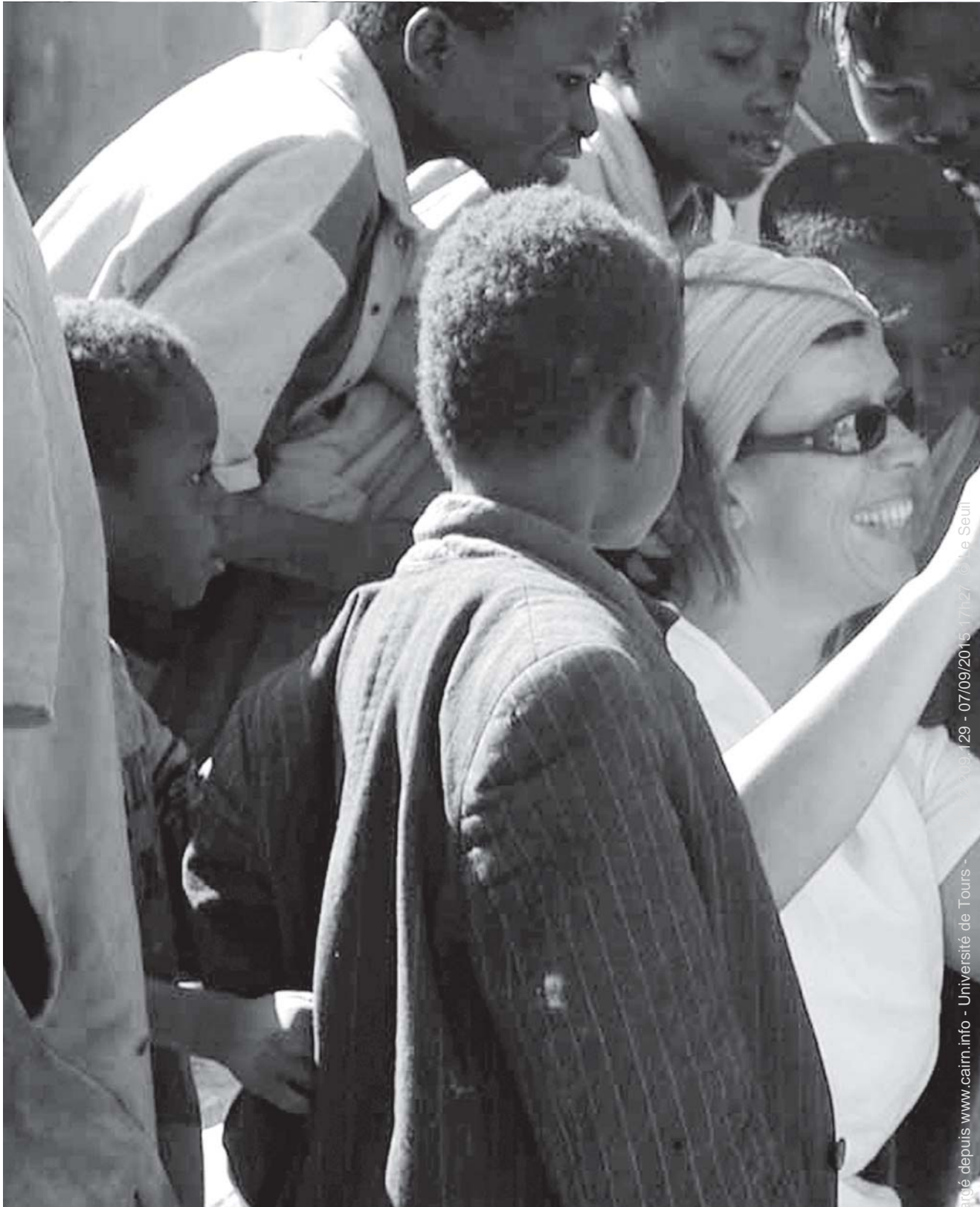
AMUSEMENT DES ENFANTS devant leurs images.