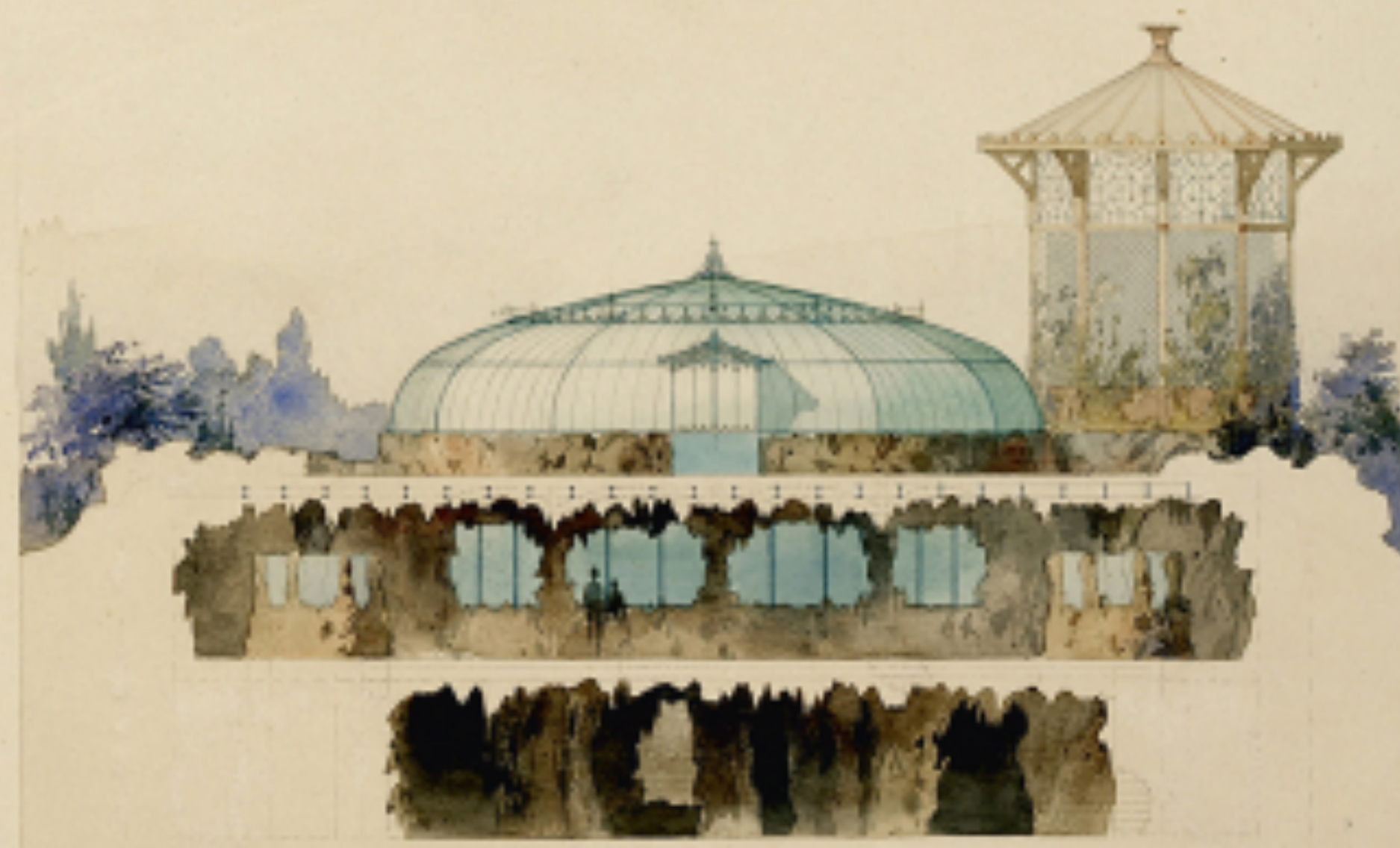
Coupe sur la gable d'entrée du côté de la serre