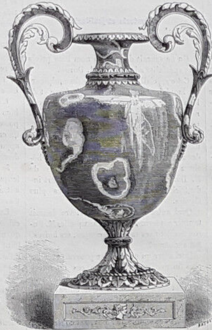
VASE DE M. DURON. (Médaille d'or.) — Dessin de M. de Katow.

qu'elle a résisté aux mauvais restaurants, aux procès renaissants, aux chaises enlevées, aux programmes non remplis, aux défenses pécuniaires, aux réglementations agaçantes, aux mécontentements absurdes, aux critiques passionnées, aux tourniquets et aux péages supplémentaires. — c'est que l'Exposition universelle est vraiment un spectacle sans pareil, d'un attrait irrésistible, un sujet d'étude ou de curiosité au-dessus de toutes les atteintes.