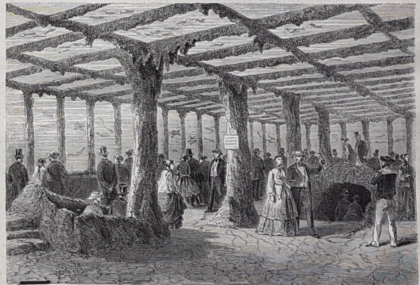
AQUARIUM D'EAU DE MER. — Dessin de M. Gaidrau.

Poterie (1 grav.), par M. E. de la Bédollière. — VI. Par fumerie (1 grav.), par M. V. Cosso. — VII. Bijouterie et joaillerie: M. Duron (1 grav.), par M. Chirac. — VIII. Chronique, par M. Fr. Ducing. — 14 gravures