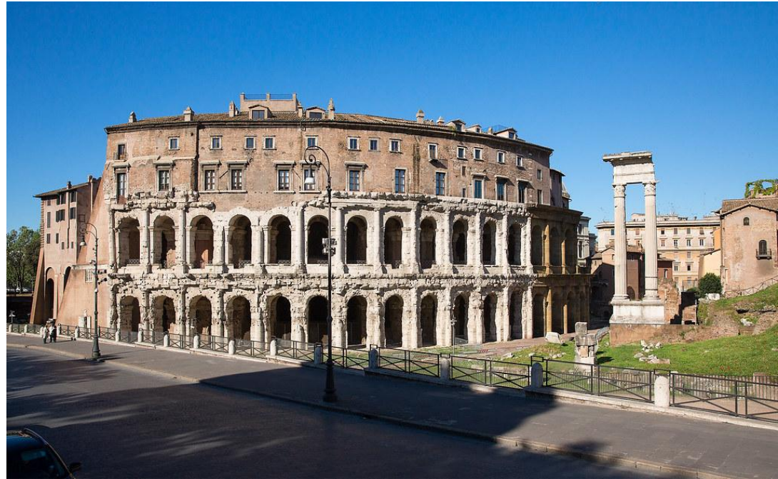
Rome, théâtre de Marcellus, I ère s. av. J-C