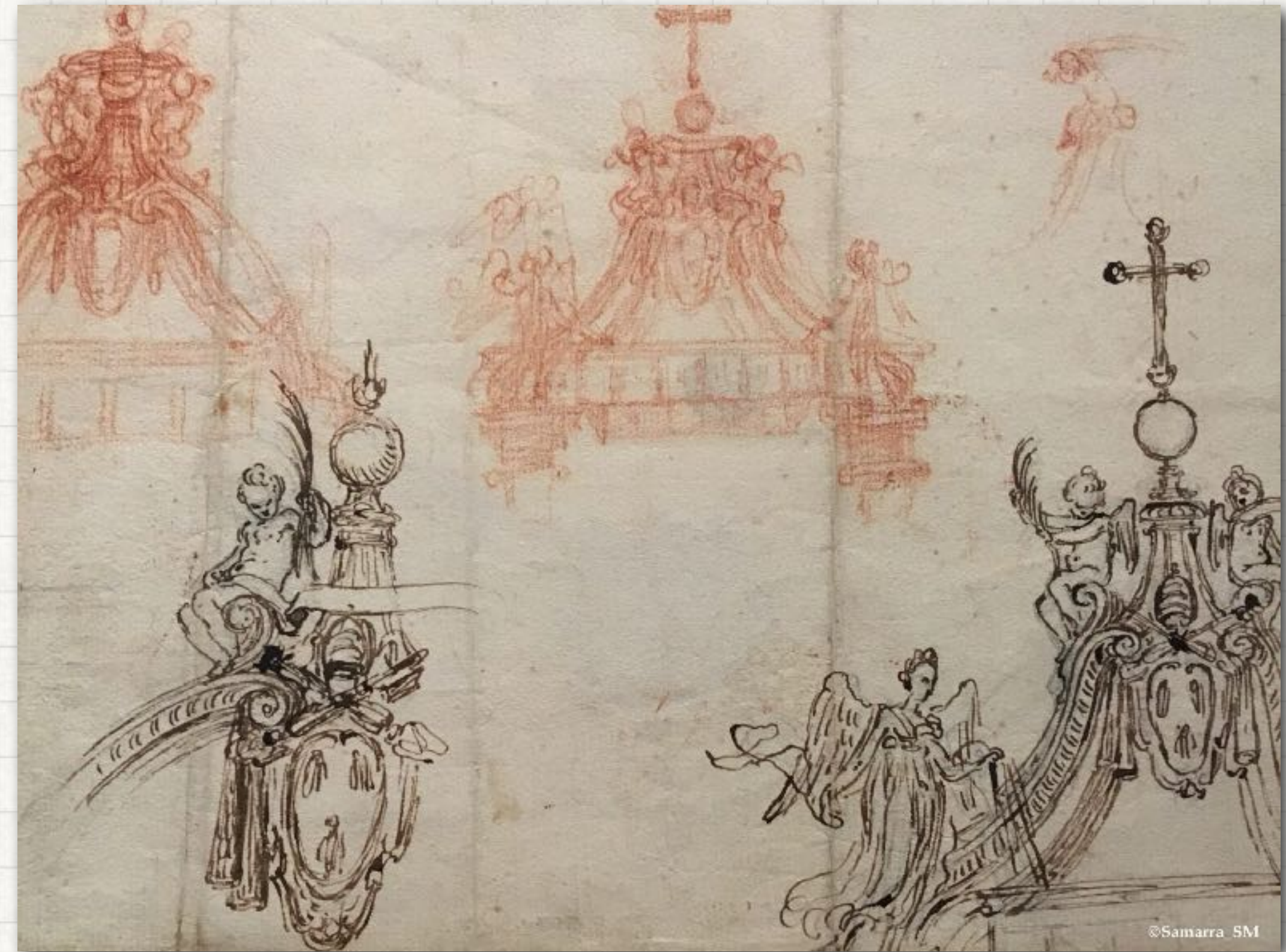
Bernin, étude pour le couronnement du baldaquin de st Pierre, 1631, Trésors de l'Albertina, cité de l'architecture, Paris