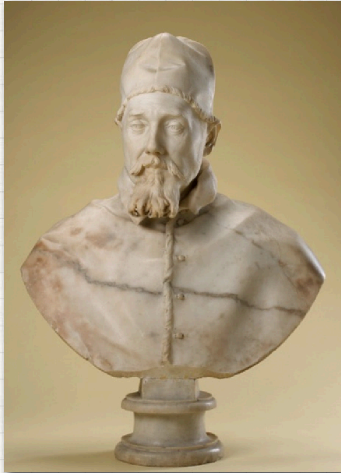
Le Bernin, Urbain VIII , 1632, Marbre, 95 cm, National Gallery, Ottawa