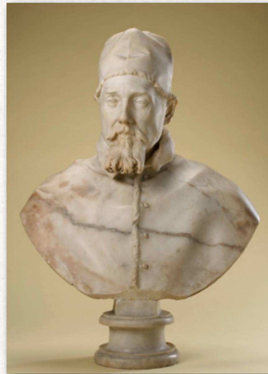
Le Bernin, Urbain VIII , 1632, Marbre, 95 cm, National Gallery, Ottawa