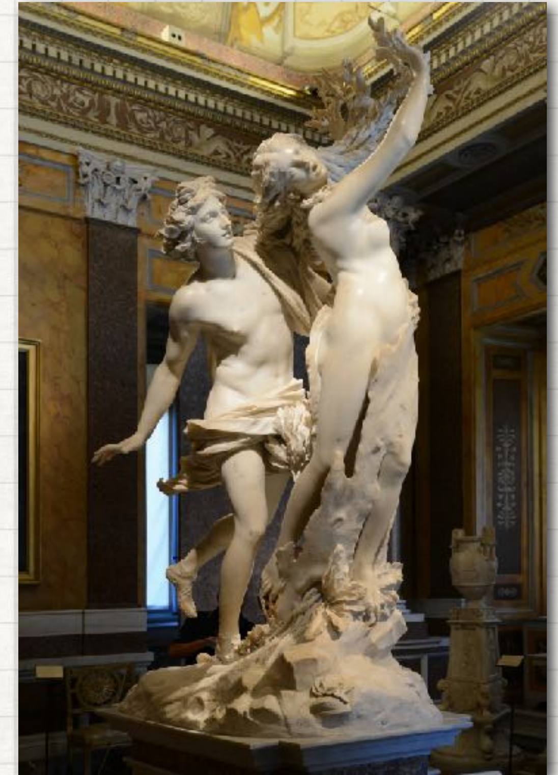
Bernini, Apollon et Daphné , 1622-1625, marbre, 243cm, Gallerie Borghese, Rome