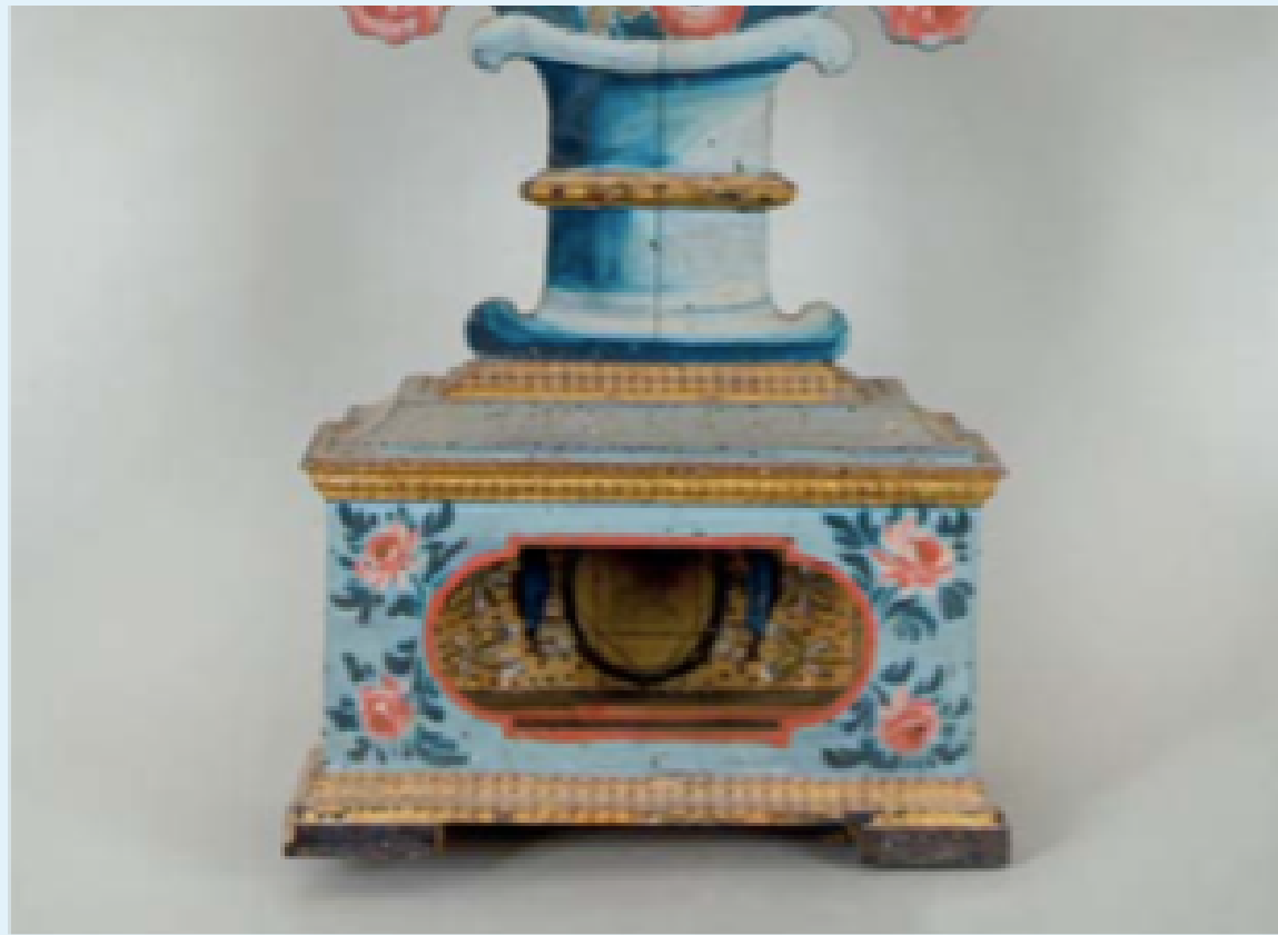
Atelier tridentin, Monstrance-reliquaire, fin du XVIIe siècle, Reliques des saints César martyr et Christine martyre, bois peint et doré, fil d'argent, fil d'or, paillettes, 86 × 31 × 16 cm ; cinq Agnus Dei bénis par Innocent X (1644-1655) et Innocent XI (1676-1689), cire. Balbido, Santa Giustina.