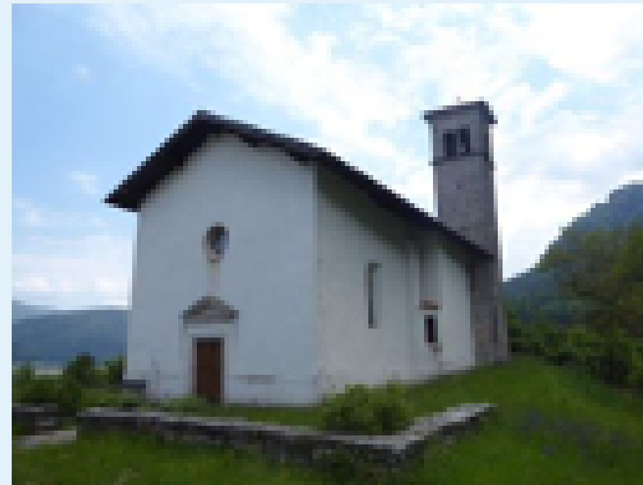
Eglise Santa Giustina

Décret sur l'Eucharistie de 1551 du Concile de Trente :