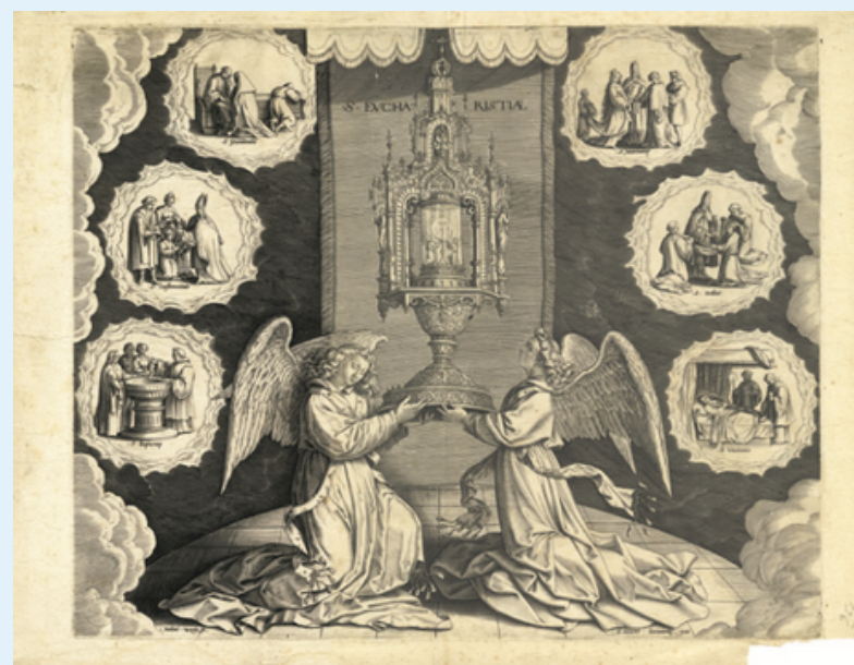
Anton II WieRix, L'Eucharistie. Fin du XVIe- début du XVIIe siècle. Liège, Trésor de la cathédrale. "Genèse et usages de la monstrance eucharistique entre Moyen âge et Temps modernes (XIIIe-XVIIe s.) : Un joyau d'or de maçonnerie au milieu i y a un cristal rond pour mettre Corpus Christi", L'orfèvrerie liturgique, CIPAR, Namur, 2019, p. 22-30.