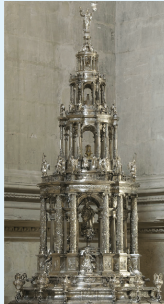
Monstrance (custodia de asiento). Vers 1579-1587. Séville, Trésor de la cathédrale.

"Genèse et usages de la monstrance eucharistique entre Moyen âge et Temps modernes (XIIIe-XVIIe s.) : Un joyeau d'or de maçonnerie au milieu i y a un cristal rond pour mettre Corpus Christi", L'orfèvrerie liturgique, CIPAR, Namur, 2019, p. 22-30.