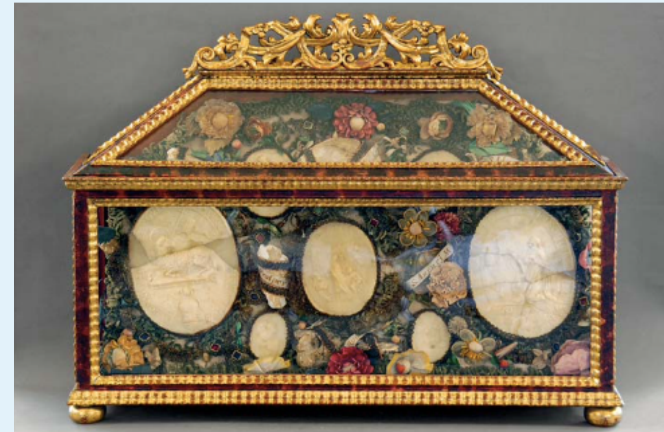
Atelier tridentin, Reliquaire à urne, Reliques des saints Prosper, Augurius et Innocente, 1729-1750, bois doré, fil d'or, verre coloré, 39 × 57 × 16 cm ; Agnus Dei bénis par Innocent XI (1677) et par Benoît XIII (1725 et 1729), cire. Mezzocorona, Santa Maria Assunta.