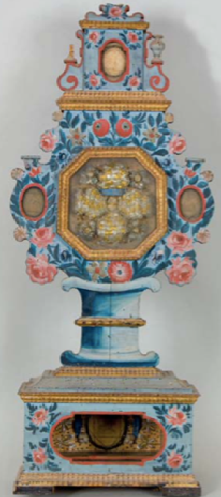
Atelier tridentin, Monstrance-reliquaire, fin du XVIIe siècle, Reliques des saints César martyr et Christine martyre, bois peint et doré, fil d'argent, fil d'or, paillettes, 86 × 31 × 16 cm ; cinq Agnus Dei bénis par Innocent X (1644-1655) et Innocent XI (1676-1689), cire. Balbido, Santa Giustina.