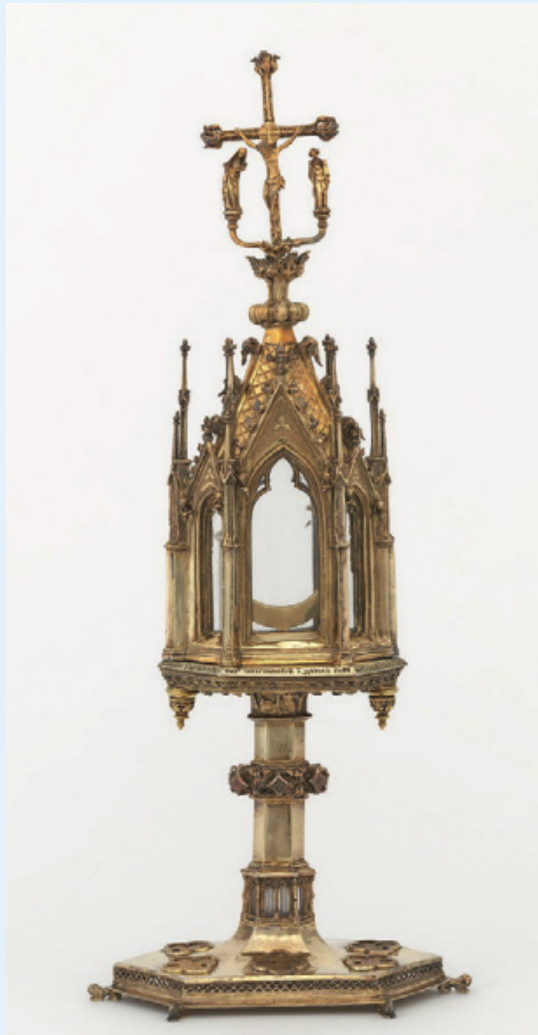
Monstrance eucharistique, abbaye cistercienne d'Herenrode. 1286. Hasselt, musée Het Stadsmus.

"Genèse et usages de la monstrance eucharistique entre Moyen âge et Temps modernes (XIIIe-XVIIe s.) : Un joyeau d'or de maçonnerie au milieu i y a un cristal rond pour mettre Corpus Christi", L'orfèvrerie liturgique, CIPAR, Namur, 2019, p. 22-30.