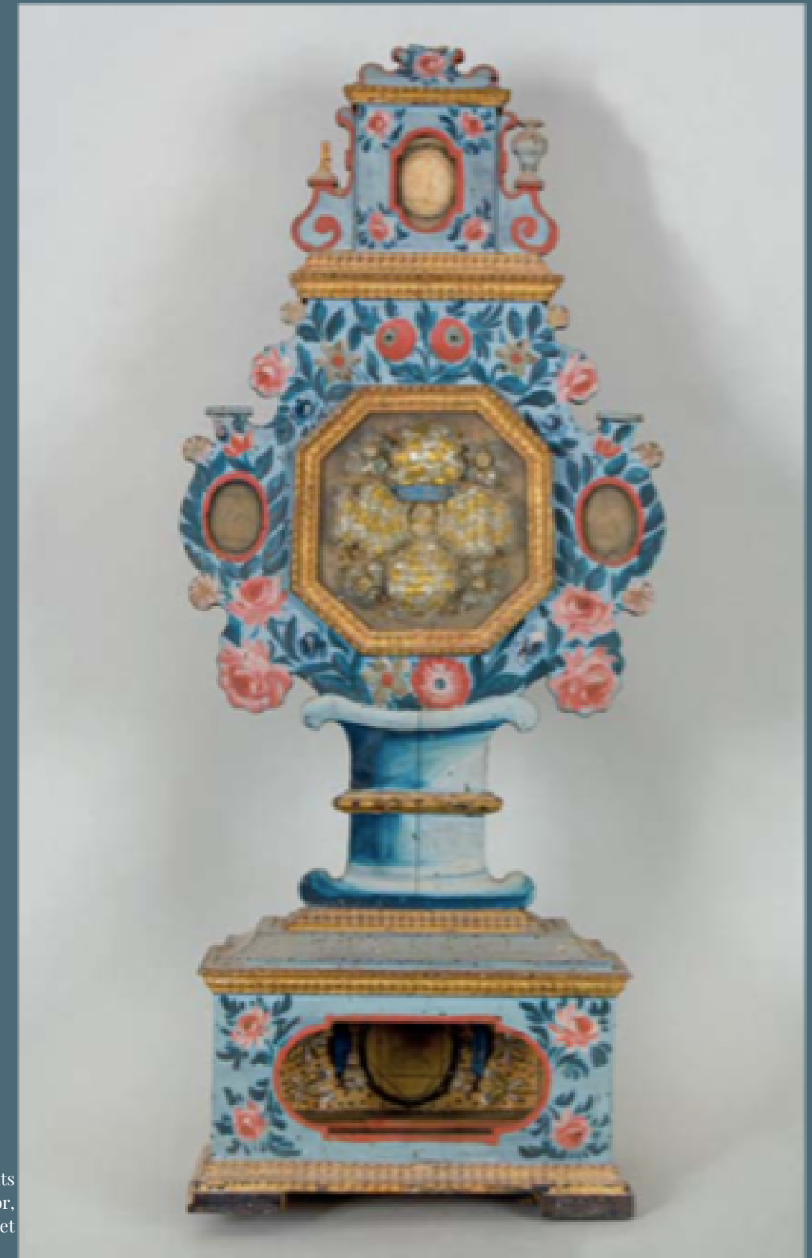
Atelier tridentin, Monstrance-reliquaire, fin du XVIIe siècle, Reliques des saints César martyr et Christine martyre, bois peint et doré, fil d'argent, fil d'or, paillettes, 86 × 31 × 16 cm ; cinq Agnus Dei bénis par Innocent X (1644-1655) et Innocent XI (1676-1689), cire. Balbido, Santa Giustina.