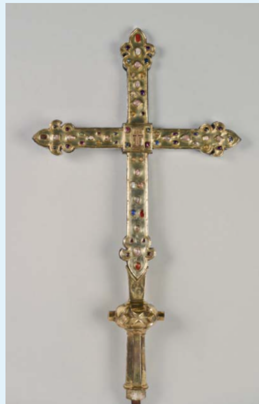
Croix-reliquaire processionnelle, fin du XVe siècle. Verdun, trésor de la cathédrale. Dans Genèse et usages de la monstre eucharistique entre Moyen âge et Temps modernes (XIIIe-XVIIe s.) : Un joyau d'or de maçonnerie au milieu i y a un cristal rond pour mettre Corpus Christi , L'orfèvrerie liturgique, CIPAR, Namur, 2019, p. 22-30.