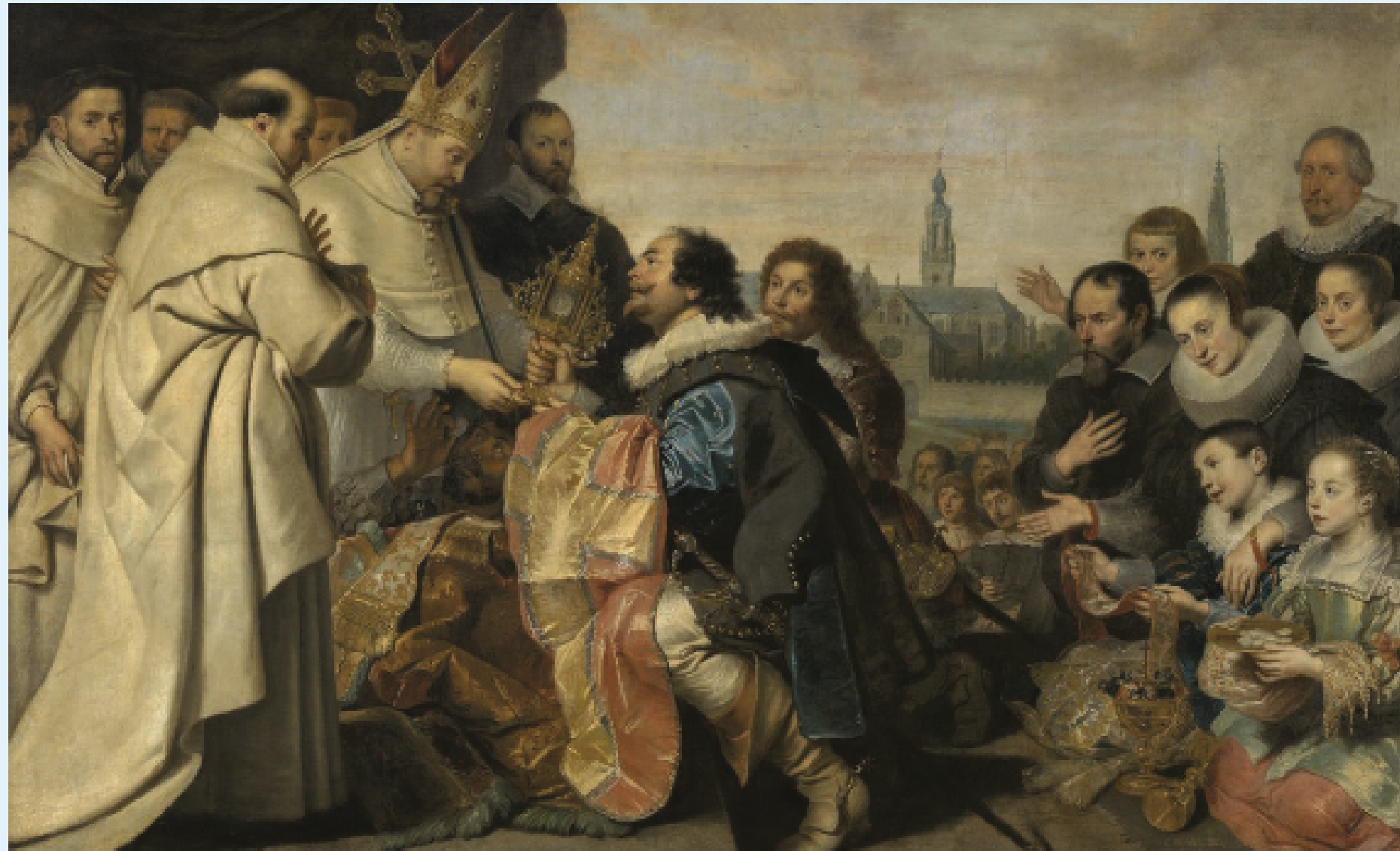
Cornelis De Vos, Les citoyens d'Anvers rapportant à saint Norbert la monstrance et les habits liturgiques. 1630. Anvers, Musée royal des Beaux-Arts.