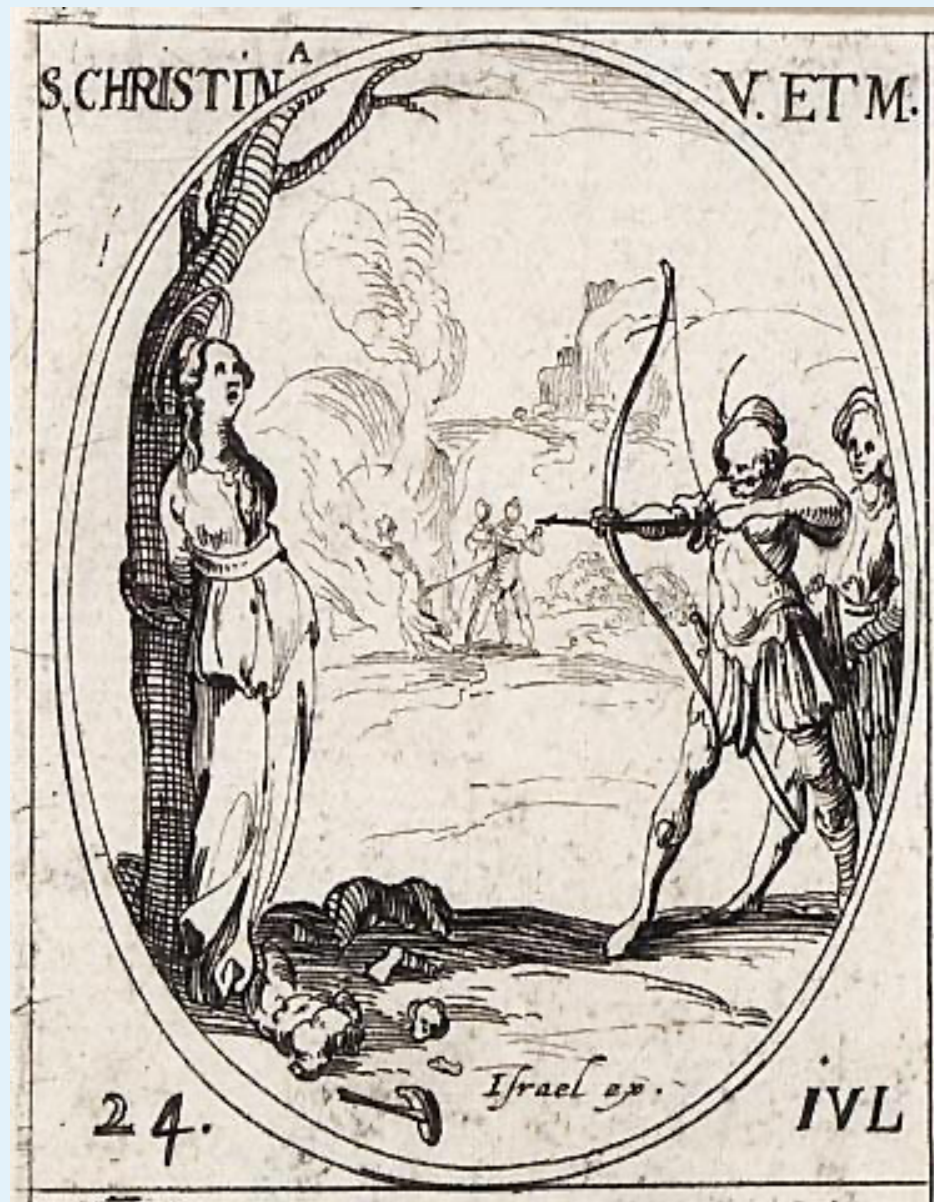
Sainte Christine de Tyr

Sainte Christine de Tyr martyre et Saint César martyr