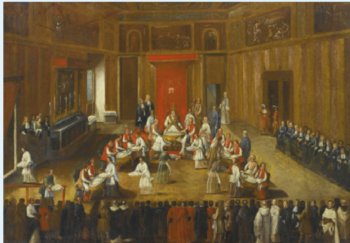
Fin XVIIe ou début XVIIIe siècle, huile sur toile, 121 x 169 cm, Sotheby's, Lot 130, 14 avril 2016.