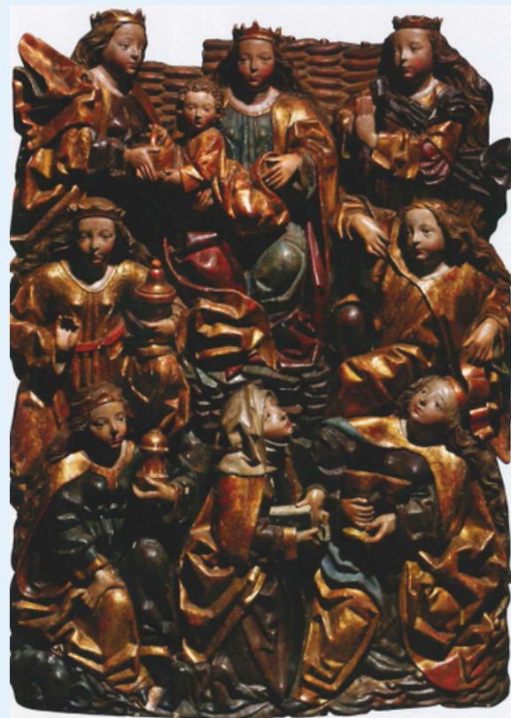
Vierge Marie et autres saintes, v. 1500, Allemagne, Ulm.