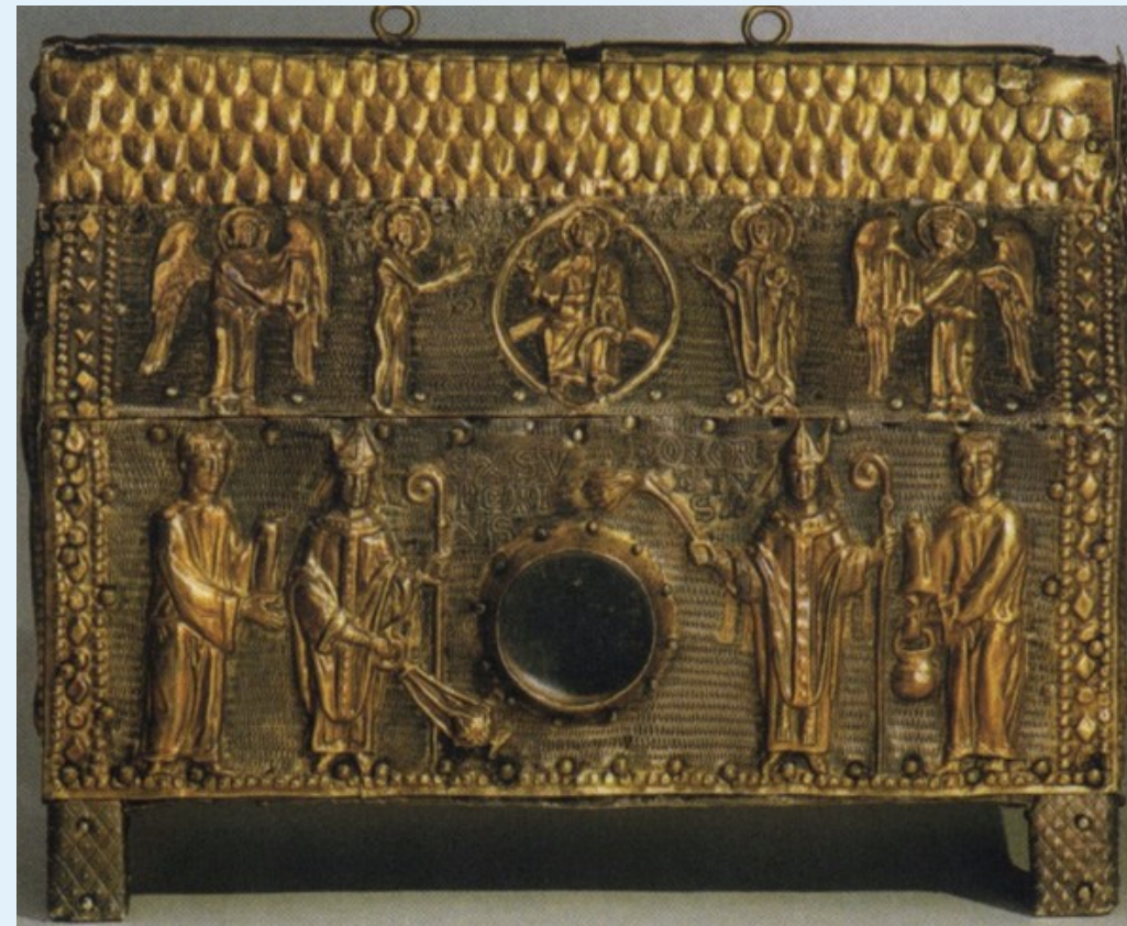
Saint Sernin : reliquaire de Saint Saturnin (fin du XIIe siècle), Exupère et Honorat (reproduit par Q. Cazes, Saint Sernin de Toulouse , 2008, p.19)