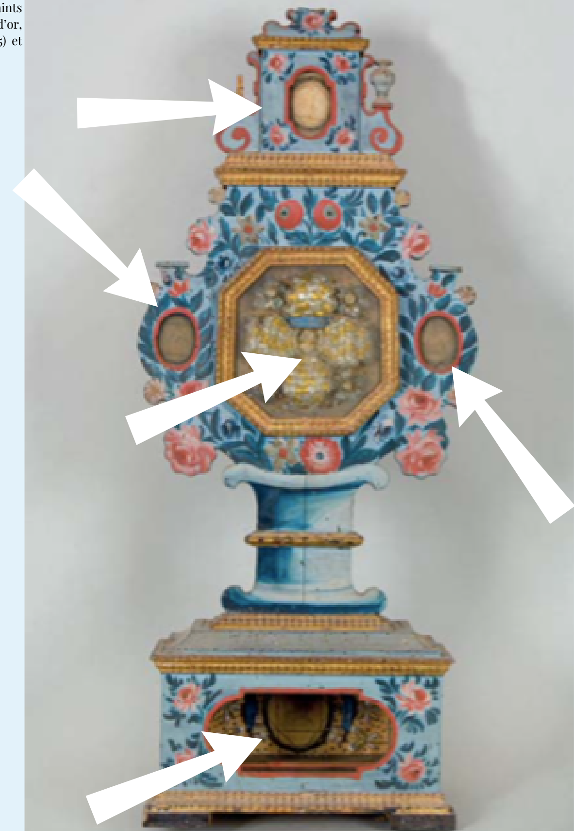
Atelier tridentin, Monstrance-reliquaire, fin du XVIIe siècle, Reliques des saints César martyr et Christine martyre, bois peint et doré, fil d'argent, fil d'or, paillettes, 86 × 31 × 16 cm ; cinq Agnus Dei bénis par Innocent X (1644-1655) et Innocent XI (1676-1689), cire. Balbido, Santa Giustina.