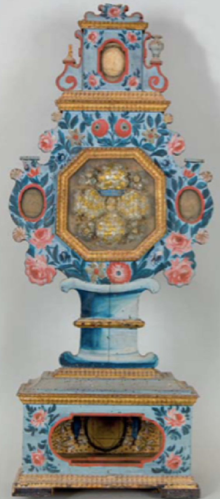
Atelier tridentin, Monstrance-reliquaire, fin du XVIIe siècle, Reliques des saints César martyr et Christine martyre, bois peint et doré, fil d'argent, fil d'or, paillettes, 86 × 31 × 16 cm ; cinq Agnus Dei bénis par Innocent X (1644-1655) et Innocent XI (1676-1689), cire. Balbido, Santa Giustina.