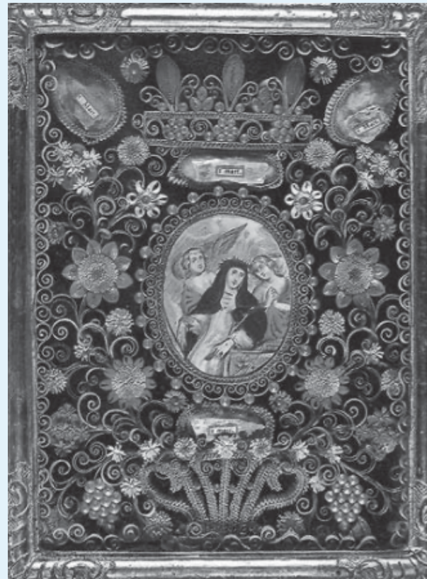
Reliquaire à paperoles d'origine flamande (ordre des Carmélites) figurant sainte Catherine de Sienne, XVIIe-XVIIIe siècles, gravure sur par- chemin rehaussée de gouache, os, papier, carton. Céleste Olalquiaga, « Flore sacrée : les reliquaires à paperoles, ornements sublimes », Perspective [En ligne], 1 | 2010.,