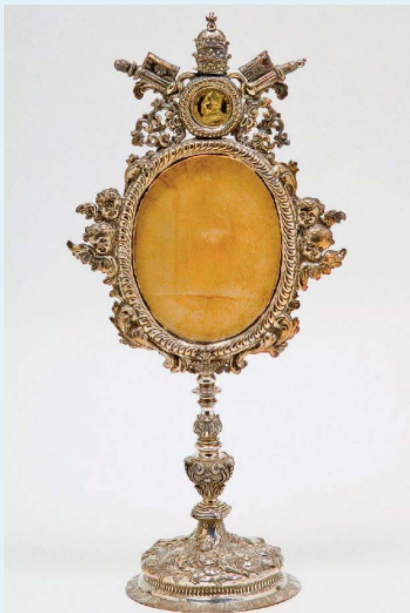
Atelier vénitien, Monstrance à Agnus Dei, fin du XVIIe siècle, argent repoussé et ciselé, 45 cm ; feuillant romain, Agnus Dei de Sainte Elisabeth du Portugal, 1668, cire, 16,5 × 13 cm, d'après un moule de Gaspare Mola (1637) conservé au Vatican (Musei Vaticani, INV. N° 48017/35) ; Gaspare Morone, médaille annuelle de Clément IX, 1668, or, Diocèse de Venise.