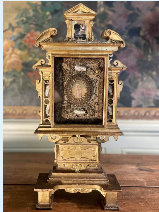
Reliquaire de Sainte Euphémie, fin XVIe. Site : Le jardin des moines.