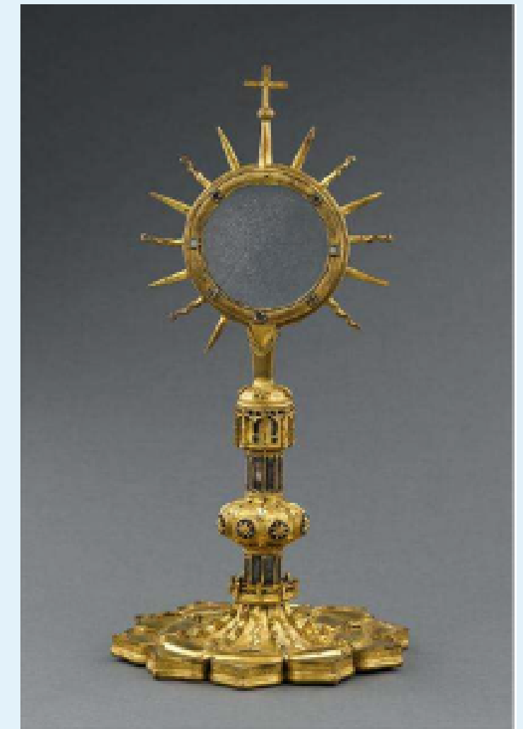
Ostensoir-Soleil, XVe s. (pied) et XVIe s. (soleil), Musée de Cluny, Paris, inv. Cl. 992.

"Genèse et usages de la monstrance eucharistique entre Moyen âge et Temps modernes (XIIIe-XVIIe s.) : Un joyeau d'or de maçonnerie au milieu i y a un cristal rond pour mettre Corpus Christi", L'orfèvrerie liturgique, CIPAR, Namur, 2019, p. 22-30.