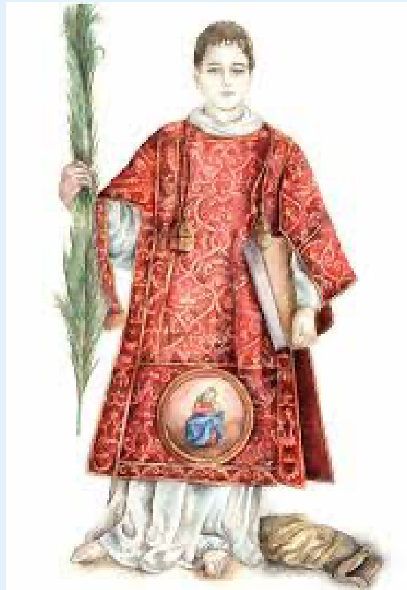
Saint César

Atelier tridentin, Monstrance-reliquaire, fin du XVIIe siècle, Reliques des saints César martyr et Christine martyre, bois peint et doré, fil d'argent, fil d'or, paillettes, 86 × 31 × 16 cm ; cinq Agnus Dei bénis par Innocent X (1644-1655) et Innocent XI (1676-1689), cire. Balbido, Santa Giustina.