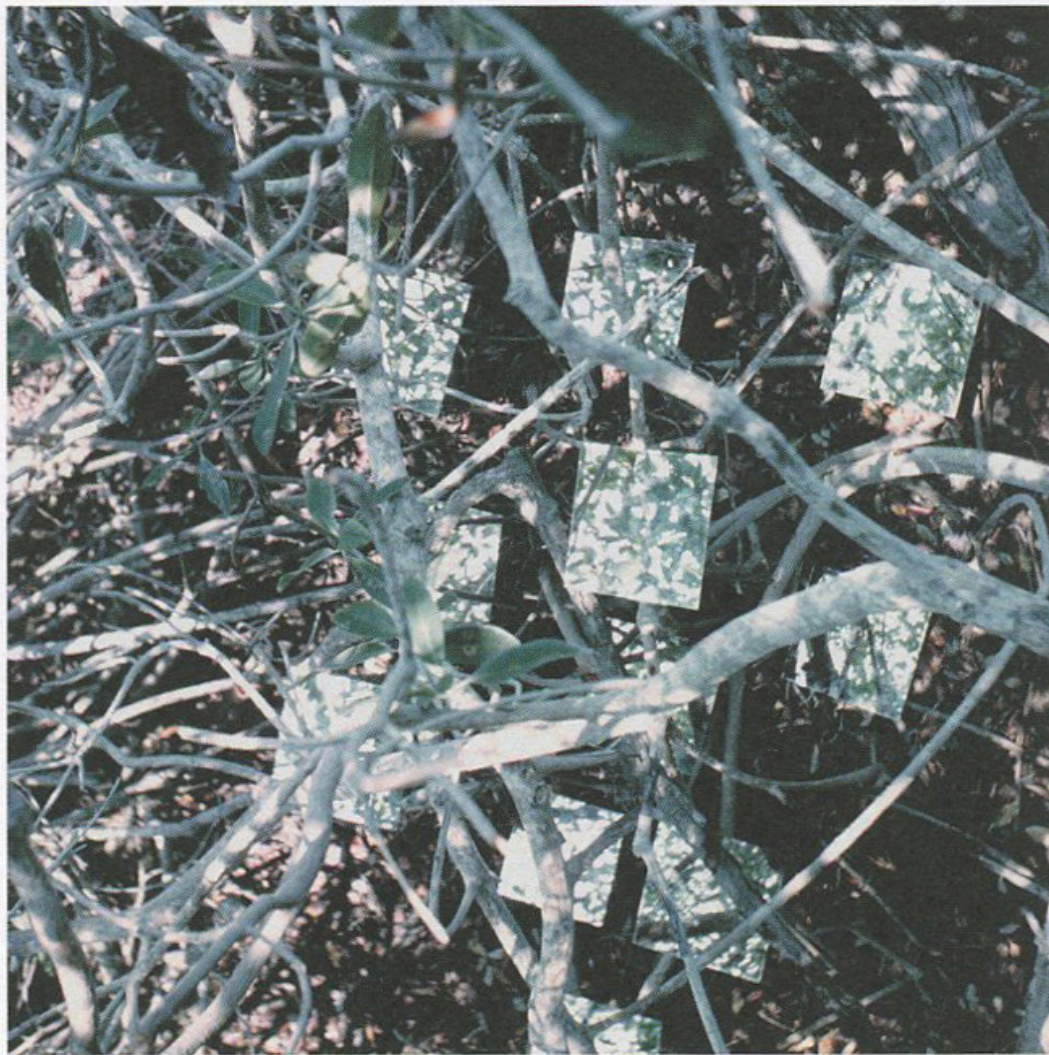
67. Robert Smithson, Yucatan Mirror Displacements (n°9), 1969.

Comment ? Smithson ne le dit pas vraiment mais s'il avait vécu plus longtemps il l'aurait certainement montré. On voit en tout cas que la nature est loin d'être pour lui une valeur capable de donner à l'art un sens ou une destination supérieure. Si sa vision de l'écologie est ambiguë c'est que, comme le disait le titre de l'un de ses entretiens extrait d'un livre de Malcolm Lowry, « la terre sujette aux cataclysmes est un maître cruel 26 » et que de ses mouvements sismiques, des modifications de son climat comme des créatures qui la peuplent, des microbes aux animaux de toutes sortes jusqu'à l'homme lui-même, il faut savoir se protéger. À la fin du texte sur son dernier Déplacement de miroir dans le Yucatan [fig. 67], il déclarait que l'art ne se nourrissait pas de « différentiation mais de dédifférenciation, pas