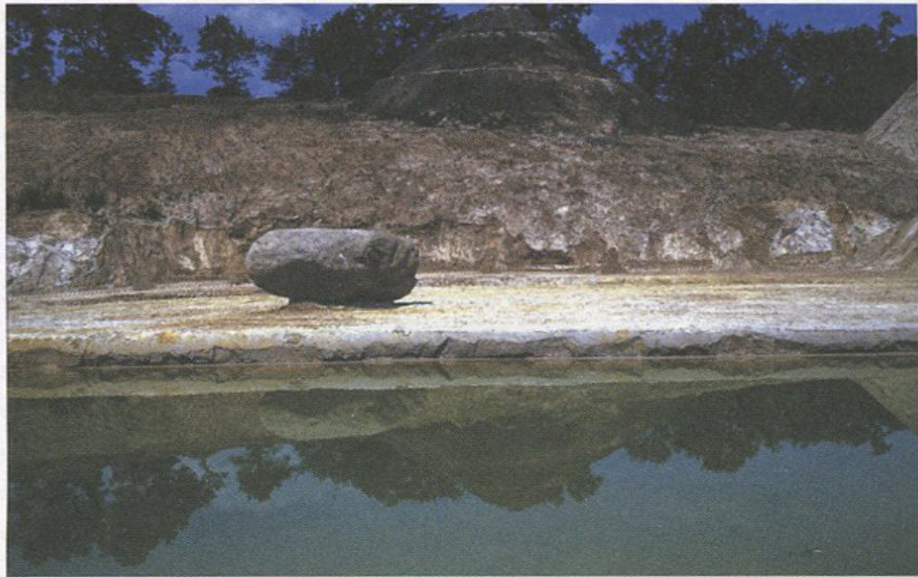
63. Robert Smithson, Broken Circle , 1970.

une terre cultivée et conquise sur la mer « and so much an earthwork in itself » – et déjà tellement en elle-même un earthwork – il recherchait plutôt un terrain, comme une mine ou une carrière abandonnée, qu'il pourrait transformer à sa guise.