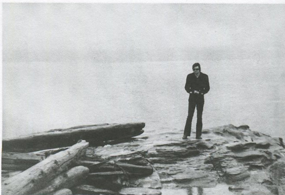
65. Robert Smithson, Miami Islet , 1970.

brillé au loin comme une « émeraude ». Mais Smithson rencontra une farouche opposition des associations locales de défense de la nature au motif que des oiseaux migrateurs pouvaient venir se reproduire à cet endroit. Rien ne le prouvait mais rien ne permettait non plus d'affirmer le contraire si bien que, mis en difficulté par ces associations relayées par la presse, il dut renoncer au projet.