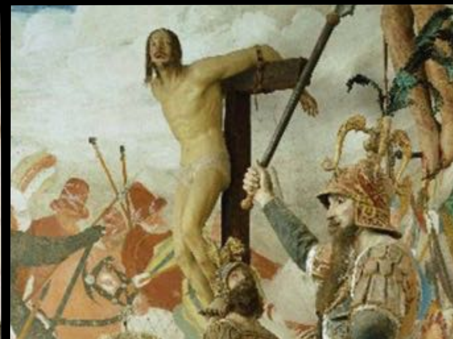
Gaudenzio Ferrari, 1520-1523, Varallo, Sacro Monte, chapelle de la Crucifixion