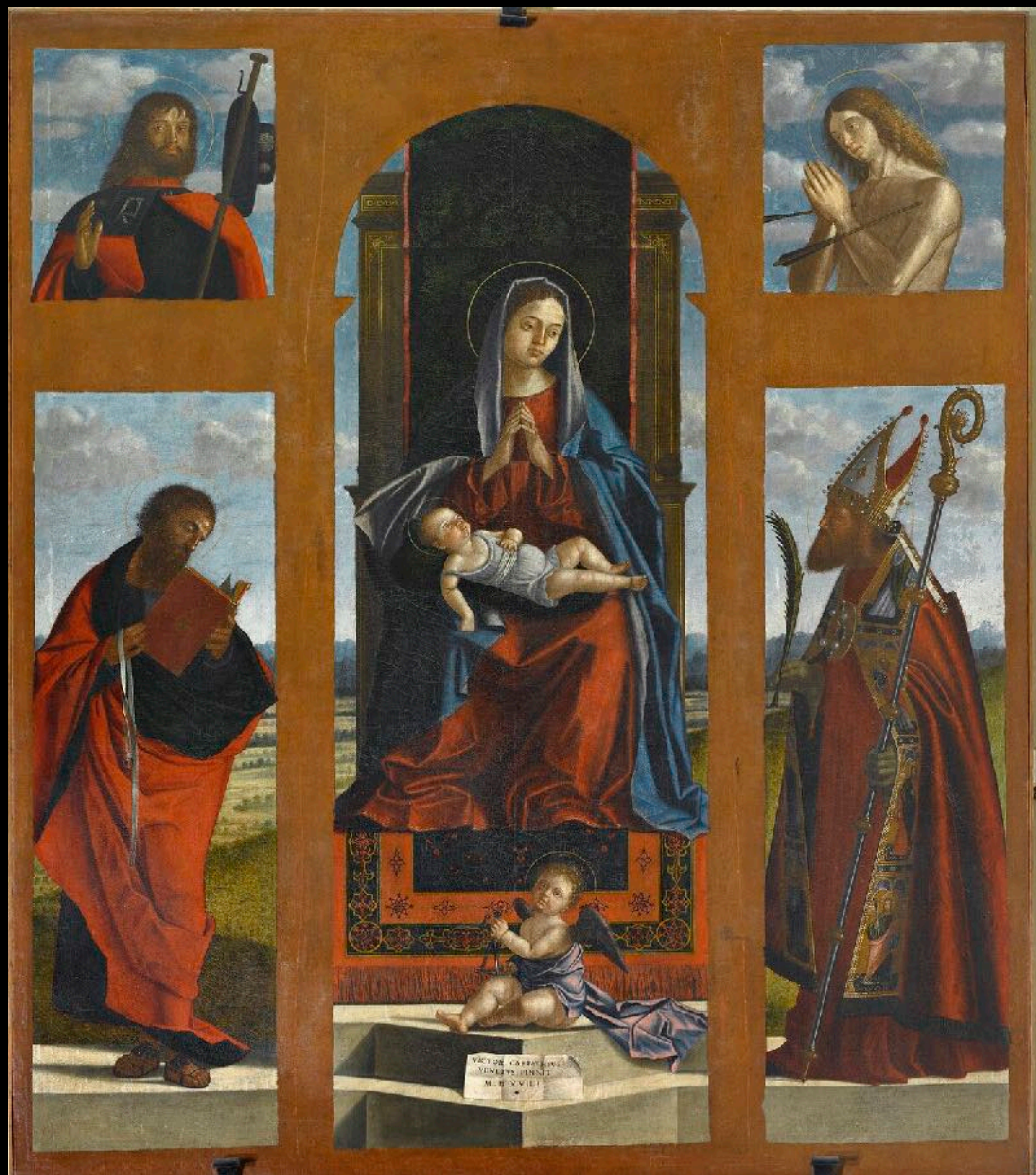
Vittore Carpaccio, Polyptyque de Pozzale , 1519, huile sur toile, s. d., Pozzale di Cadore, église paroissiale