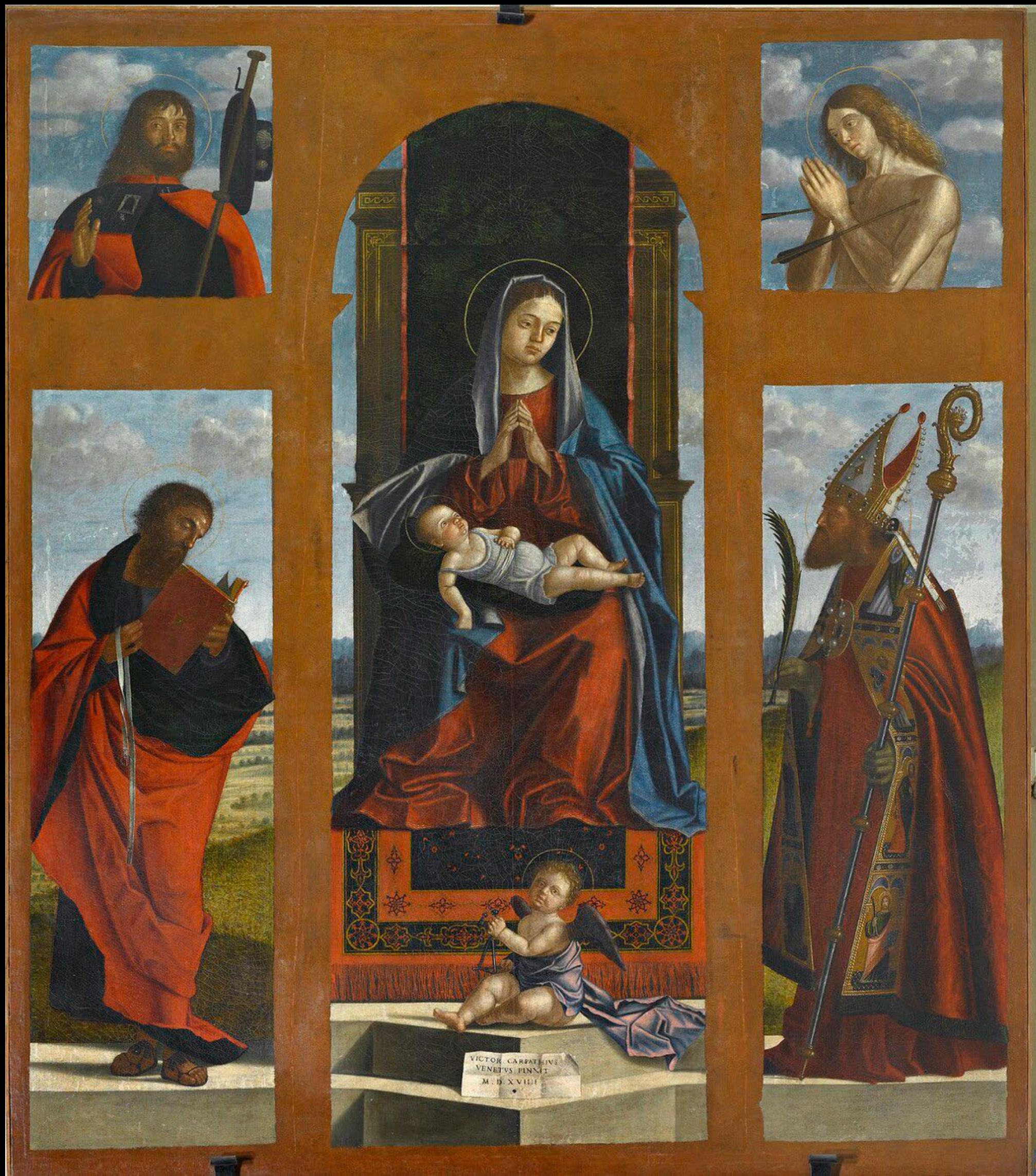
Vittore Carpaccio, Polyptyque de Pozzale , 1519, huile sur toile, s. d., Pozzale di Cadore, église paroissiale