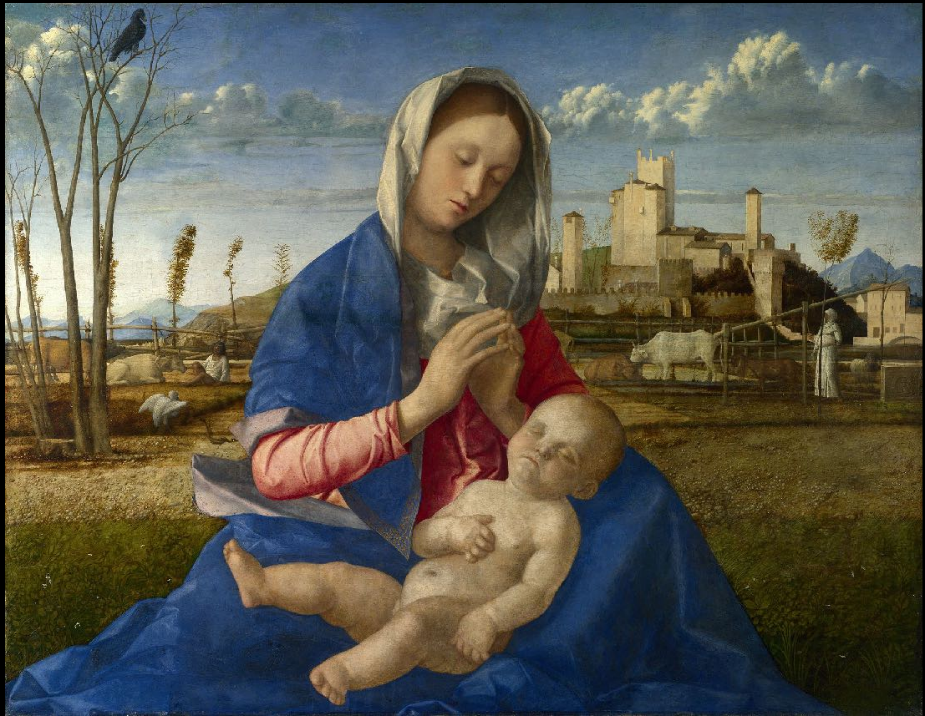
Giovanni Bellini, Madonna del Prato , 1505, huile sur bois transposée sur toile, 67 × 86 cm, Londres, National Gallery