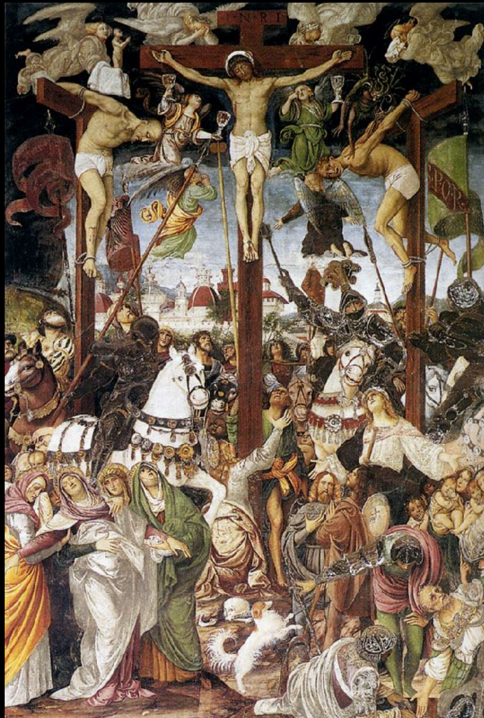
Gaudenzio Ferrari, Crucifixion , 1513, fresque, s. d., Varallo, Santa Maria delle Grazie