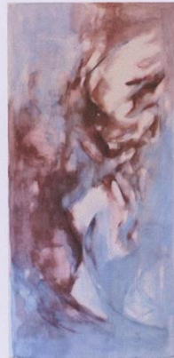
Etat 1 : dispersion