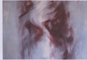
Etat 3 : condensation (détail)