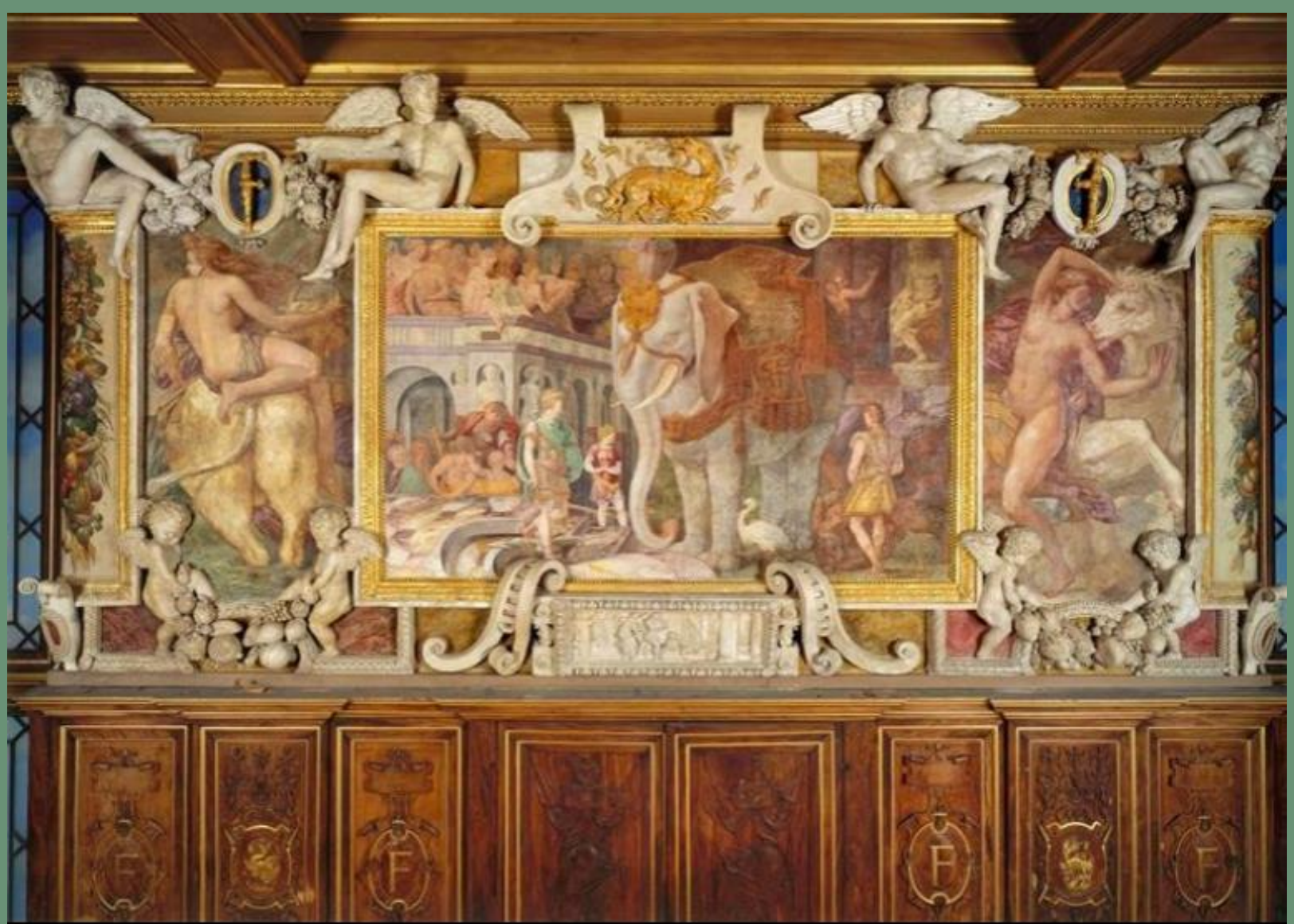
Rosso, L'éléphant fleurdelisé , fresque, 1533-39, Galerie François 1er, Fontainebleau

Cartouche : Alexandre le Grand coupant les nœuds gorgiens