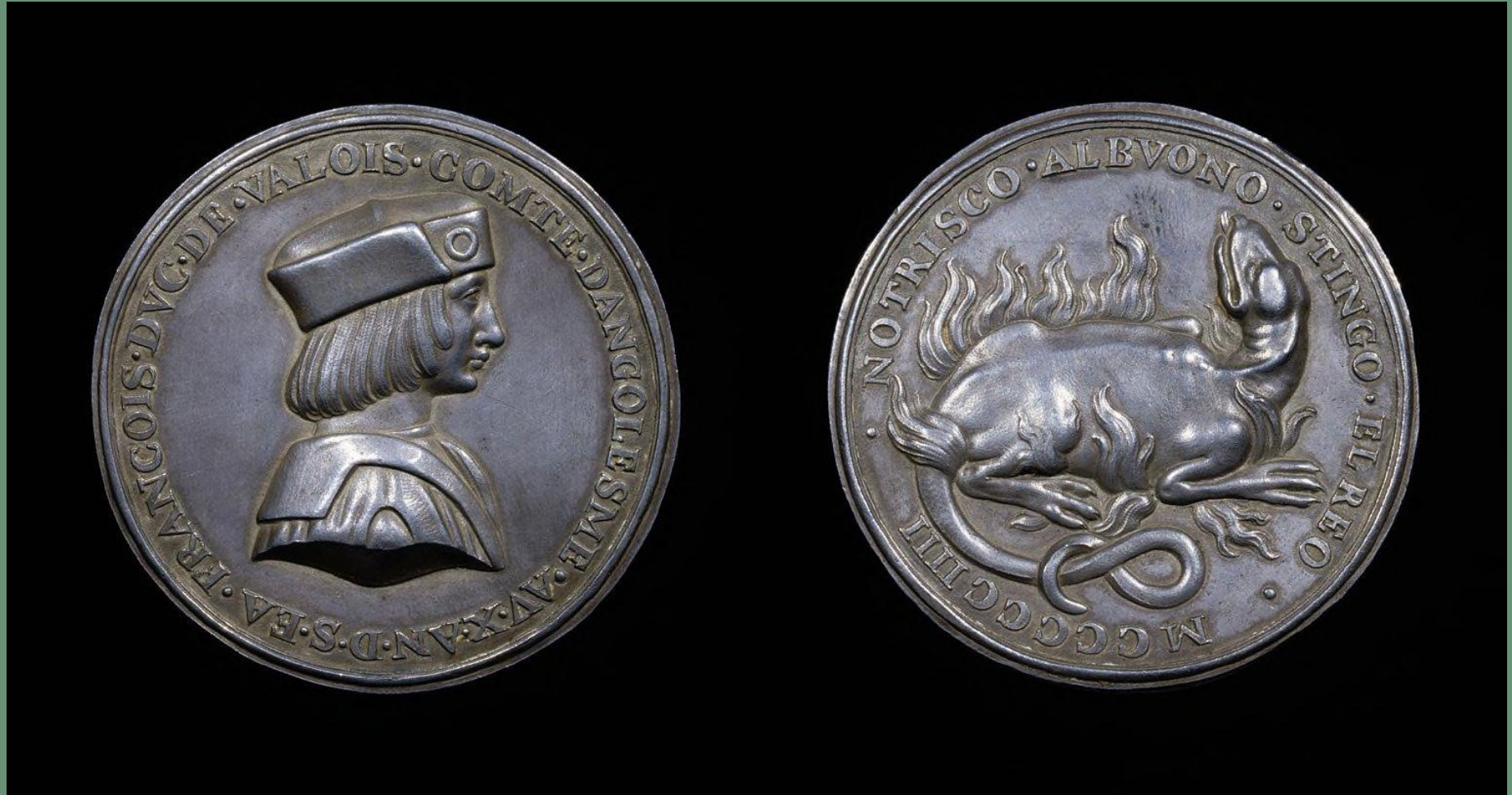
Médailleur français anonyme, Médaille de François d'Angoulême , 1504, BNF

Salamandre : se nourrissent et éteignent le feu