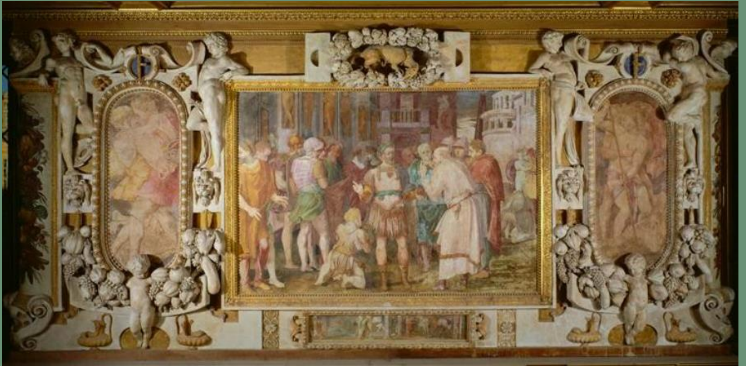
Rosso Fiorentino, L'unité de l'État , fresque, 1533-39, Galerie François 1er, Fontainebleau