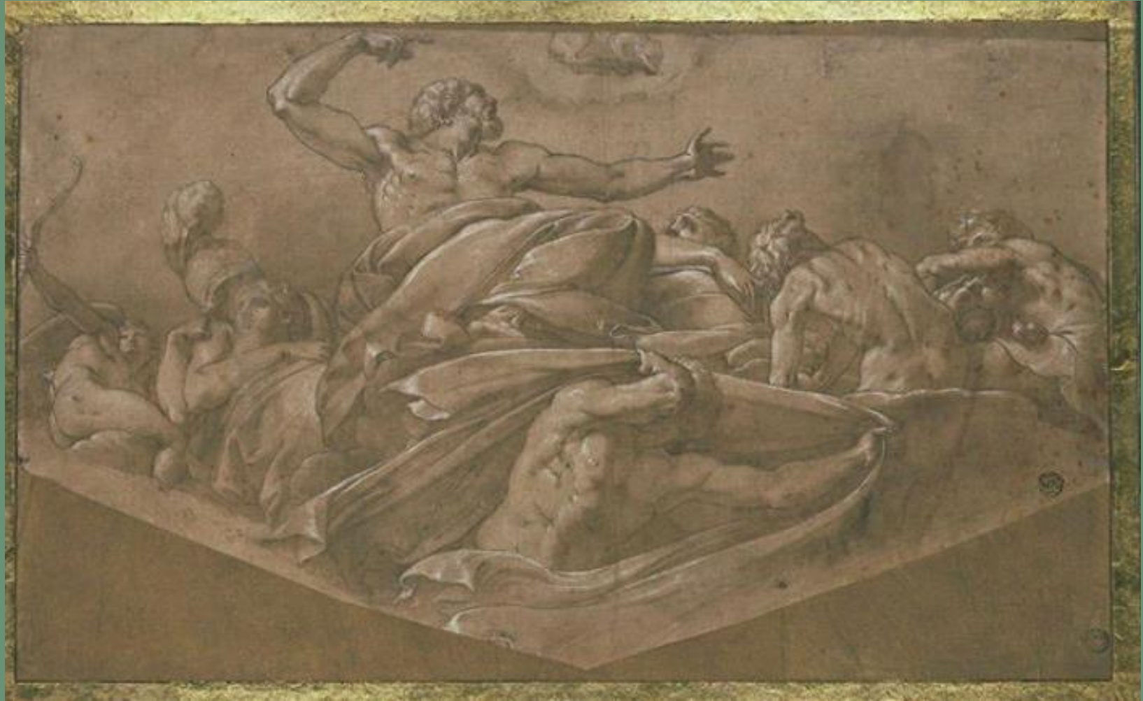
Primaticcio, Jupiter et Callisto , dessin préparatoire pour la voûte de l'appartement des bains, 1545, Louvre

Cinquième salle : scènes de grandes dimensions où sont représentées les divinités de la mer