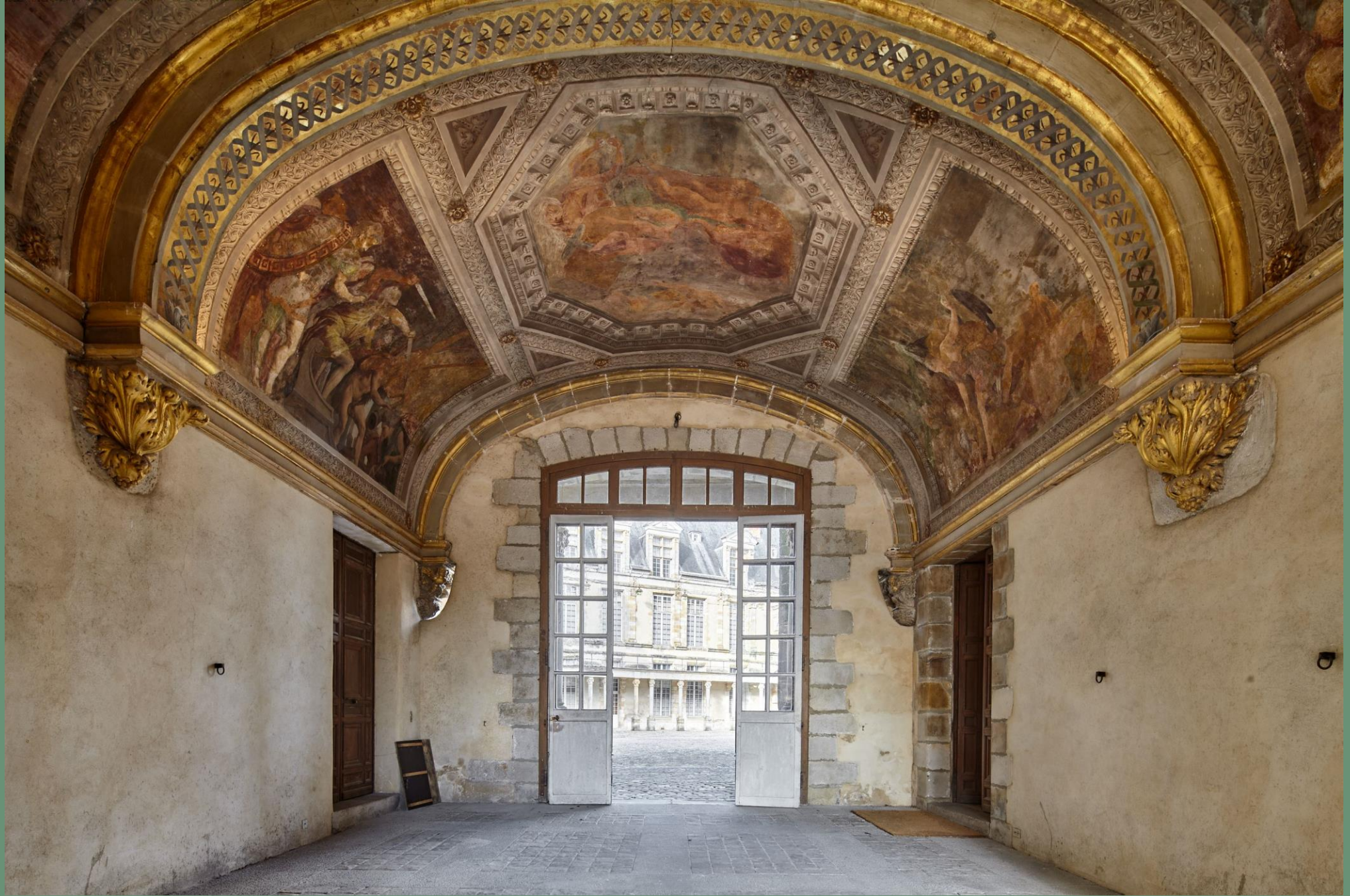
La porte dorée, 1535 ou 41 - 1544