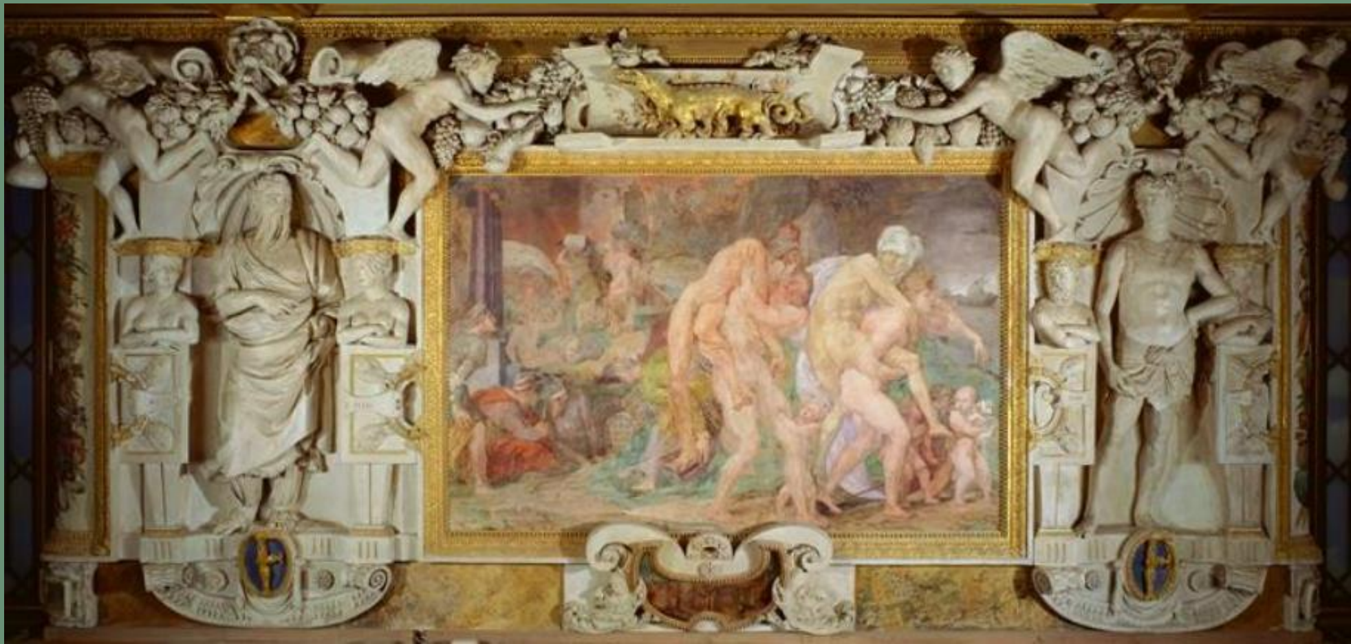
Rosso , Incendie de Troie ou les Jumeaux de Catane , fresque, 1533-39, Galerie François 1er, Fontainebleau

À partir de la cinquième travée, les allégories changent de thèmes : on passe de la mystique de la royauté à la personne de François I er