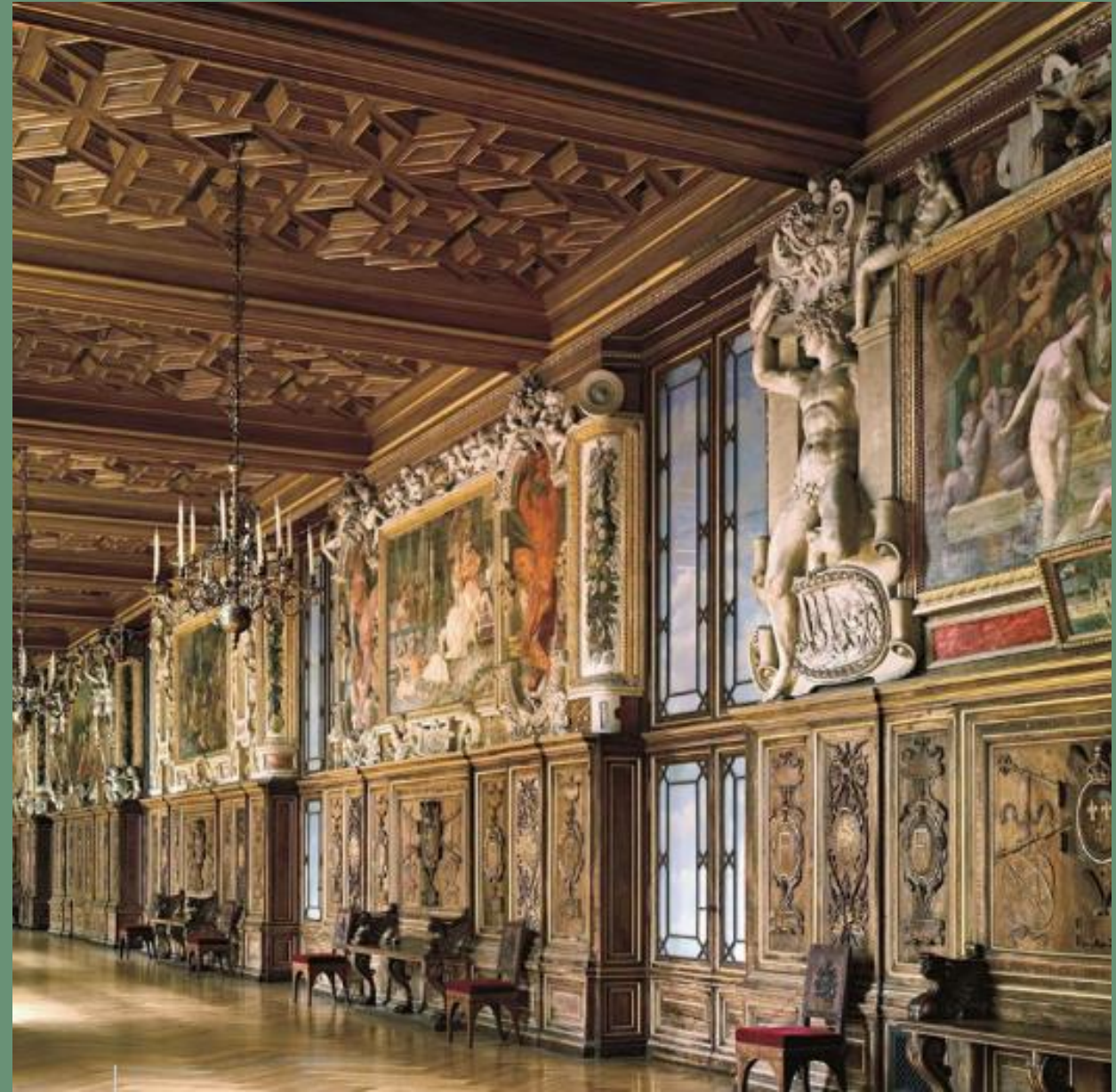
Galerie François 1 er , château de Fontainebleau

Complexité iconographique - Marguerite d'Angoulême : «regarder vos bâtiments sans vous, c'est regarder un corps mort»