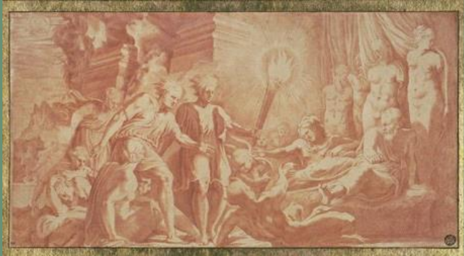
Primatice, Hercule et Phonus , Vienne, KHM

Fontainebleau est le lieu où les vertus belliqueuses du héros se transforment en grâce