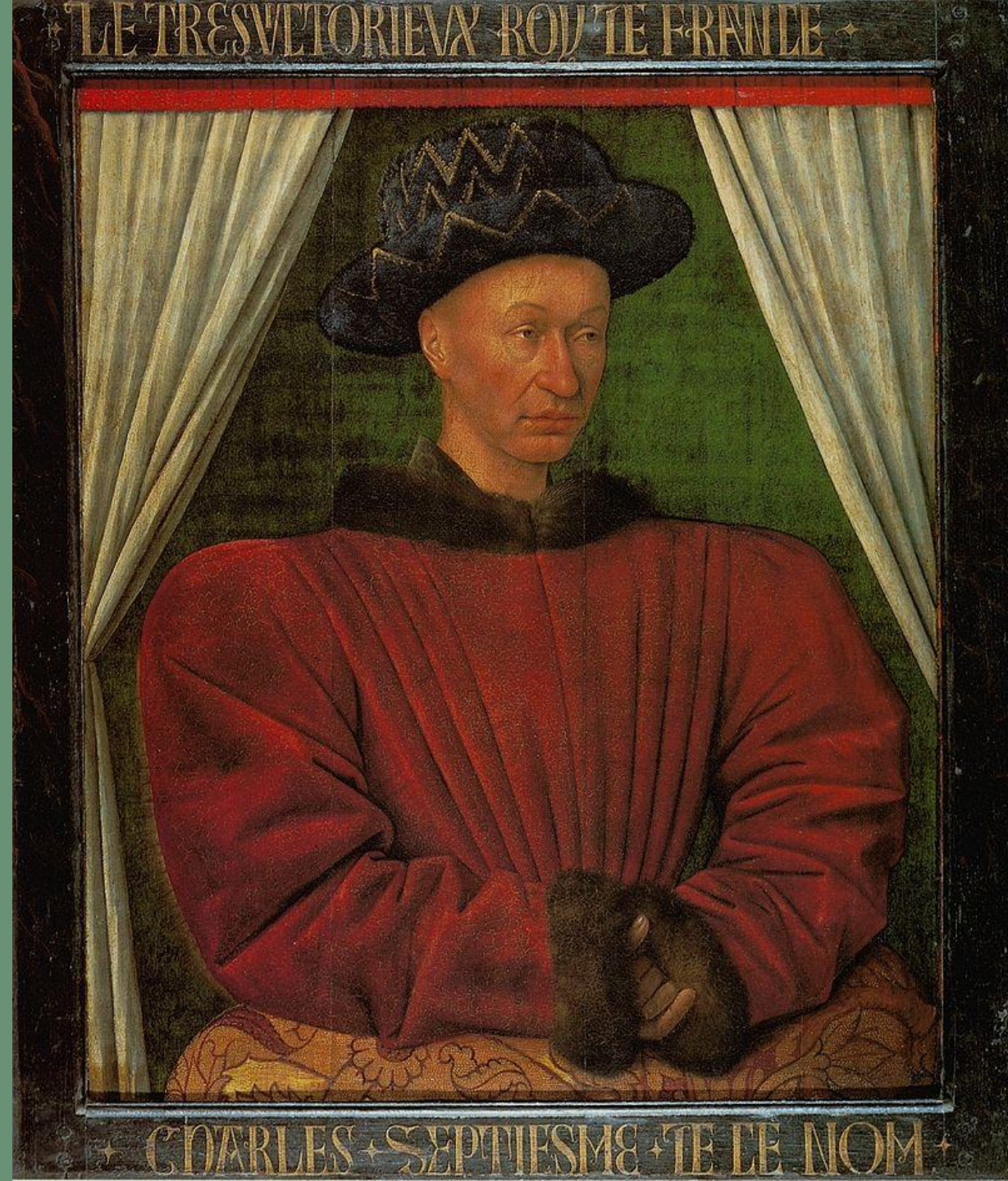
Jean Fouquet, Charles VII , 85x70cm, hb, 1445, Louvre, Paris