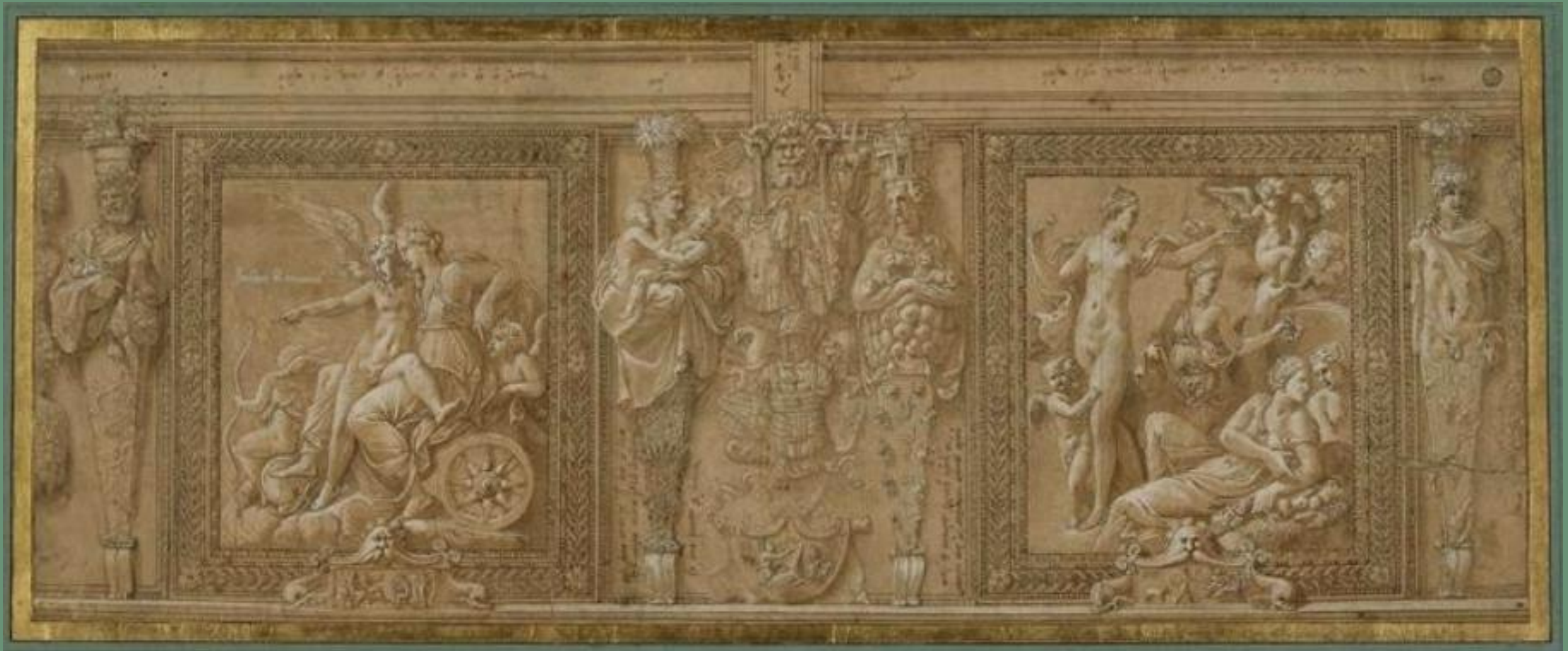
Primitice, Projet pour la chambre du roi , 1532, Louvre