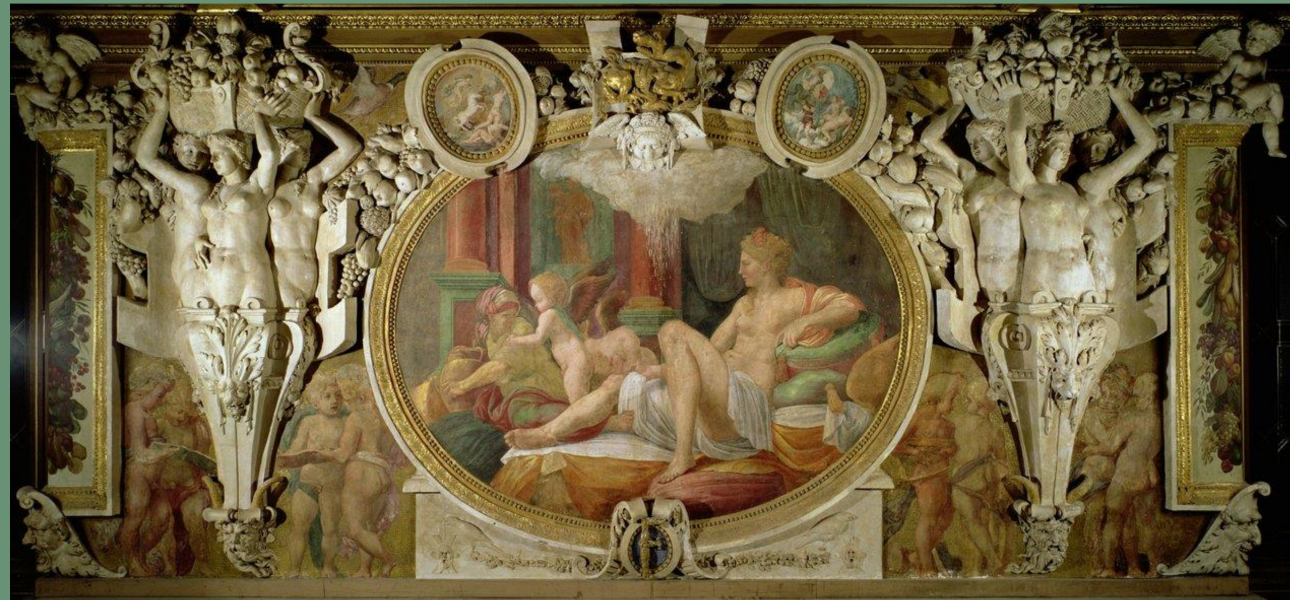
Primaticcio, Danaé , fresque, 1537, Galerie François 1er, Fontainebleau