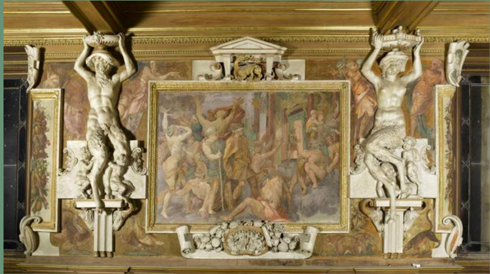
Rosso Fiorentino, L'ignorance chassée , fresque, Galerie François 1er, Fontainebleau

Guillaume Budé, en 1532, « les très anciens poètes, leurs fables inextricablement compliquées, et qui font montre d'une énorme impiété, ils les regardaient, quant à eux, comme les enveloppes d'une vérité qu'ils estimaient devoir selon un vieil usage, dissimuler aux yeux et tenir loin à l'égard de la multitude profane, et dans ces fables précisément, ils ont transmis une tradition secrète tant sur les forces de la nature que sur l'art de vivre dans la paix et ds la dignité »