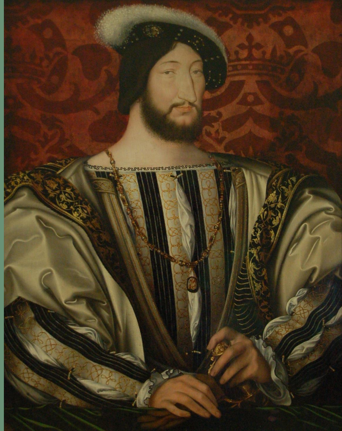
Jean et François Clouet, François Ier (1494-1547), roi de France , 96x74cm, hb, 1527-1530, Paris, Louvre

Cours d'érudits : Guillaume Budé (bibliothécaire royal), Lorenzo Valla, Érasme entre autres