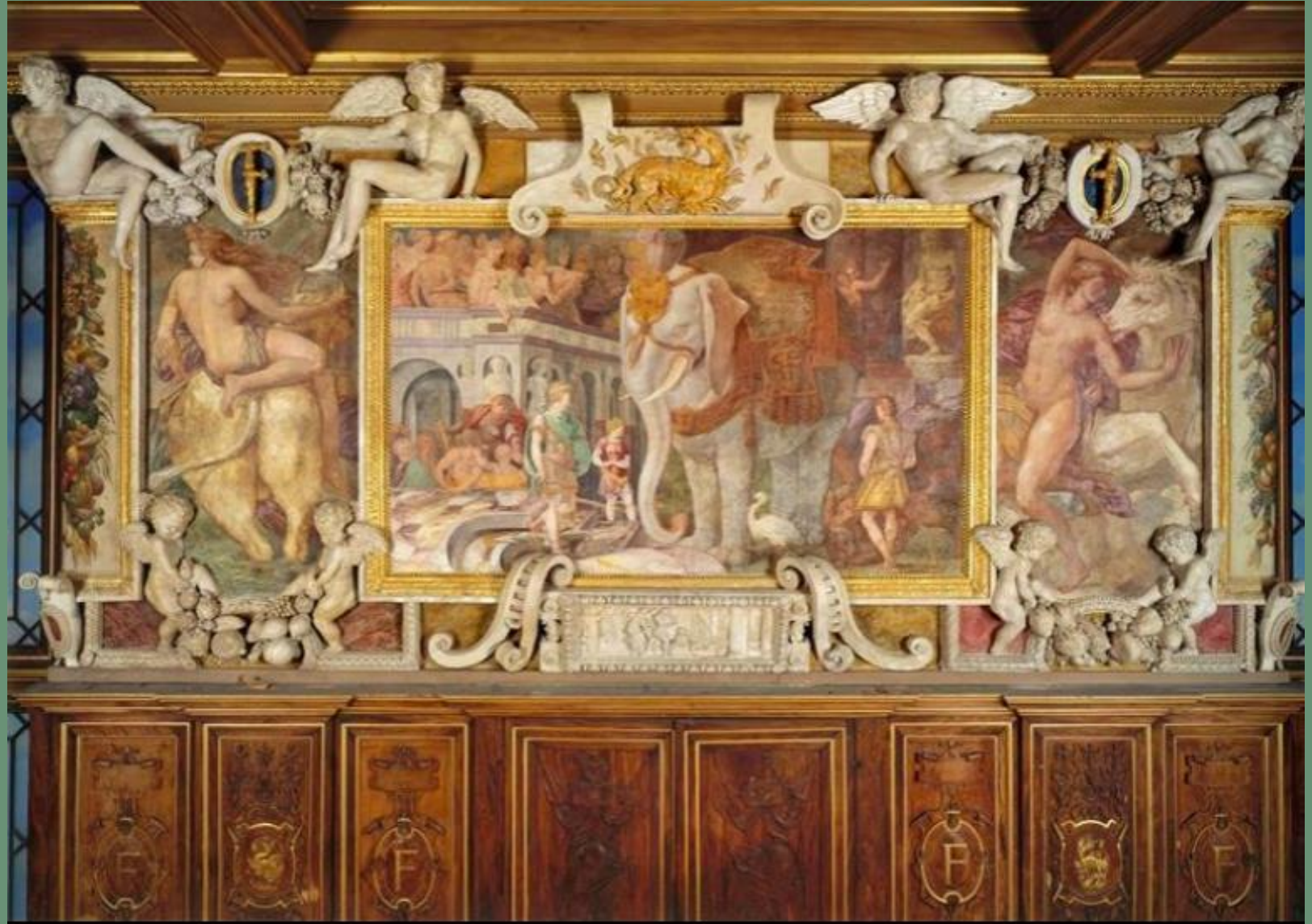
Rosso Fiorentino, L'éléphant fleurdelisé , fresque, 1533-39, Galerie François 1er, Fontainebleau