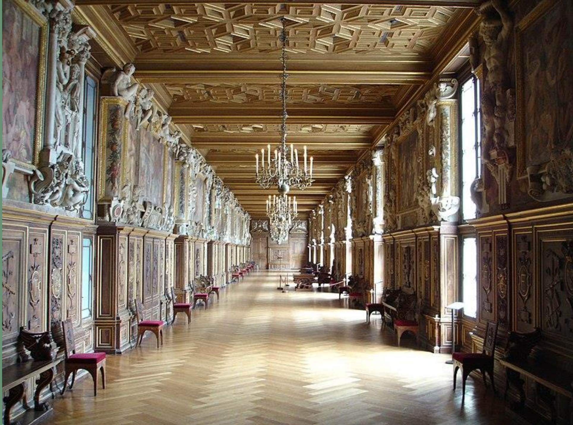
Galerie François 1 er , château de Fontainebleau