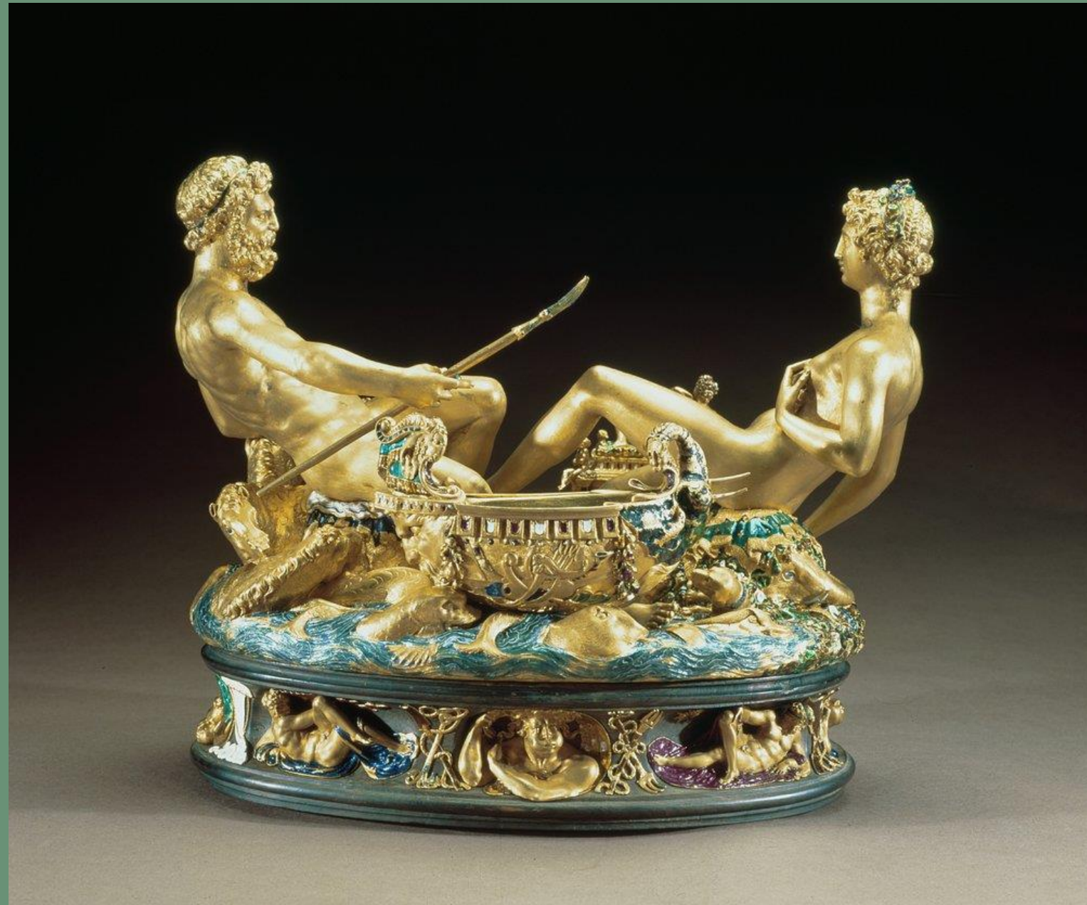
Cellini, Saliera d'or , 26x21cm, or, ébène et ivoire, 1543, Vienne