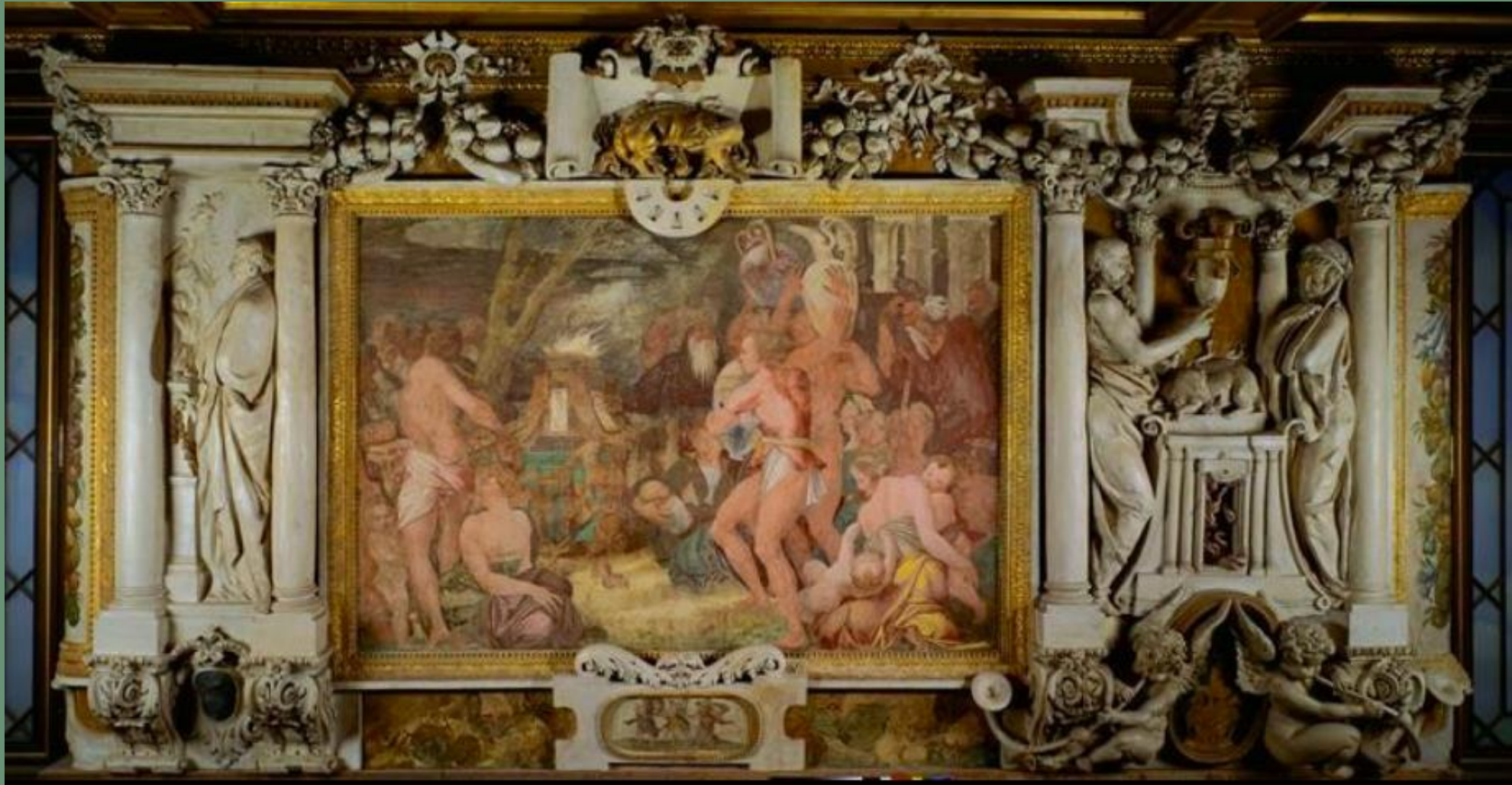
Rosso Fiorentino, Le Sacrifice , fresque, Galerie François 1er, Fontainebleau