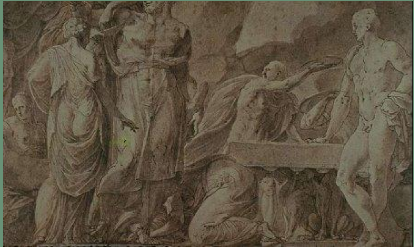
Primatice, Hercule et Omphale , Vienne, KHM

La scène est placée du côté du soleil couchant, comme sur la représentation = continuité avec le vestibule