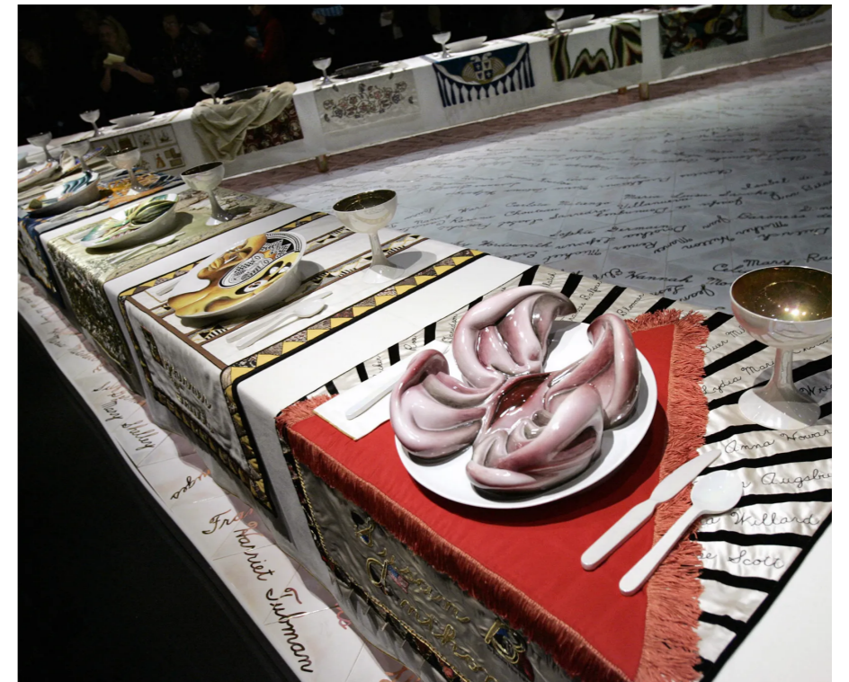
Judy Chicago, The Dinner Party , 1974-1979