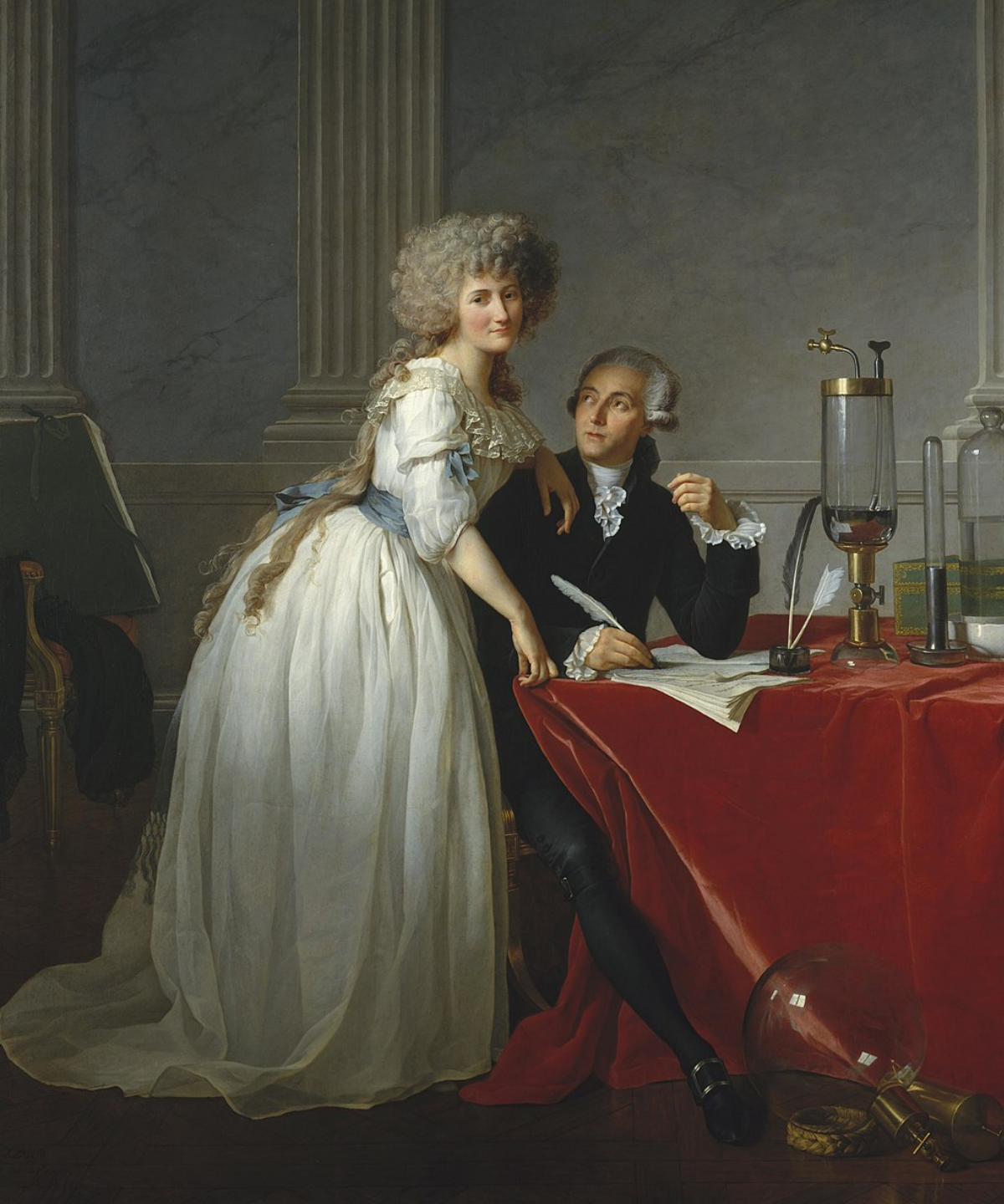
Jacques-Louis David, Portrait de Marie-Anne et Antoine Lavoisier , 1788 (Metropolitan Museum, New York)