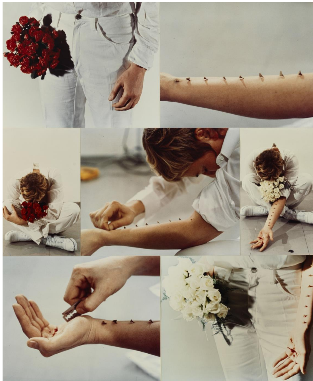
Azione Sentimentale , performance réalisée à la galerie Diagramma, Milan, 1973

Les blessures que s'inflige l'artiste dépassent sa personne. Elles provoquent un trouble du corps susceptible de devenir un trouble dans la pensée des autres, une identification à la douleur de l'autre pour redonner au corps sa « fonction de médiation sociale » . La douleur doit être contagieuse . Elle doit se répandre dans le public dans un geste de communion . Elle insiste d'ailleurs souvent sur le fait que ses actions sont fondées sur l'amour. Elle ne veut pas se faire violence. Elle veut transformer le regard , tendre des pièges dans les conventions sociales.