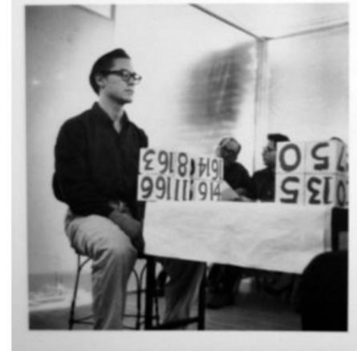
Allan Kaprow: 18 Happenings in 6 Parts, 1959