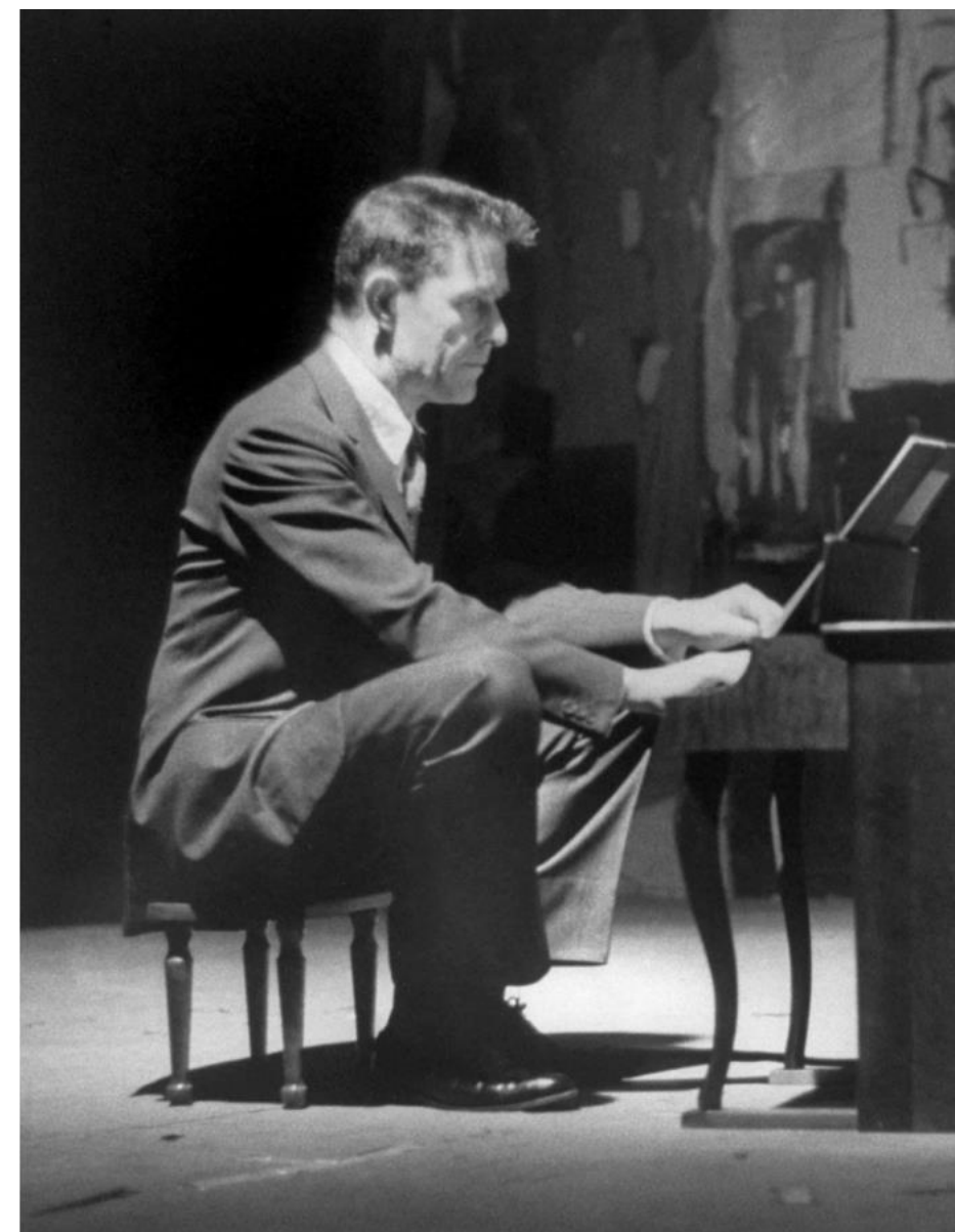
John Cage performing the Suite for Toy Piano. Living Theatre, NY. March 14, 1960.

L'événement incarne un art total, éphémère, ouvert à l'interprétation, où l'attention du public prime sur l'intention de l'artiste. Fidèle à son rejet des classifications, Rauschenberg résume sa démarche en 1961 : « Je veux éviter les catégories. [...] J'ai appelé cela des Combine Paintings pour échapper aux définitions. » Untitled traduit ainsi concrètement leur volonté de dépasser les genres et les cadres critiques.