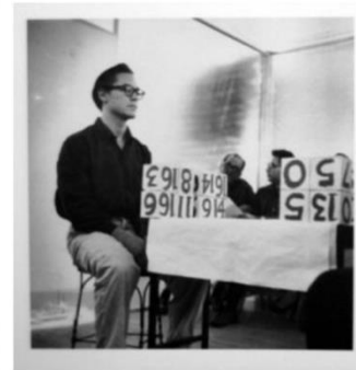
Allan Kaprow: 18 Happenings in 6 Parts, 1959