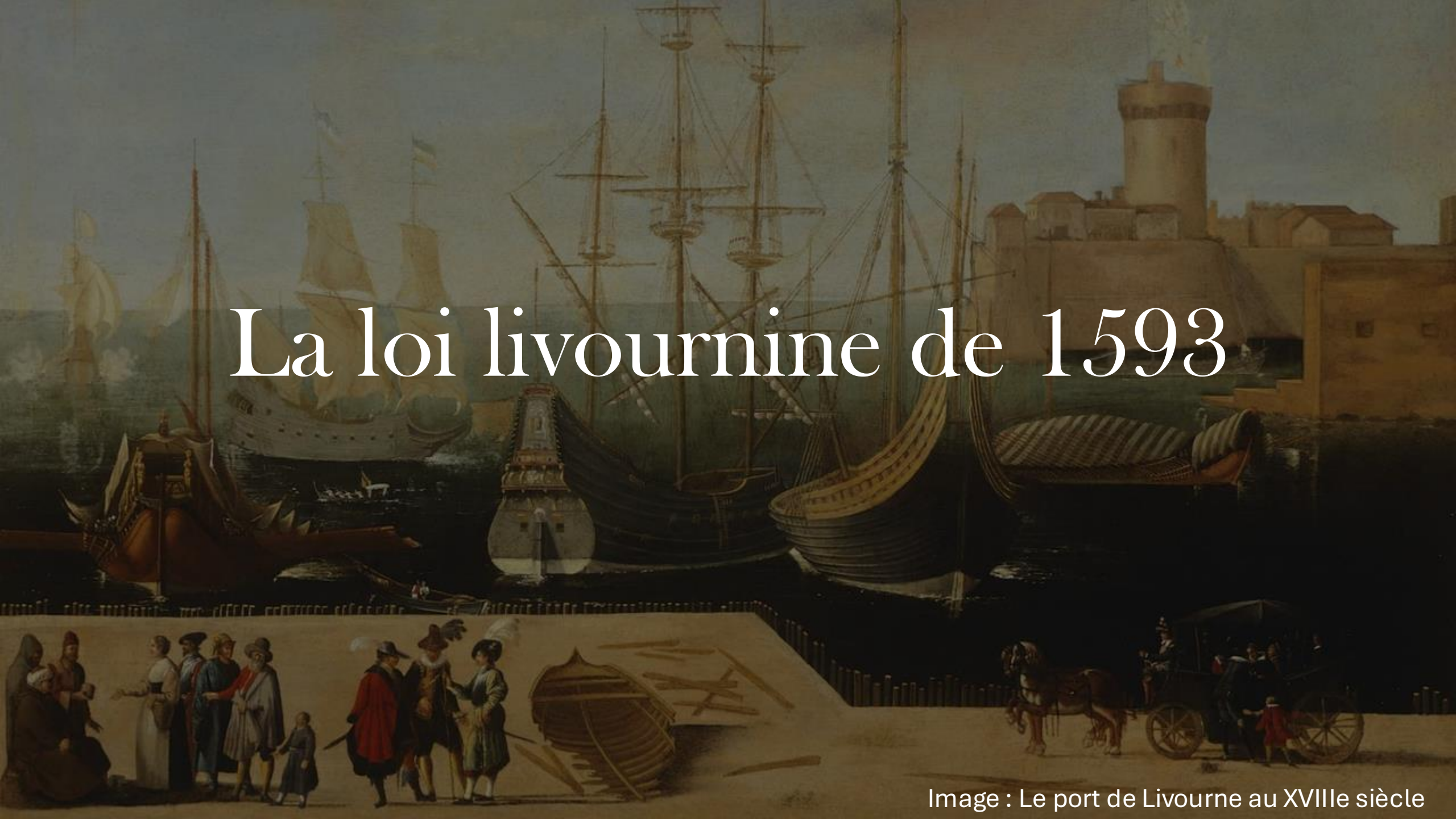
Image : Le port de Livourne au XVIIIe siècle