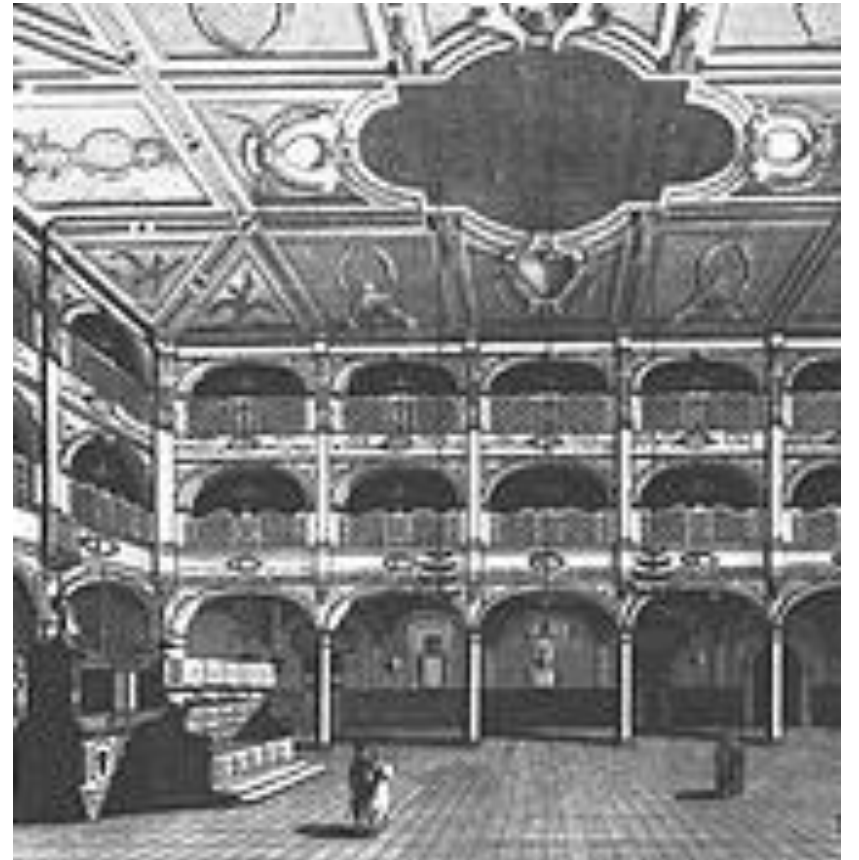
Gravure de l'ancienne synagogue de Livournes

Article XXVI - "Nous interdisons à tout Chrétien de vous ôter ou enlever quiconque de votre famille, garçon ou fille, pour les faire Chrétiens s'ils sont âgés de moins de treize ans. Les majeurs seront logés chez les Catéchumènes ou chez autrui lors de la quarantaine précédant le Baptême, et ils pourront recevoir la visite et discuter avec leurs Pères, Mères et autres Parents. Nous voulons aussi que ni le père ni la mère de tout juif & juive qui se ferait Chrétien ou Chrétienne ne soient tenus à leur céder quoi que ce soit de leur vivant, et que ces Baptisés ne puissent pas témoigner dans les procès impliquant des juifs."