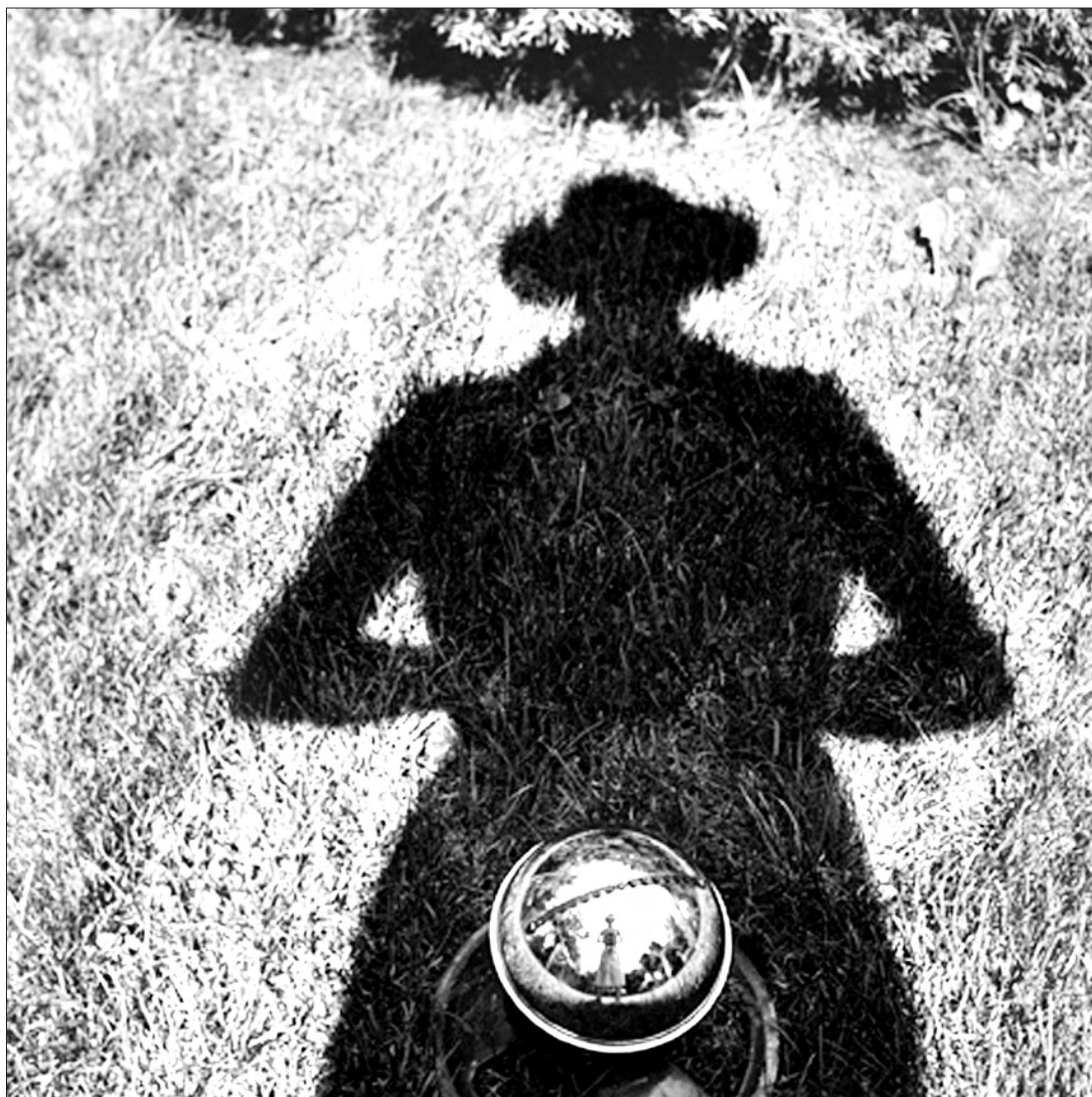
VIVIAN MAIER, Autoportrait, sans date.