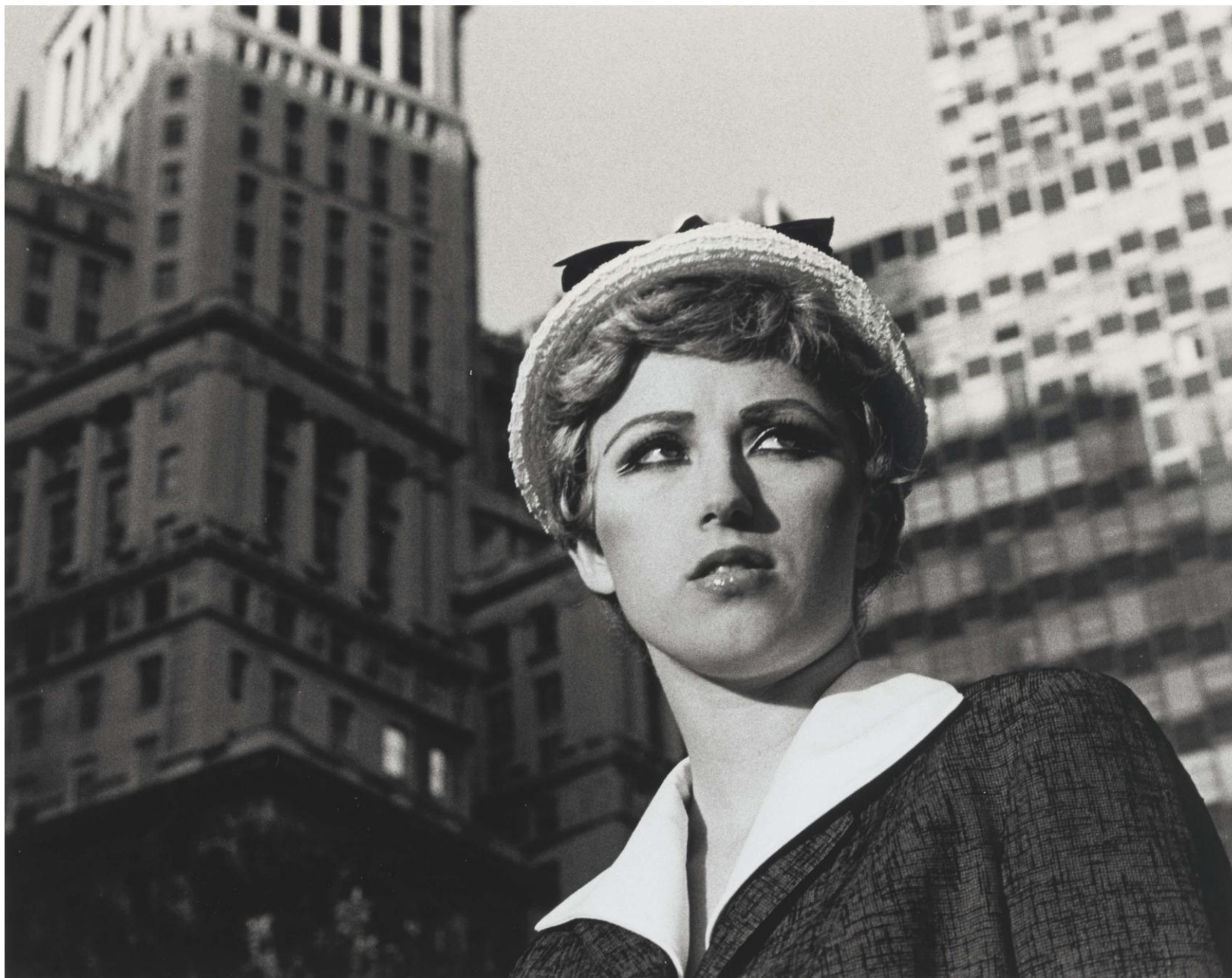
3. Untitled Film Still #21 — Cindy Sherman (1978)