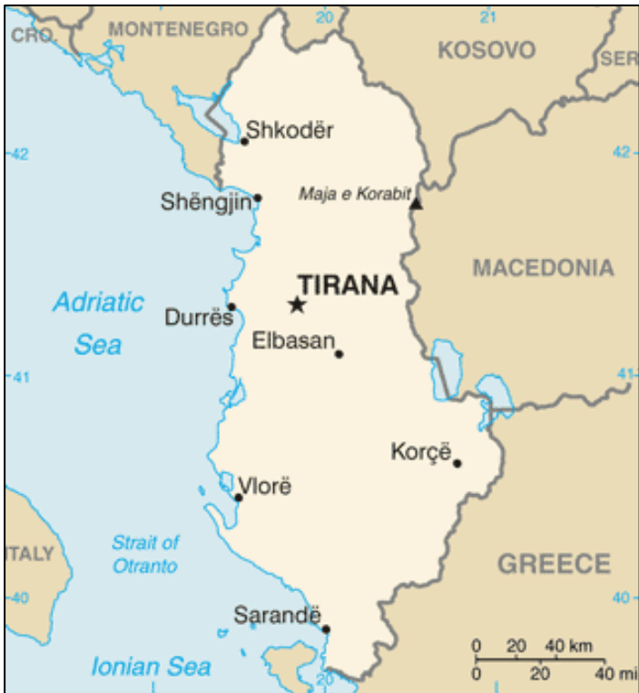
Carte 1 : Position géographique de l'Albanie