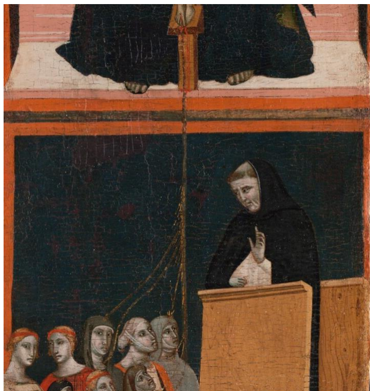
Figure 12 : Pacino di Bonaguida, Tabernacle Chiarito , détail du volet droit.

ornementations de la partie centrale, la transformant ainsi en une image mouvante et insaisissable 16 . Après l'union mystique et l'union eucharistique, l'union de la communauté au Christ est déclinée sur le volet droit du retable (fig. 11). On y voit dans le registre supérieur la Trinité sous la forme d'un Trône de grâce. Ce motif iconographique montrant dans un même temps la Trinité, la paternité de Dieu et l'offrande du Fils par le Père relie ce volet droit aux deux autres volets du retable via le thème du sacrifice. Dans le registre inférieur du panneau, un groupe de fidèles écoute un prédicateur dominicain en chaire. On y voit des hommes et des femmes dont certaines portent un habit religieux. Au pied de la chaire, Chiarito, légèrement en retrait et de plus petite taille que les autres personnages, observe la scène : il s'agit donc encore d'une scène de vision. L'auditoire est dans l'ensemble très attentif au prêche.