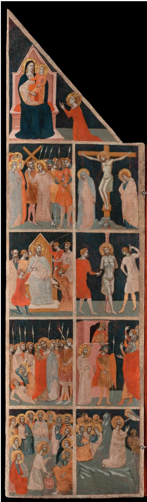
Figure 7 : Pacino di Bonaguida, Tabernacle Chiarito , volet gauche.

Regardons plus précisément l'image. Le volet gauche du triptyque représente la passion du Christ de façon caractéristique des retables florentins du xiv e siècle : l'ensemble est surmonté par le mariage mystique de saint Catherine (fig. 7). La présence de cette scène, motif iconographique courant dans la peinture du xiv e siècle, permet d'ancrer l'image qui est donnée de Chiarito dans l'histoire de l'Église grâce à un précédent illustre, celui de sainte Catherine d'Alexandrie. Cette assise historique, en tout cas hagiographique, permet de garantir la légitimité de Chiarito comme modèle et de l'intégrer dans la tradition de l'Église.