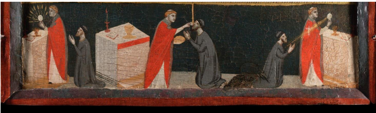
Couverture: Pacino di Bonaguida, Tabernacle Chiarito , tempera, gesso et or sur panneau, c. 1340, 101,3 x 113,5 cm, Getty Museum, Los Angeles, détail du panneau central.

Mots clés : peinture, Moyen Âge, Florence, commande, vision, or, médiation