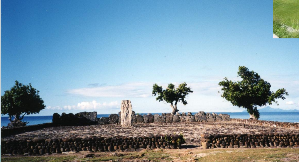
A gauche : un marae (espace cérémoniel) en Polynésie française.