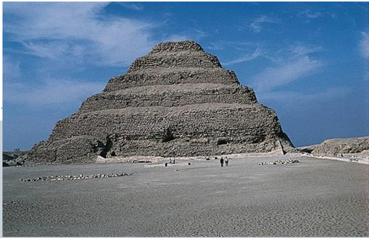
A gauche : pyramide du site de Djoser (Egypte).